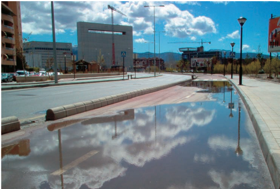
Figuras 1 y 2. Ciclopista en la ciudad de Granada, España