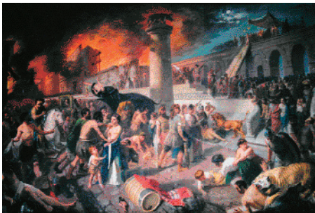
Figuras 17 y 18. Imágenes del incendio de Roma en el año 64 d.c.

Los rumores hacia Nerón fueron estimulados por el conocimiento, o la sospecha, de que el se alegró de que quedara mucho terreno despejado, puesto que deseaba construir un nuevo palacio. (...) Los edificios que escogió para que se reconstruyeran primero fue una mezcla juiciosa de santuarios religiosos y recreación pública. (...) Gran numero de casas particulares habían sido también destruidas, y el emperador estaba preparado con un ambicioso proyecto de urbanización. (GRANT M., 1975, pág. 152 y 163)