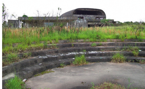
Figura 14. Parque Do Pedroso en Sao Paulo, Brasil