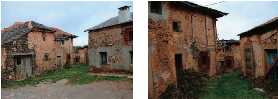
Figuras 15 y 16. Pueblo «fantasma» en Serracín, dentro de la provincia de Segovia en España, en el radicaron aproximadamente 130 personas en el siglo XIX, e inclusive el pueblo contaba con ayuntamiento y una escuela