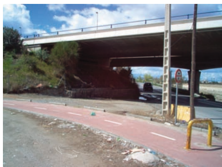
Figuras 3 y 4. Análisis comparativo de casos que comparten un mismo origen pero realidades diversas (A la izquierda Granada, España; a la derecha, México Distrito Federal)

En ambos casos es perceptible que se trata de una parte o porción de superficie terrestre que se deriva de un proyecto urbano de mayor escala, sin embargo existe una característica esencial que distingue uno del otro, y esta es, la apropiación que ha hecho la comunidad de un fragmento territorial con características espaciales similares, ya que en el caso representativo del Distrito Federal, el comercio informal se ha instalado en dicha superficie para colocar cotidianamente una serie de locales «ambulantes». Esta