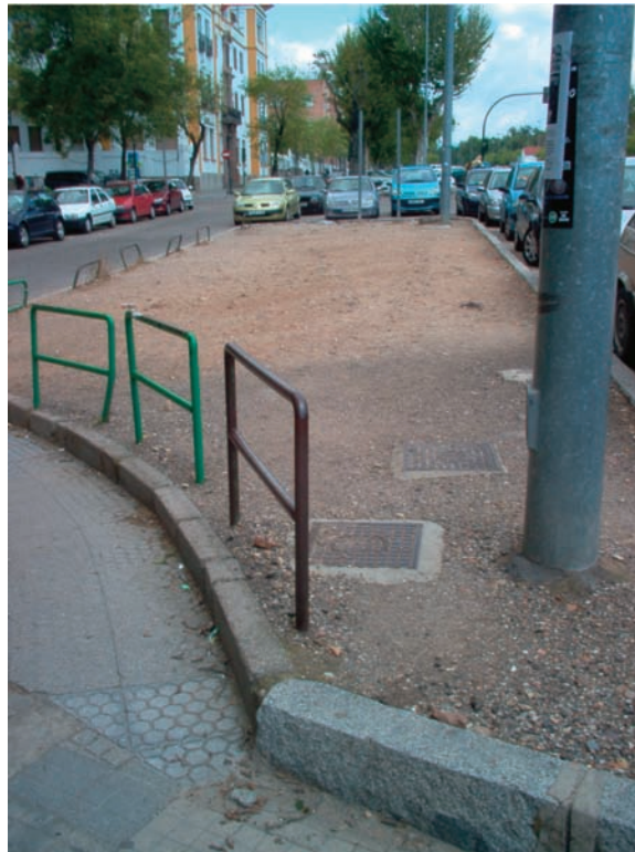
Figura 8. A la izquierda se muestra un tipo de fragmento urbano-público de tipo residual, cuyo origen deriva de un sobrante. Concretamente se encuentra en la ciudad de Cordoba, en España

ciudades. Para acomodarlos, las calles han sido destrozadas y convertidas en jirones dispersos, incoherentes y sin sentido para quien vaya a pie. La personalidad de la ciudad se diluye, hasta el punto que todos los lugares de la misma acaban pareciéndose con solo poner el cartel de —no hay sitio—. En las áreas mas duramente derrotadas, los usos que no pueden funcionar solos (tiendas, residencias, lugares de reunión o centros de trabajo) quedan separados unos de otros. Es difícil precisar cuanta de la destrucción llevada por los automóviles a las ciudades es realmente una respuesta a los problemas del transporte y las necesidades del trafico, y cuanta es debida a una pura falta de respeto a las otras necesidades, funciones y usos de las ciudades. Así como los reconstructores de urbes se quedan perplejos cuando intentan pensar en hacer algo distinto a sus proyectos de reordenación, pues no conocen otros principios respetables para organizar ciudades, así también los responsables de la construcción de autopistas,