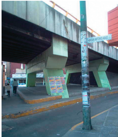
Figura 10. Puente vehicular en Av. San Antonio Abad, México DF

De manera específica utilizo el termino «disfraz» porque frecuentemente las autoridades gubernamentales resuelven a su entender este tipo de fragmentos residuales mediante la siembra de distintos tipos de vegetación basándose y escudándose en el argumento de que son «pulmones» para la ciudad. Sin embargo esto último es una falacia ya que según Jane Jacobs es la circulación de masa de aire la que en realidad realiza la función que impide que las ciudades se sofoquen.