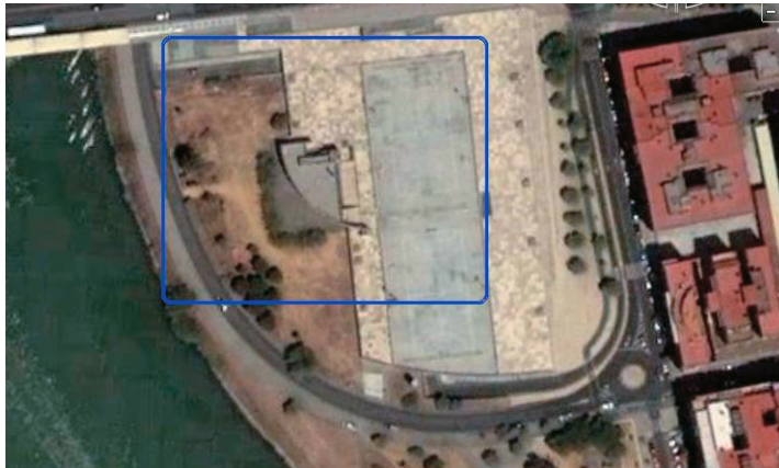
Figura 13. Vista aérea del conjunto