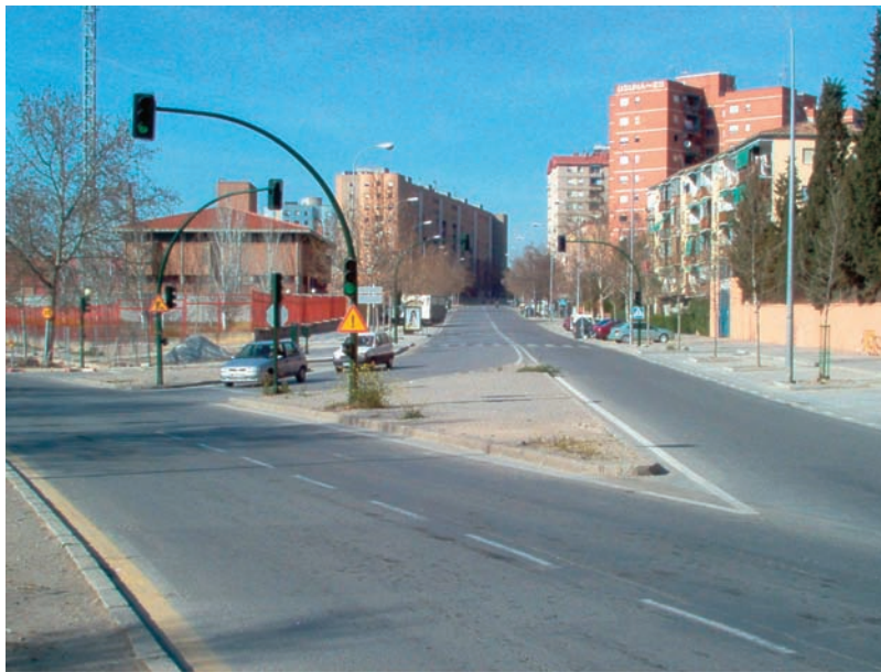
Figura 9. En la parte inferior se muestra la fotografía de un caso similar al anterior, cuyo origen de la misma forma deriva de un sobrante. En este caso el fragmento urbano se encuentra en la ciudad de Granada, en España

Aquí me gustaría abrir un nuevo paréntesis ahora para puntualizar de forma muy clara lo que significa el termino «nodo», en términos generales es una convergencia entre dos vías de transporte, las cuales por obviedad llevan a generar todo una infraestructura a su alrededor.