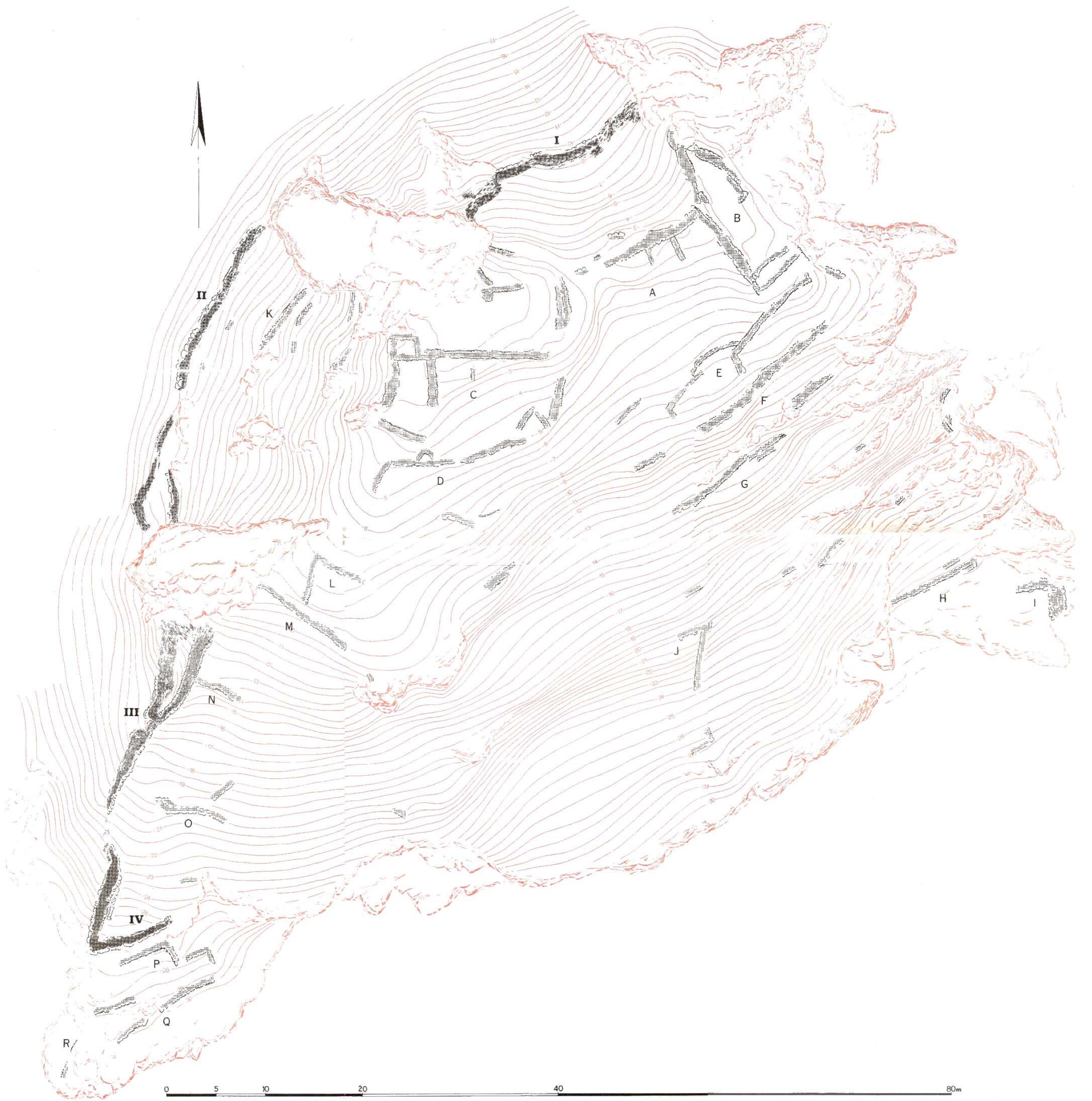
Plano topográfico del Cerro de Enmedio. 1:200