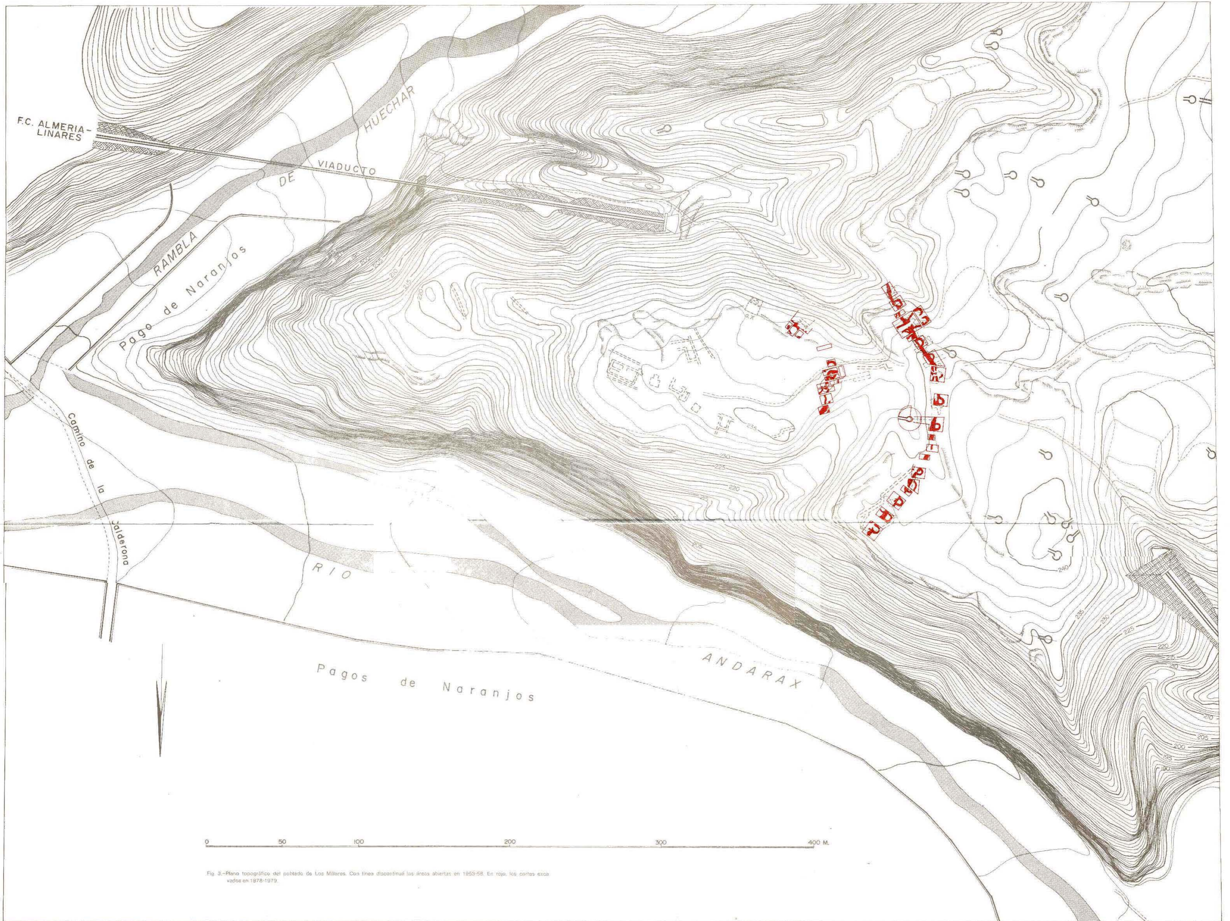
Fig 3.-Plano topográfico del poblado de Los Millares. Con líneas discontinuas los áreas abiertas en 1953-58. En rojo, los cortes de excavación en 1978-1979.