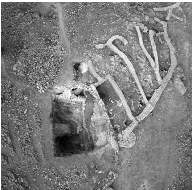
Lám. II.—Peñalosa. Vista aérea de la Terraza Inferior y de la cisterna.