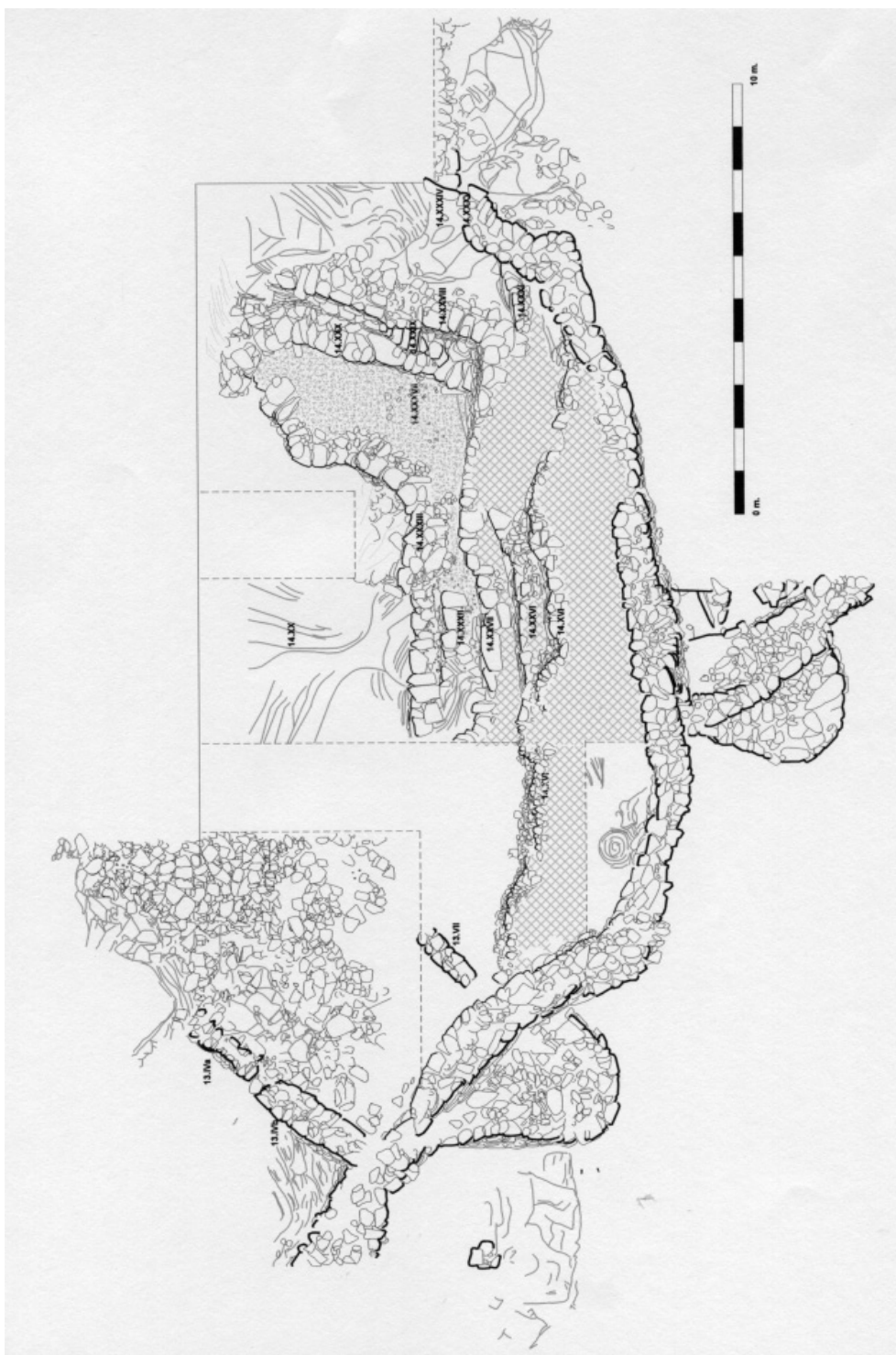
Fig. 1.—Plano de la cisterna de Peñalosa.