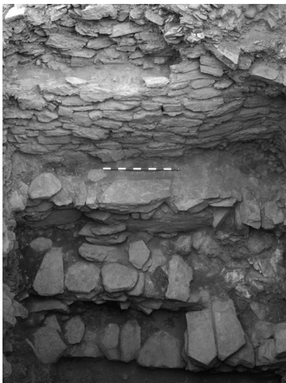
Lám. VI.—Peñalosa. Detalle del frente norte de la cisterna.