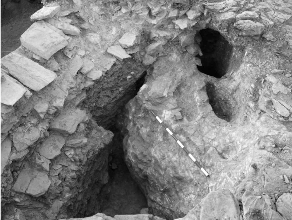
Lám. VII.—Peñalosa. Detalle de las estructuras excavadas en el frente conglomerático del lado oeste de la cisterna.