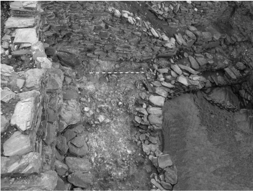
Lám. IV.—Peñalosa. Vista oeste de la cisterna con el manto conglomerático en primer término y al fondo el afloramiento de la pizarra.