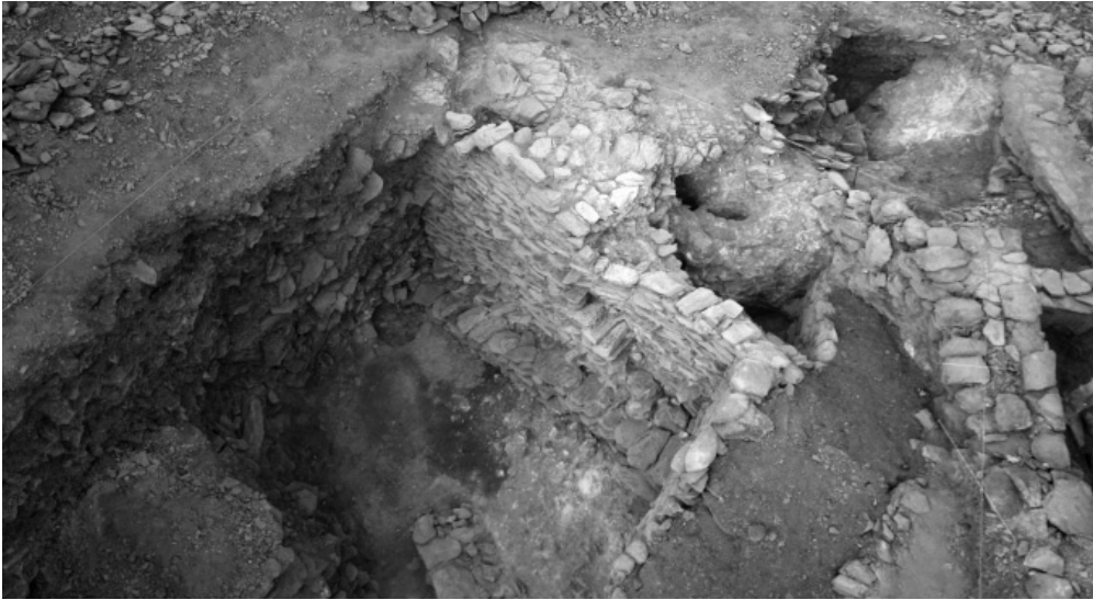
Lám. III.—Peñalosa. Vista de la cisterna en su lado oeste.