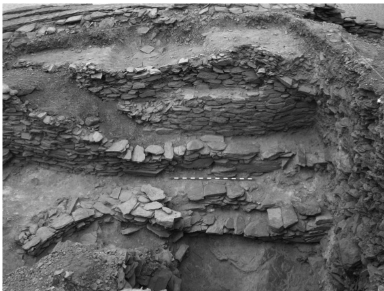
Lám. V.—Peñalosa. Frente norte de la cisterna.