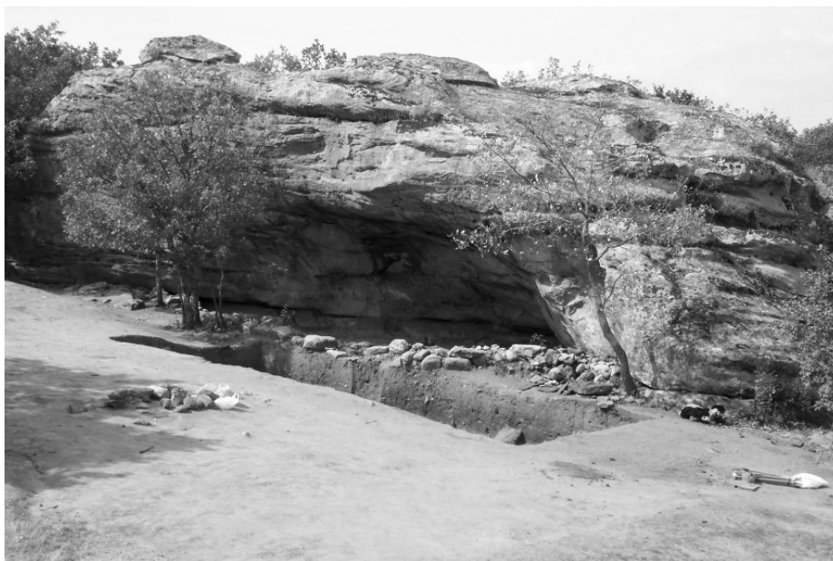
Lám. I.—El Abrigo de la Dehesa/Carlos Álvarez (Miño de Medinaceli).