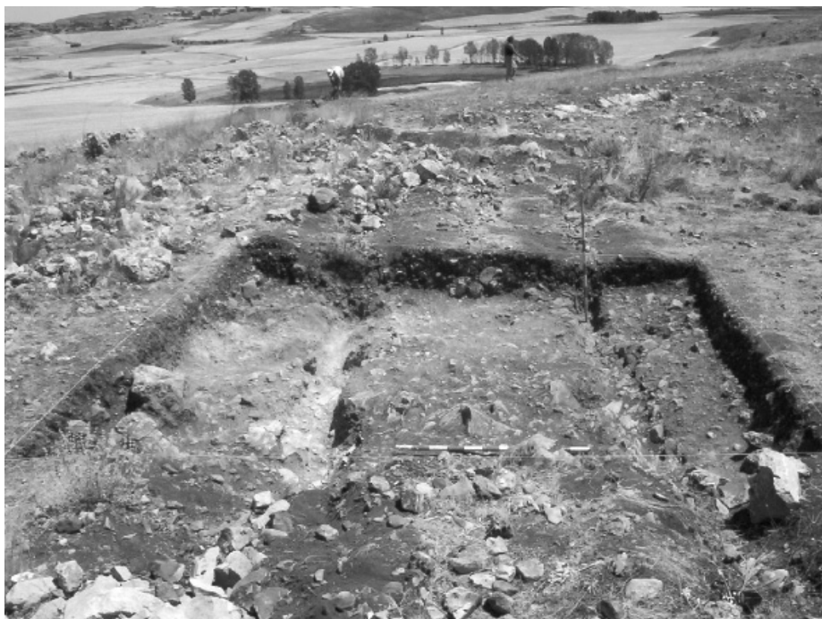
Lám. II.—Los Dolientes I (Miño de Medinaceli).