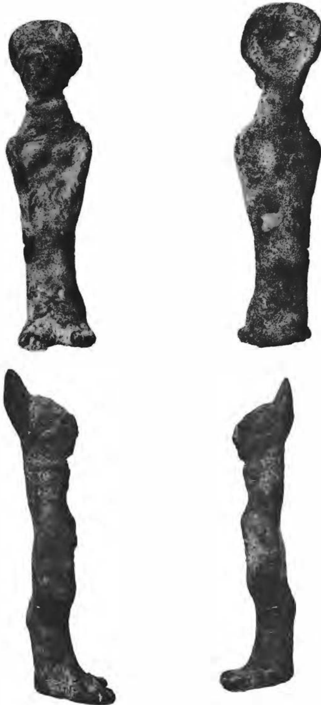
Lám. I.—Exvoto ibérico de Granada.