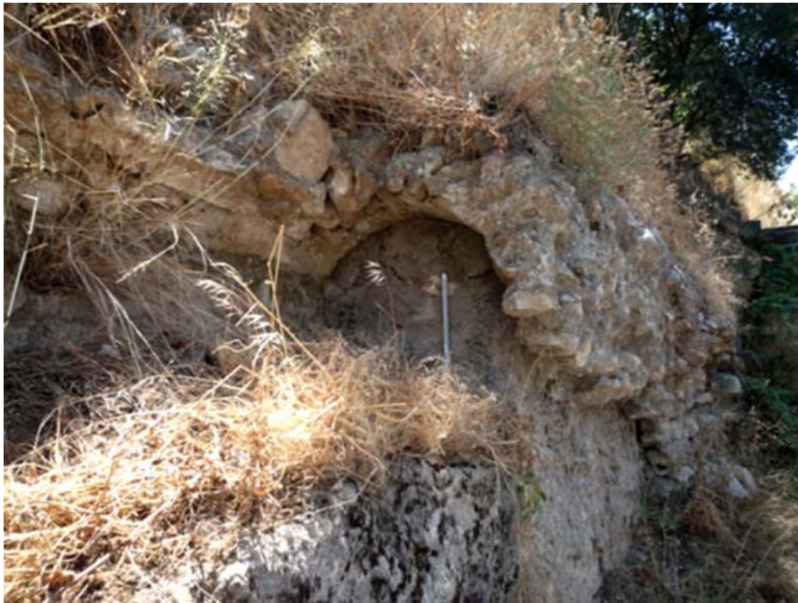
Lám. I.—Canalización de mampostería en Antioquía.