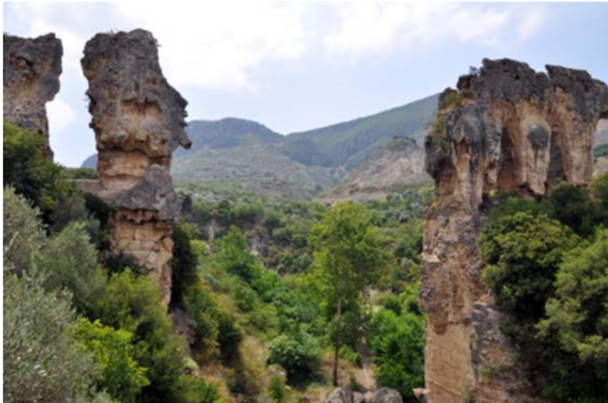
Lám. II.—Puente-acueducto en Antioquía.