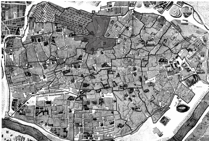
Figura 1. Extensión y límites de las collaciones de Santa Lucía (línea de puntos), San Román (línea discontinua) y Santa Catalina (línea continua) en la ciudad de Sevilla.

Fuentes: AHPSe, CELOMAR, sig. 19883, cuaderno 94.38, 1554, ff. 81r-88v y 986r-998v; cuaderno 94.45, 1548, ff. 646 y ss.; Plano de Sevilla de Pablo de Olavide , 1771, Real Academia de la Historia, colección Departamento de Cartografía y Artes Gráfica, sig. c-Atlas E, II, 17, nº de registro 980.