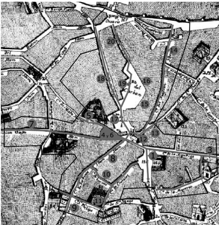
Figura 2. Localización de las calles de Santa Catalina en 1554 y correspondencia con 1771 y la actualidad.