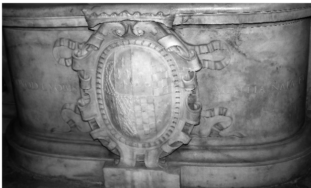
Ilustración 8. Inscripción epigráfica con escudo del Marqués del Cenete y de María de Fonseca situados en la parte posterior del sepulcro. Autora 30 .