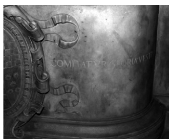
Ilustraciones 6 y 7. Inscripciones epigráficas del sepulcro situadas en la parte anterior izquierda. Autora 29 .