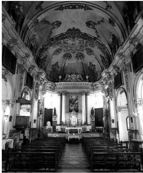
Ilustración 1. Interior de la iglesia del Real Monasterio de la Santísima Trinidad de Valencia. Mateo Gamón.