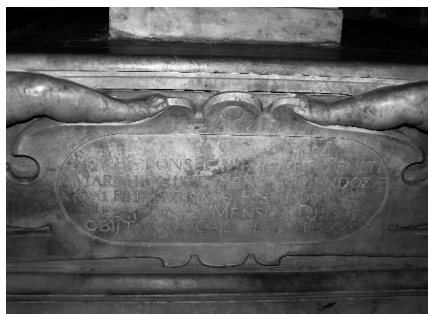
Ilustraciones 9 y 10. Cartelas situadas en los laterales derecho e izquierdo del sepulcro con sentidos epitafios referentes al Marqués del Cenete y María de Fonseca. Autora 31 .