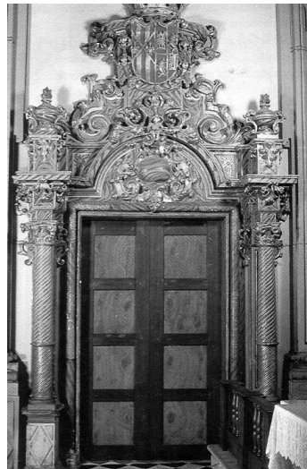
Ilustración 3. Entrada al sepulcro de María de Castilla en el convento del Real Monasterio de la Santísima Trinidad de Valencia y su ubicación en el claustro. Mateo Gamón.