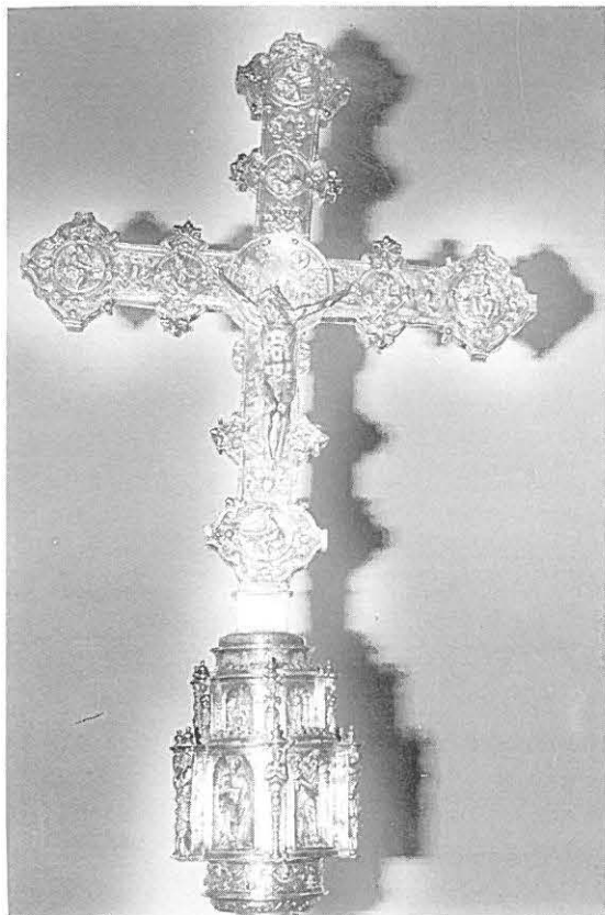
10.—Cruz parroquial de Montejícar.