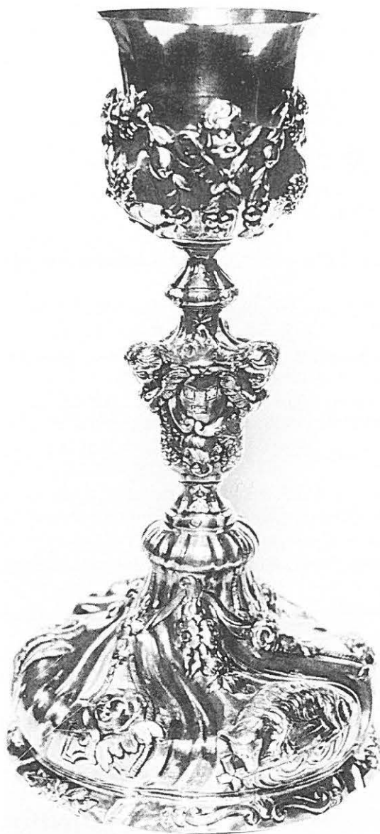
1.—Cáliz cordobés de 1759.

42. CÁLIZ. Mt.: Plata en su color. Est. de c.: Muy bueno. Md.: 25, 8'4 y 15'3 cm. respect. de alt., dm. de la copa y dm. de la base. Mrs: Se aprecian 2 muy frustas: una con MA...Z y otro en el que se advierte un 7. Desc.: Copa acampanada y lisa, partida en dos por un cordón de perlas; astil abalaustrado con nudo tronco-cónico invertido, también con otro anillo de perlas, como en la base, donde aparecen dos círculos de perlas concéntricos, como su interior que es de tronco de cono con generatriz ligeramente embebida; es pieza casi igual a la que señalamos en Montejícar. Plat. fech, taller y estilo: Podría tratarse de la dinastía cordobesa de los Martínez, de hacia 1827 y estilo Neoclásico.