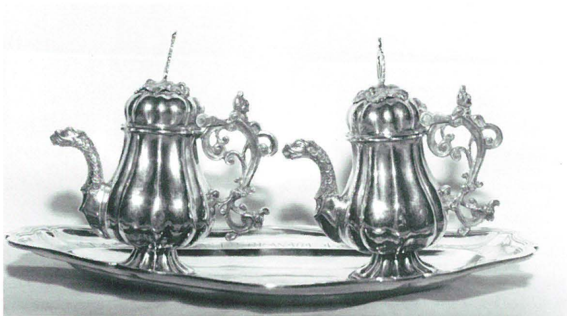
5.—Vinajeras granadinas de 1804.

75.-76. INCENSARIO y NAVETA. Mt. Plata en s.c. Est. de c.: Bueno. Mds.: incensario, 22, 12 y 8 cm, respect. de alt., diám. de la casca y diám. del pie; la naveta es de 12'5 x 20 cm. respect. de alto y ancho. Mrs.: Aparte del punzón de la ciudad de Granada en el siglo XVIII, que es una granadilla con las letras de FY en su interior, hay dos marcos rectangulares. uno con RVIZ y el otro frustro, CA_. Descríp.: El incensario tiene forma bulbosa y es calado, en la campana de humos, y todo él repujado de hojas y rocallas, que prosiguen