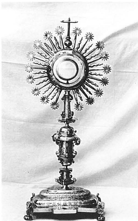
6.—Custodia de h. 1665.

81. COPÓN (Fig. 7). Mt.: Oro y plata sobredorada. Est. de c.: Bueno. Mds.: 39, 27, 12'5 y 19 cm. respect. de altura con tapadera, sin ella y de diáms. de la copa y de la base. Mrs.: No aparecen. Descripción: Sobre una base circular y en grada (un toro entre dos escocias), con motivos grabados de asunto geométrico e imitación de óvalos y esmaltes, álzase el astil, a partir de una moldura cilíndrica entre anillos, sobre la que se asienta el nudo, que tiene forma de ánfora con asas sobrepuestas, seguido de un cuello de botella y varias molduras más, anilladas o de cuello cóncavo, sobre las que se asienta un recipiente cilíndrico