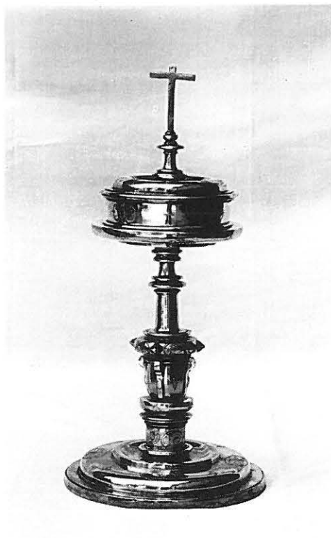
7.—Copón de h. 1650.