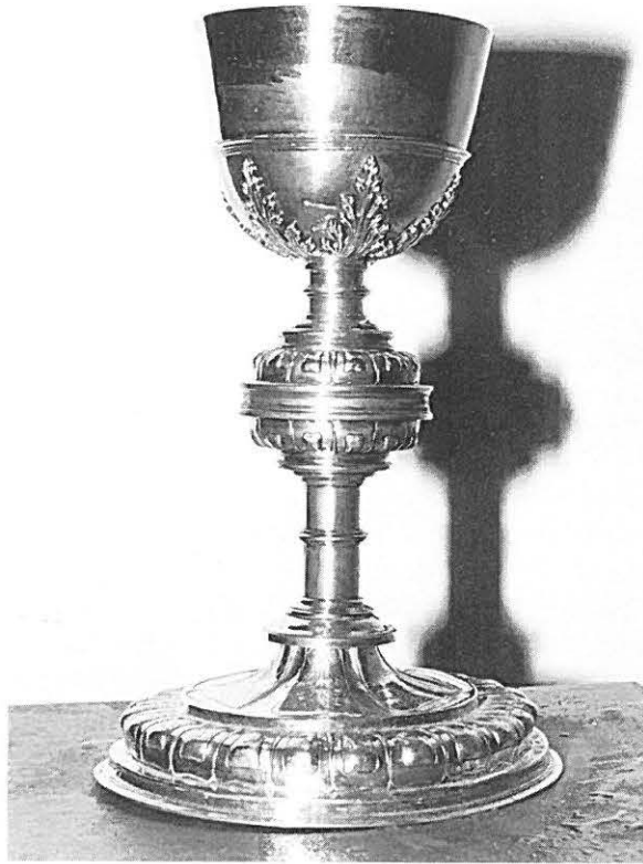
3.—Cáliz de F. Téllez. Siglo XVI.

da). Artífice, fecha y estilo: Sin duda obra de Francisco Téllez, de la primera mitad del siglo XVI y estilo Plateresco.