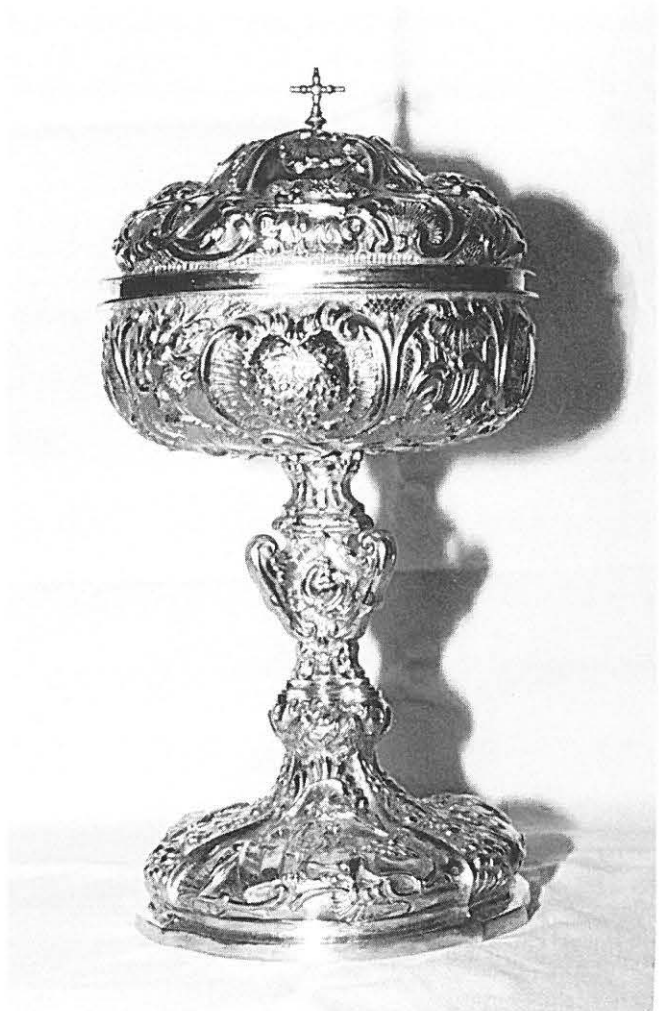
4.—Copón granadino de h. 1770.

73. COPÓN. Mt.: Plata sobredorada. Est. de c.: Muy bueno. Mds.: 30, 27'5, 15 y 12 cm. respect. de alt. con tapadera, sin ella y diáms. de la copa y de la base. Mrs.: No