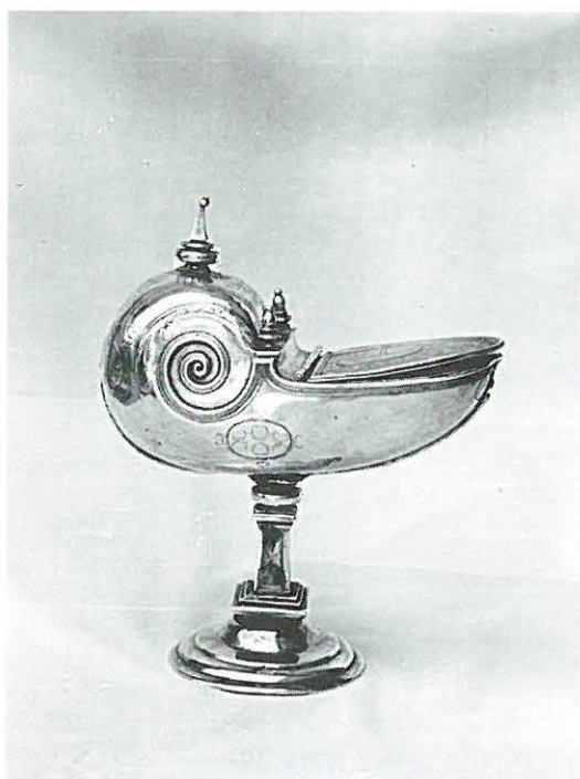
9.—Naveta de Miguel de Guzmán. 1807.