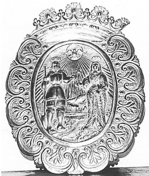
2.—Placa-estandarte de S. Isidro. H. 1795.

59. PLACA DEL ESTANDARTE (Fig. 2), de San Isidro y Sta. María de la Cabeza. Mt.: Plata en s.c. Est. de c.: Bueno. Mds.: 30 x 25 cm. Mrs.: No aparecen. Descr.: Tiene forma de escudo coronado; el interior es un gran óvalo repujado con las figuras de San Isidro labrador en un campo y, a su lado, Sta. M. a de la Cabeza; ambos, bajo los rayos del Espíritu Santo. Fecha, taller y estilo: Probable pieza granadina de finales del siglo XVIII y estilo Rocó.