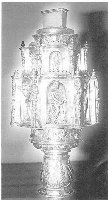
11.—Detalle de la macolla.

98-103. OTRAS ORFEBRERÍAS de interés. Mt.: Plata en s.c. Est. de c. Bueno. Son éstas: NAVETA (Fig. 12) de 8'7, 15'5 y 7'7 cm. respect. de alt., eslora y diám. del pie; verdadera embarcación con el detalle del ensamblaje del casco y borde de la cubierta. No va marcada pero es igual a otras piezas catalogadas (Fig. 31 del Vol. I. y figs. 48, 252, 281 y 368 del Vol. II. de nuestra Orfebrería Religiosa de Granada ), de taller granadino del fin del s. XVI y estilo Plateresco. Hay también un OSTENSORIO (50'5, 26'5 y 18'3 cm. respect. de alt., diáms. del sol y de la base) con resplandores curvados y rectos (18+16), los últimos terminados en estrellas, obra granadina de principios del s. XIX Neoclásico. Una CONCHA BAPTISMAL (12'7 x 4'8 cm.) en forma de venera, con pletina doblada en asa, y hasta 3 CÁLICES del siglo XIX: Uno, de 24, 8'3 y 13 cm. respect. de alt. y diáms. de la copa y de la base, marcado por BEGA y con el punzón de un león rampante, lo que indica que es de obrador cordobés, tal vez del artífice Martínez (como el Núm. 3 de Sto. Domingo, de este mismo catálogo, pues es igual que él), de hacia 1827, marcado por Diego de Vega y Torres. El otro, mide 27, 9'9 y 13'4 cm. respect. y está, marcado por TORRUELLA (platero