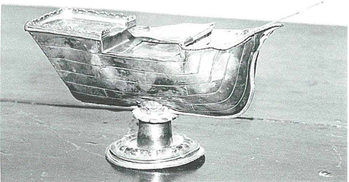
12. Naveta de Montejícar. Siglo XVI.