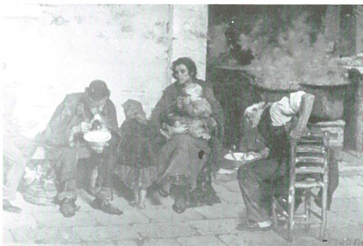
4. Reinaldo Giudici. La sopa de los pobres (1884-1885). Col. Museo Nacional de Bellas Artes, Buenos Aires.

(pinturas, esculturas y dibujos), se destacaron lienzos como Las guachitas , cuadro de corte costumbrista realizado por Eduardo Sívori, el Corsario la Argentina de Martín Malharro, La vuelta del malón de Ángel Della Valle, y Sin pan y sin trabajo de Ernesto De la Cárcova. Estas dos últimas fueron galardonadas ese mismo año en la Exposición de Chicago, la primera —lo mismo que La sopa de los pobres de Reinaldo Giudici— con Medalla de Oro y la de De la Cárcova con Gran Premio de Honor.