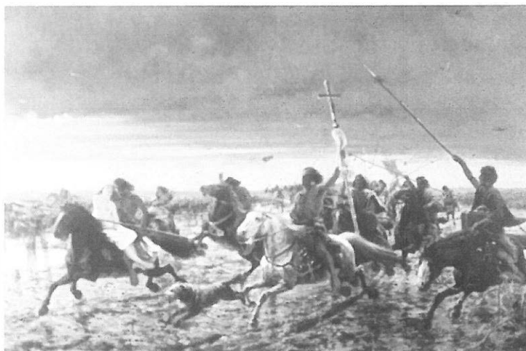
1. Ángel Della Valle. La vuelta del malón (1892). Col. Museo Nacional de Bellas Artes, Buenos Aires.

La sala de conferencias, conciertos y exposiciones de la nueva institución cobijó durante los seis años siguientes, hasta la desaparición de El Ateneo, disertaciones de escritores y artistas —entre ellas encendidas discusiones en torno al nacionalismo en el arte, a partir de 1894, con Obligado, Oyuela y Schiaffino como mayores animadores—, conciertos como los organizados por el maestro Alberto Williams, y las exposiciones de