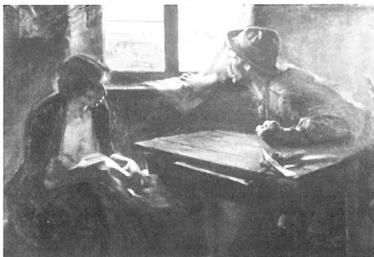
3. Ernesto De la Cárcova. Sin pan y sin trabajo (1893-1894). Col. Museo Nacional de Bellas Artes, Buenos Aires.

alternaron su interés por adquirir las obras extranjeras —en general de segunda categoría— que llegaban periódicamente a Buenos Aires, con la compra de obras de autores locales. Por este motivo los marchantes europeos eligieron a la Argentina como el paraíso de sus negocios, sabiendo que allí podían hacer su agosto con exhibiciones de artistas del Viejo Continente.