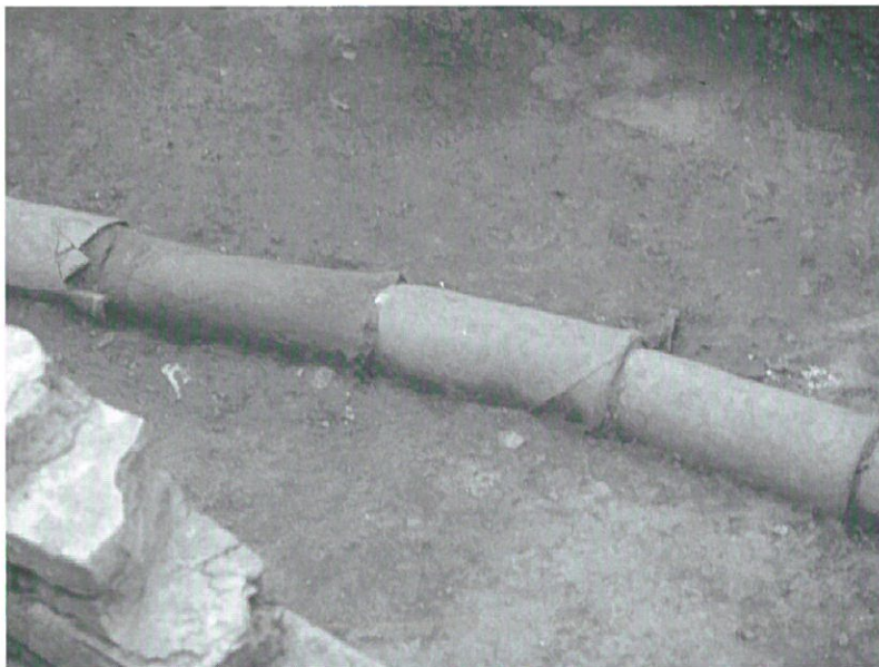
6. Conducción de agua potable en barro.

barro en el Realejo sean obligados a enviar una persona a limpiar la alberca. En otras casas e inmuebles como los cármenes y monasterios la presencia de una alberca se explica por la necesidad de almacenar agua para regar la huerta 43 .