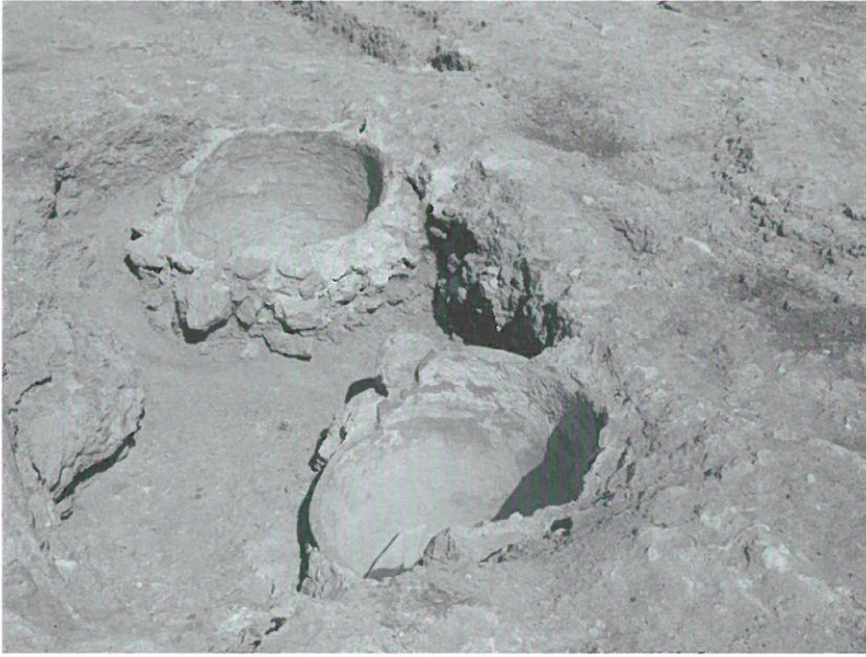
4. Tinajas de agua de una casa granadina de la parroquia de San Ildefonso.

Puerta de Bibarrambla a la plaza del mismo nombre y por la Puerta de los Molinos al Campo del Príncipe, el acceso a otros espacios urbanos requería licencia 31 .