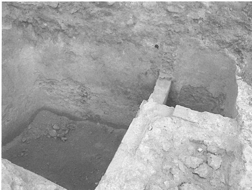
3. Aljibe con pequeño depósito para depurar el agua.

la dicha agua de un ramal a otro, siendo toda el agua de una acequia y cabiendo el agua que se acrecientare por el tal ramal donde se ha de mudar, que lo pueda mandar .... 28