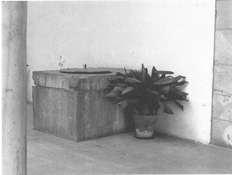
1. Brocal de pozo en el Patio de los Mármoles del Hospital Real de Granada.

Gracias a un desarrollado sistema de evacuación de agua sucia fue posible el uso doméstico de letrinas. La letrina, independientemente del tamaño de la casa, es una constante en la vivienda urbana hispanomusulmana, expresa una manifiesta preocupación por la higiene, propia de espacios densamente poblados 8 . Era una habitación independiente 9 , de pequeño tamaño (2 ó 3m 2 ), cuadrada o rectangular, elevada en relación al suelo de la habitación desde la que se accedía. Solía estar emplazada en una de las crujías del patio, separada de éste mediante un pasillo acodado que impedía que su interior fuera visto desde allí 10 . Mediante una atarjea que atravesaba el muro desaguaba en un pozo negro situado en la calle. El pozo se excavaba en la roca y se tapaba con una losa de pizarra 11 .