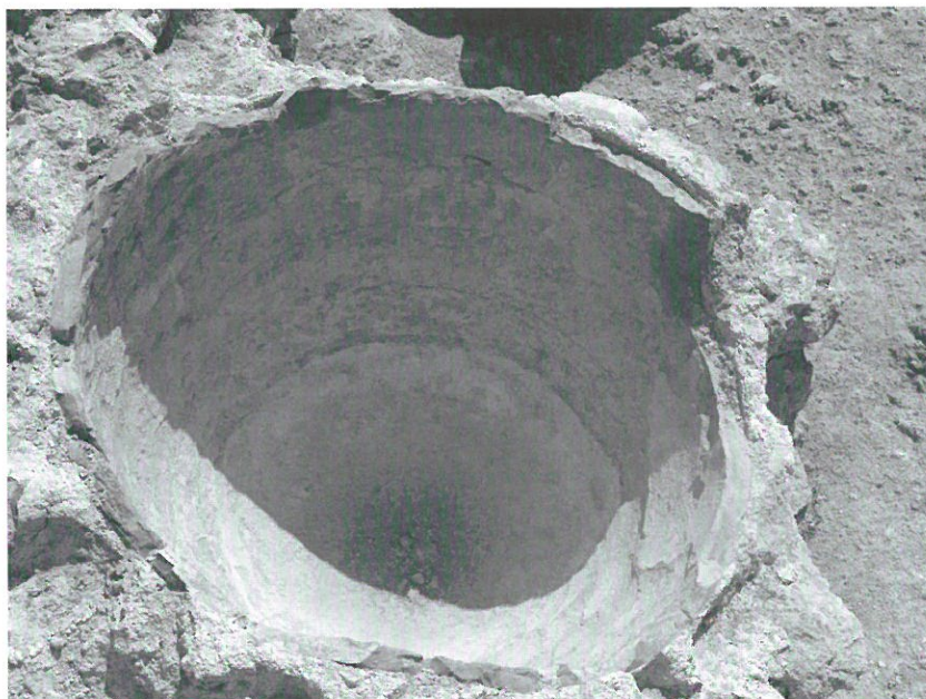
7. Pequeña tinaja de agua.

de las conducciones de agua, los arquitectos más experimentados siguieron la norma de o bien encauzar también el agua de lluvia que escurría por medio de canales de modo que no salpicara a los transeúntes, o bien recogerla en el impluvio con el fin de dejarla en el interior de cisternas para uso de las personas o encauzarla hacia determinados lugares, para que se remojaran los desechos domésticos y molestar lo menos posible al olfato y la vista de las personas 49 .