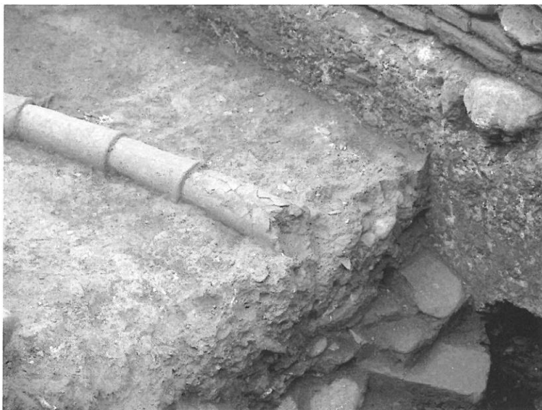
5. Tubería para llevar agua potable a una casa del siglo XVI.

o realizar cualquier otro tipo de obra que implicase modificación alguna del volumen de agua al que se tenía derecho: Otrosi ordenamos e mandamos que ninguna persona de las que tienen agua sin salida en sus casas no sea osado de engrandar el maavez o tinaja o otro edificio alguno que le esta dado e señalado o se le diere e señalare, ni de hazer aljibe ni otro edificio mas del que le esta dado e señalado o se le diere como dicho es, so pena que pierda el agua que toviere en la dicha su casa e que a su costa se deshaga todo el edificio 39 .