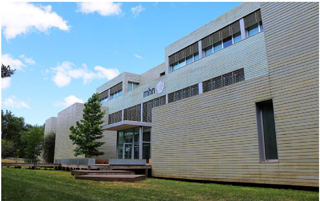
3. Museo de Historia Natural de la Universidad de Santiago de Compostela

Otras universidades históricas, como Santiago de Compostela o Zaragoza, destacan por sus museos científicos. El Museo de Historia Natural de la Universidad de Santiago de Compostela, está enclavado en un edificio proyectado por el arquitecto César Portela, y fue construido entre 2009 y 2011 (Fig. 3). Sus colecciones tienen origen en el antiguo museo iniciado en 1840 y consta de cuatro secciones, de zoología, botánica, geología y dioramas. También esta universidad tiene salas de exposiciones temporales, en el Colegio Fonseca y la Iglesia de la Universidad, así como en la Sala de Exposiciones Isaac Díaz Pardo en el Campus de Lugo. La Universidad de Zaragoza inauguró su Museo de Ciencias Naturales en 2015, en el edificio del Paraninfo. Surgió a partir de la fusión de dos colecciones, la Paleontológica y la Longinos Navás. También desde 2004 se organizan exposiciones temporales en este edificio histórico, de finales del siglo XIX, bien de interés cultural, rehabilitado entre 2006 y 2008.