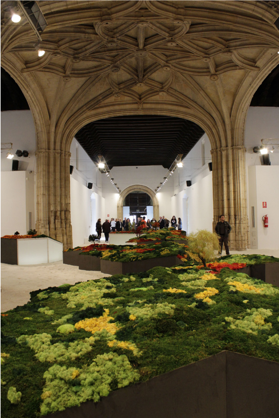
4. Crucero del Hospital Real Universidad de Granada (Exposición Esther Pizarro, 2014. Fuente: Universidad de Granada)