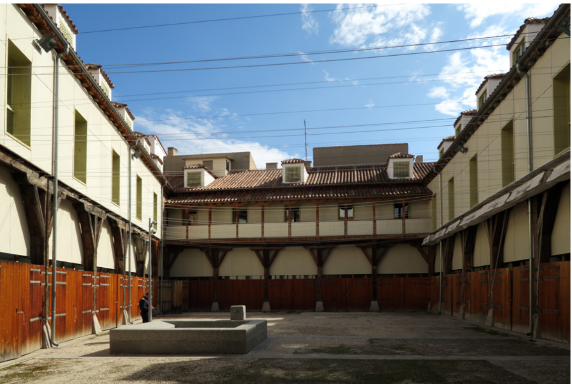
5. Centro Cultural La Corrala, Universidad Autónoma de Madrid