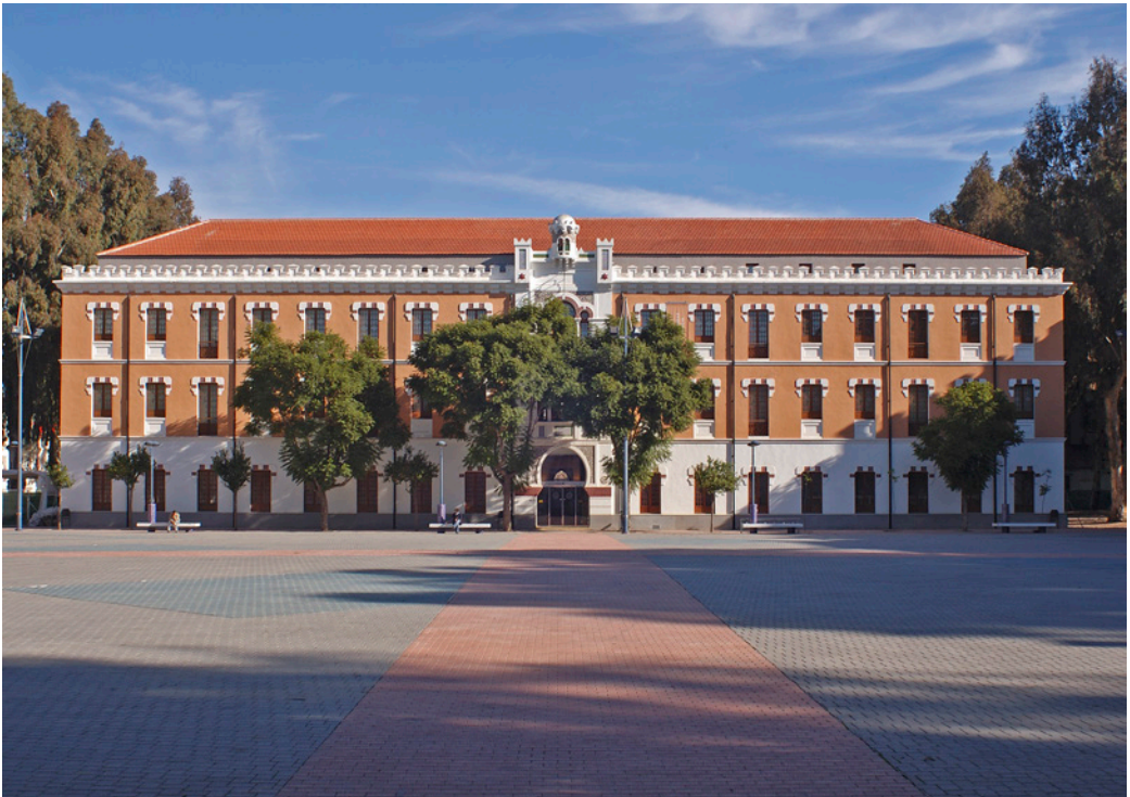
7. Museo de la Universidad de Murcia

de Documentación y Estudios Avanzados de Arte Contemporáneo), el Centro Párraga (Centro de Cultura Contemporánea de la Región de Murcia), ambos pertenecientes a la Comunidad Autónoma, y el pabellón 2 es el denominado Cuartel de Artillería, Espacio de Arte y Cultura, vinculado al Ayuntamiento de Murcia. Es en este entorno creativo donde está el Museo, algo positivo, ya que tanto la sede del Rectorado, como los campus de La Merced y de Espinardo, se encuentran lejos del mismo, lo que pudo verse en un principio como una desventaja. En el Campus de Espinardo, en la Facultad de Biología, está el antiguo Museo José Loustau, de 1916, formado por colecciones botánicas y mineralógicas. En la Facultad de Veterinaria se encuentra el Museo Anatómico y en la de Veterinario Anatómico y en el Jardín del Voluntariado, al aire libre, está el Museo de Rocas de la Región de Murcia, adscrito al Departamento de Química Agrícola, Geología y Edafología. También en este campus está el CRAV, centro de recursos audiovisuales con una interesante colección de fotografía antigua. En la sede del Rectorado, en el centro de Murcia, está la colección D'Estoup, conformada en el siglo XIX con pinturas del siglo XVII, que fueron donadas en 1948 a la universidad.