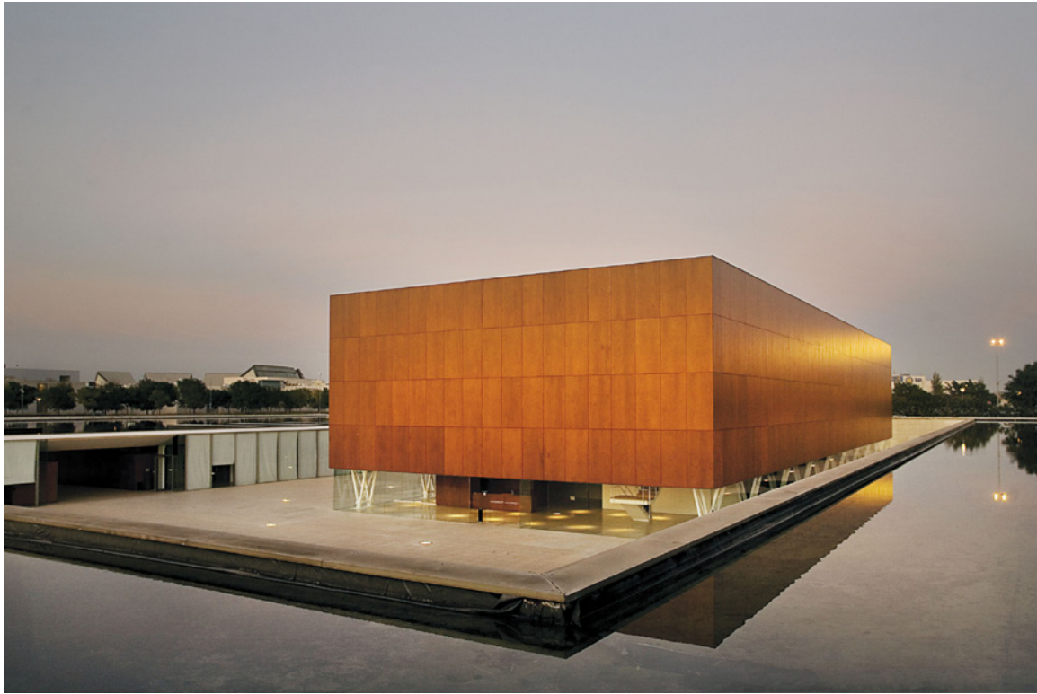
6. Museo de la Universidad de Alicante

Y como última tipología, estarían los museos creados ex profeso como centros culturales multifuncionales. El más antiguo de todos ellos es el Museo de la Universidad de Alicante (MUA), creado en diciembre de 1999, de nueva planta, proyectado en 1994 por Alfredo Payá y enclavado en el campus de San Vicente del Raspeig (Fig. 6). Es como una caja de madera de filosofía muy lecorbusiana, rodeado por una lámina de agua y un gran patio excavado. El museo tiene por objetivos la dinamización cultural, el aprendizaje, encuentro y confrontación y aunque nació con un propósito multidisciplinar hoy tiene una clara vocación contemporánea. Su colección museográfica está formada por obras de Picasso, Miró, Chillida, Sempere y fotografías de Shulman, entre otros. En la actualidad se centran principalmente en la organización de exposiciones temporales.