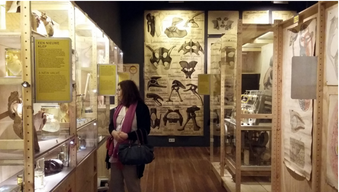
6. Museo de la Universidad de Utrecht.

Otro proyecto destacado de integración es el Jardín de las Ciencias de Estrasburgo 27 , gestionado por el Servicio de Mediación Científica de la Universidad, éste se encarga de la conservación, el inventario y la valorización del patrimonio de la Universidad y trata de hacer accesible a los ciudadanos –con especial atención al público escolar– el mundo de la investigación científica en toda su diversidad. Su vocación es acercarse a la ciencia de una manera lúdica y creativa.