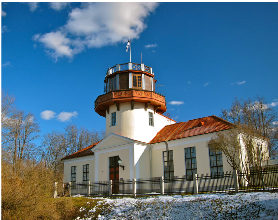
5. Observatorio histórico. Universidad de Tartu

Además, hay universidades europeas reconocidas como Patrimonio de la Humanidad: Alcalá de Henares, Coímbra, Jardín Botánico de la Universidad de Padua, Struve Geodetic Arc (incluye el Observatorio Astronómico de la Universidad de Tartu Universidad, Estonia). (Fig. 5)