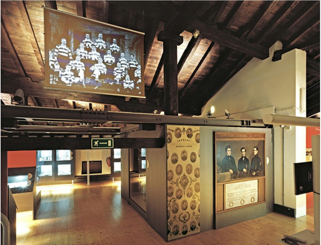
4. Museo Europeo de Estudiante, Universidad de Bolonia.

Los museos más recientes de este tipo son, por un lado, el Museo Académico de la Universidad e Coimbra creado con el objetivo de recoger y difundir el legado de la Universidad. Este museo alberga una vasta colección de materiales y objetos que documentan los aspectos más variados de la historia y vida académica y en el que en su gestión se encuentran implicadas asociaciones de exalumnos. Y por otro, el Museo del Estudiante ( Museo Europeo degli Studenti MEUS ) 16 de la Universidad de Bolonia inaugurado en el año 2000 que contiene numerosos materiales diversos que documentan la vida de los estudiantes durante ocho siglos, abarcando lo relativo a asociaciones, movimientos de protesta, tradiciones sociales, institucionales -incluyendo las festivas-; y también son la muestra de la transformación social y la educación universitaria. Una selección significativa de 400 objetos y documentos divididos en cinco secciones se exponen en sus salas. (Fig.4)