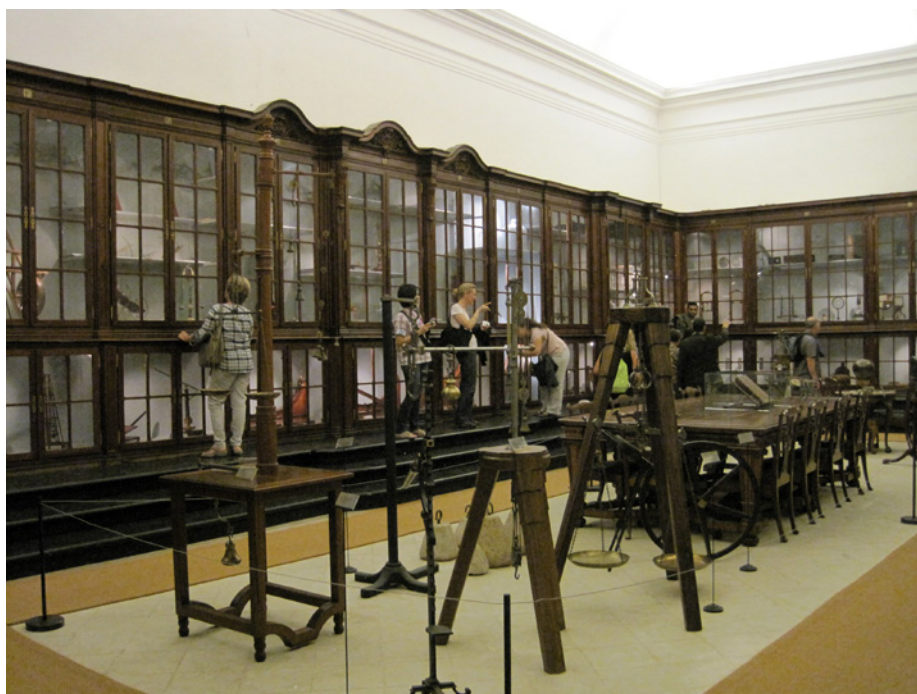
3. Gabinete de Física. Universidad de Coímbra.

Los gabinetes de física se consideraron un tipo especial de colecciones, desde el siglo XVII encontramos los primeros gabinetes de física, siendo el de la Universidad de Leiden creado en 1675 uno de los más antiguos, tenía una sala especial con su correspondiente equipación para la enseñanza a través de la experimentación, se le conocía como el Theatrum physicum , en la actualidad sus colecciones forman parte del Museo Boerhaave, dedicado a la historia de la ciencia y la medicina. Una de las colecciones más destacadas de Europa se encuentra el Museo de la Ciencia de la Universidad de Coímbra -declarado como sitio histórico por la Sociedad Europea de Física en 2016-, el gabinete de física y sus colecciones fueron transferidos desde Lisboa en 1772 (Fig.3). En la actualidad, la existencia de observatorios e instrumentos de astronomía son comunes en las universidades europeas, importantes ejemplos los encontramos desde Lisboa, pasando por Italia, hasta llegar al observatorio histórico de la Universidad de Tartu en Estonia 11 .