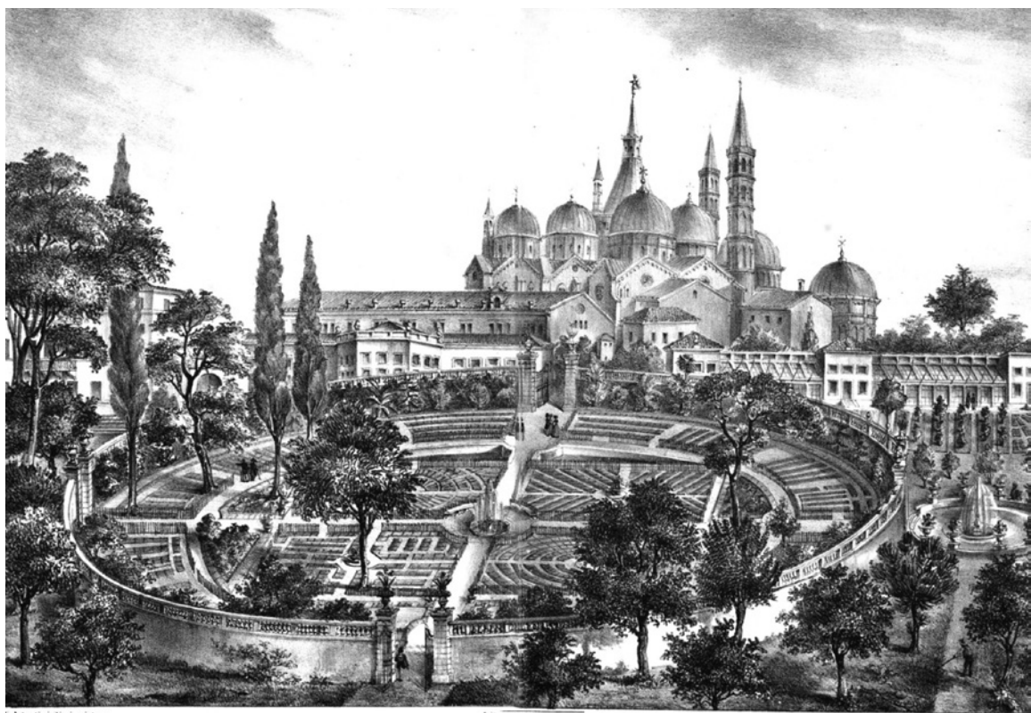
1. Litografía. El Jardín botánico de Padua. s. XVII

Estas colecciones amplían sus objetivos teniendo como referente más importante al Museo Ashmolean, asociado a la universidad de Oxford. Este es el primer museo reconocido por la mayoría de los autores “el Ashmolean nació cuando el rico y anticuario Elías Ashmole regaló su colección a la Universidad en 1682. Lo hizo -porque el conocimiento de la naturaleza es muy necesario para la vida y la salud humanas-. Se inauguró como el primer museo público de Gran Bretaña y el primer museo universitario del mundo” 6 . En este museo se custodiaban ricas colecciones de ciencias naturales, antigüedades y etnografía, estaba abierto al público de manera reglada y su organización constituyó un modelo para los museos universitarios. Su estructura contaba con un complejo arquitectónico, organizativo y funcional coherente en el que confluían un repositorio de materiales raros, un instituto de investigación y una academia educativa. Interesante es que durante doscientos años la dirección de las cátedras académicas la ostentaba un profesor y la relación del museo y la universidad era muy estrecha. Hoy se reconoce que la mayor contribución del Museo Ashmolean es institucionalizar la triple