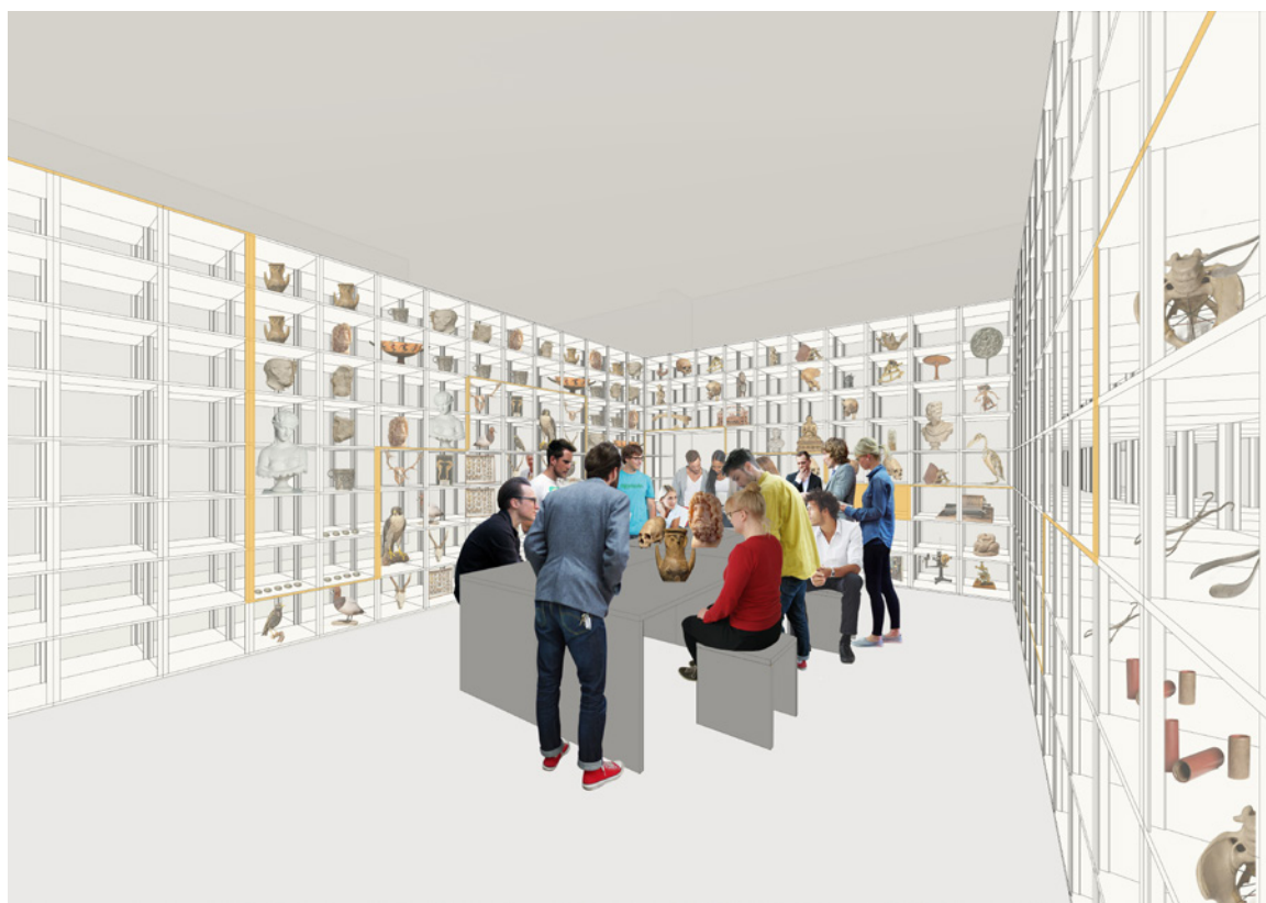
7. Forum Wissen / Foro del Conocimiento. Proyecto Outside the Object Lab. Museo Académico de Göttingen. Centro para el Desarrollo de las Colecciones. Universidad Georg-August de Göttingen

relacionadas con ellas. Se concibe como un espacio público donde se fomenta el diálogo a través de la conexión de tres áreas o campos de acción que tienen la misma importancia: 1. Colección, conservación y catalogación, 2. Investigación y enseñanza y 3. Presentación y comunicación. La construcción del vínculo se consigue entrelazando espacios, temas e ideas con el objetivo de crear conocimiento, mostrando a su vez el proceso; para ello, se generan distintos itinerarios y perspectivas propiciando ese diálogo entre diferentes tipos de público: el académico y el general 29 . (Fig. 7)