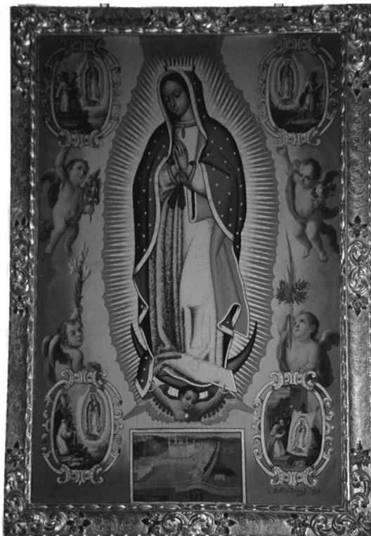
3. Virgen de Guadalupe . Iglesia del Convento de la Encarnación de Granada. Antonio de Torres. Siglo XVIII. Óleo sobre lienzo.

con más exactitud. Entre las firmas observamos artistas de renombre, de segunda fila y desconocidos. Dentro de los primeros se incluye el artista Antonio de Torres. Aunque no es lo habitual, se conocen bastantes datos biográficos suyos. Nació en Puebla de los Ángeles (México) en 1666. Se dedicó a la pintura desde su juventud, perfeccionándose en uno de los más florecientes talleres poblanos. Su primera obra conocida es una Santa Leocadia realizada en 1703. Trabajó para la Iglesia de la Profesa, la de San Francisco, la de San Luis de Potosí, el Colegio de Guadalupe en Zacatecas, llevó a cabo varios avalúos de obras... En 1721 acudió a inspeccionar el lienzo de la Virgen de Guadalupe junto con los hermanos Rodríguez Juárez. Gozó de una gran popularidad en el virreinato, dejando una amplia producción pictórica. Algunas de sus obras inducen a pensar que pudo trabajar en el taller del afamado artista Cristóbal de Villalpando. Una de sus pinturas guadalupanas se encuentra en la Capilla de la Salud de San Miguel de Allende. En la mayoría de ellas se incluyen las cartelas de las apariciones, a menudo con forma octogonal y decoración de angelitos y flores. Aunque no alcanzó la maestría de algunos de sus contemporáneos adquirió una gran