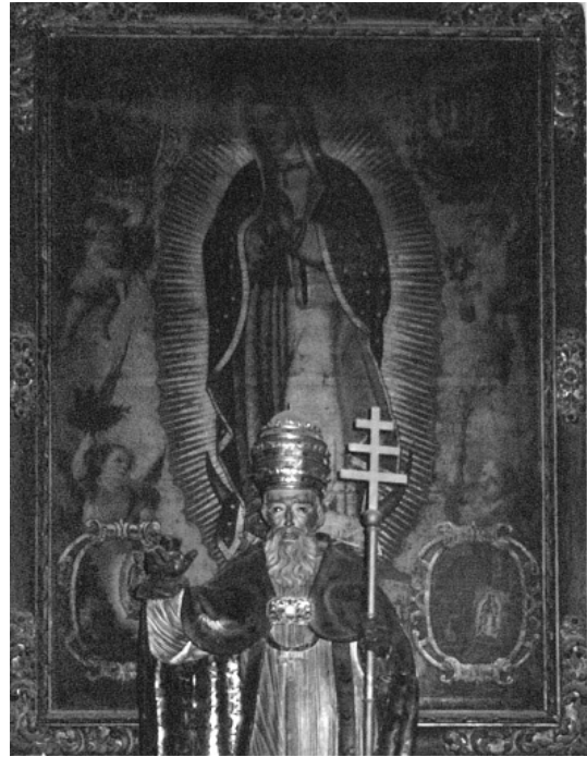
2. Virgen de Guadalupe . Iglesia del Convento de San Jerónimo de Granada. Anónimo. Siglo XVIII. Óleo sobre lienzo.

La mayoría de las pinturas guadalupanas conservadas en España son anónimas. El hecho de que estén firmadas es por tanto excepcional, aumenta su interés y permite datarlas