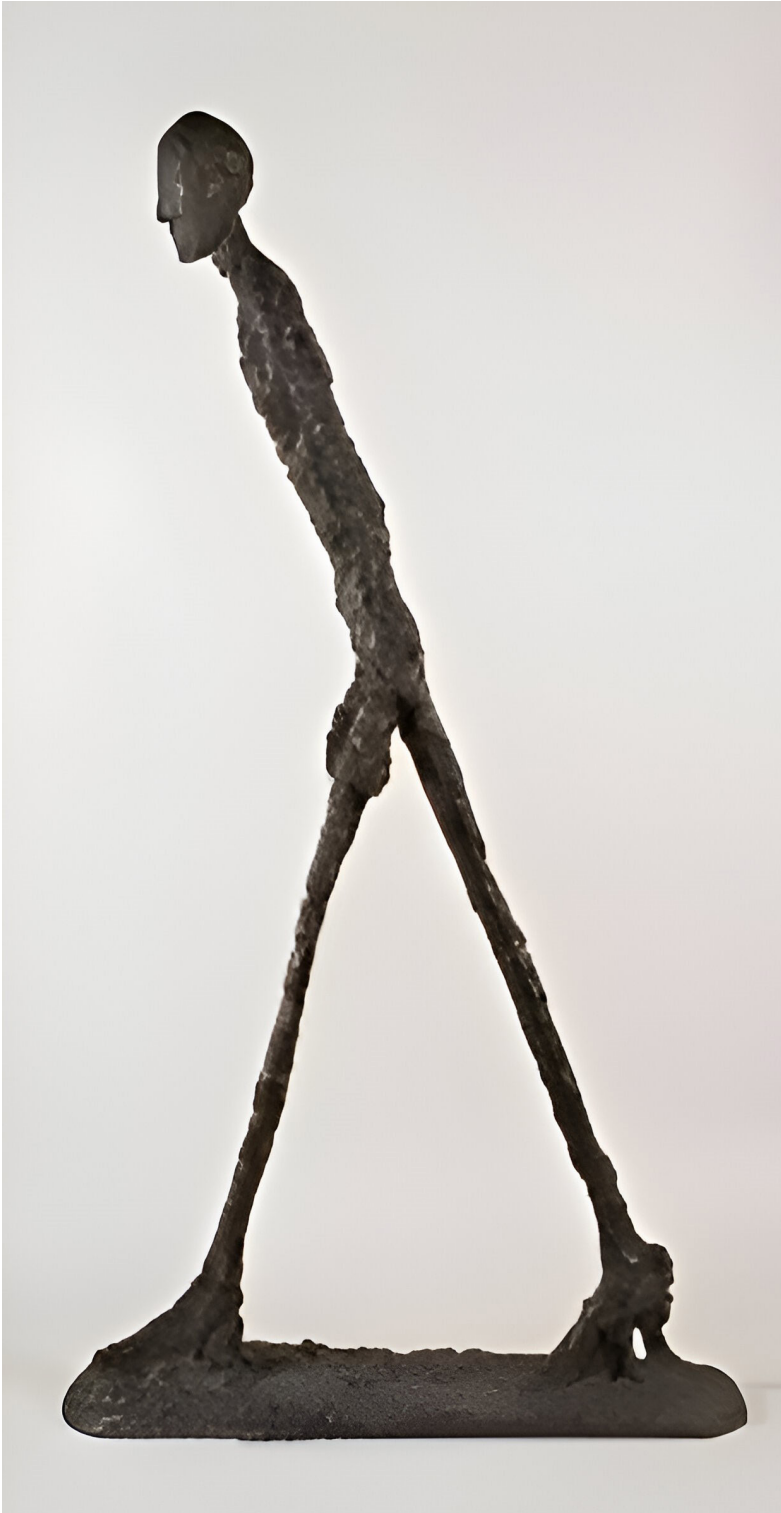
Fig. 8. Alberto Giacometti. Hombre caminando I. 1960 © Fondation Giacometti, Paris / Succession.