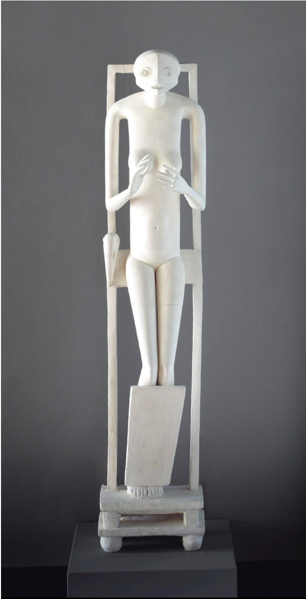
Fig. 6. Alberto Giacometti, El objeto invisible. 1934. Yeso, 156,2 x 34,3 x 29,2 cm. Galería de arte de la Universidad de Yale. Regalo anónimo.

su rostro aún se hallaba en un estado de “indeterminación sentimental”. Sólo el encuentro de una máscara en el mercado de las pulgas, que en las “investigaciones personales” de Giacometti, funcionando “rigurosamente” como un sueño, liberó al artista de sus “escrúpulos paralizantes”, le permitió finalizar la estatua logrando “la unidad de lo natural y lo sobrenatural que permitiría al artista pasar a otra cosa” (Fig. 6). Objeto invisible pero presente... emanación del deseo de amar y ser amado. Como escribió Ángel González, “¿qué otra cosa podría haber entre esas manos sino la imposible realización de lo que deseamos: el vacío inherente a cualquier deseo?” (González, 2006: 67-68).