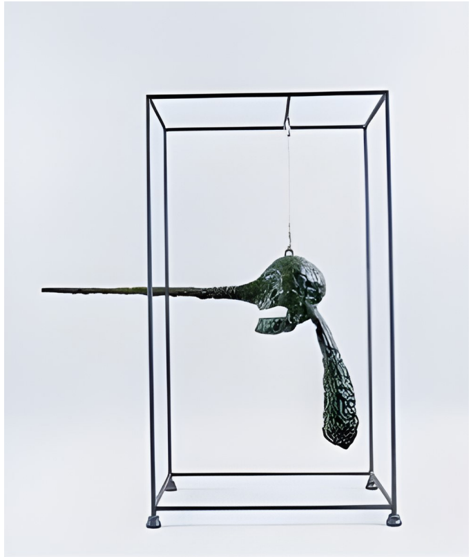
Fig. 7. Alberto Giacometti. La nariz. 1949.

Un hombre que camina constituye quizá la mejor cifra de esa unidad indivisible capaz de generar de movimiento y espacio (Fig. 8). Orientando la mirada merced a la verticalidad y a la fijación de los pies, su figura reclama la intervención del espectador, el cual termina por fijar ese vacío imposible de colmar, más allá del cual la figura se desvanece y somos devueltos a la ceguera táctil. Quizá es esta soledad de estar rodeado de vacío aquella a la que se refería Genet. Esa soledad que surge, no obstante, a partir del movimiento de los vivos. A partir del movimiento que nos mantiene vivos. Es aún 1934, y Documents publica un diálogo entre André Breton y Giacometti: