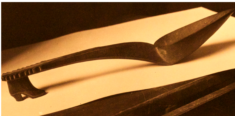
Fig. 5. Zapato-cuchara (“De la hauteur d’un petit soulier faisant corps avec elle”) que resolvió para Breton el juego de palabras “le cendrier cendrillon”. De André Breton, L'amour fou . Paris: Gallimard, 1937.

Esta fusión de la figura del deseo y la figura de la extinción fue exactamente lo que ocurrió en uno de los trouvailles que Breton describió en L'amour fou (1934). Fue el zapato-cuchara que resolvió el enigma del juego de palabras “le cendrier cendrillon” (“el cenicero de Cenicienta”), que para Breton estaba asociado a la imposibilidad de fijar el significado y satisfacer el deseo (Fig. 5). El zapato-cuchara (una forma degradada de los genitales femeninos) que es también un cenicero (donde se tira lo quemado, lo muerto), y cuyo talón en mise en abyme se repite potencialmente hasta el infinito (como una cadena de signos o de sustituciones del objeto perdido), muestra el significado de la estructura del deseo mismo. Más que un fetiche, con su potencial de repetición infinita, este objeto constituye para Breton “le ressort même de la stéréotypie”. Una escisión original impulsa al deseo hacia la sustitución infinita de este objeto perdido. Combinación de “una figura de deseo (Cenicienta) con una imagen de extinción (cenizas)” (Foster, 1993: 45).