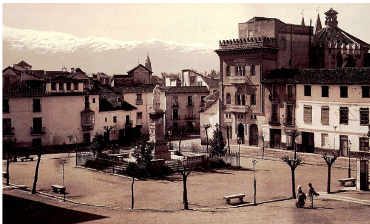
1. Plaza de Mariana Pineda (1885-1890).