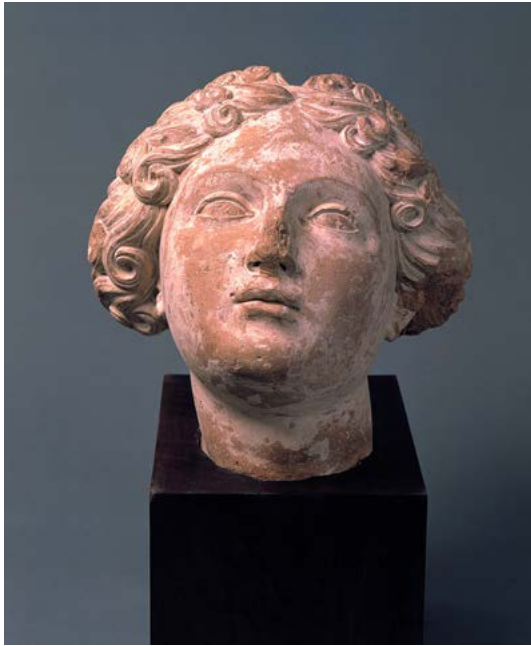
2. Manuel González. Cabeza de Mariana Pineda (1839). Granada, Museo Casa de los Tiros. Depósito del Museo de Bellas Artes de Granada.