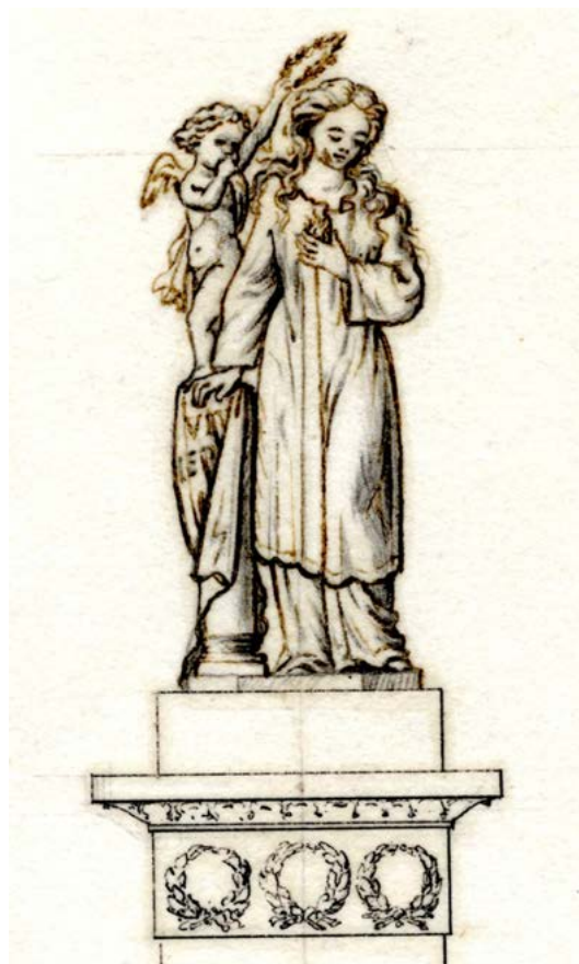
3 y 4. Miguel Marín. Proyectos de escultura de Mariana Pineda (1865). Archivo Histórico Municipal de Granada.

nuel González que incorporaba la elogiada figura del genio, y «completaba el pensamiento de representar á la Sra. [Mariana Pineda] como una martir y como heroína» (fig. 4). A instancias de la Academia, partidaria de la gravedad derivada de la figura única, el comité escogió el primer diseño que debía labrarse en mármol, con una altura de ocho pies, y cuyo coste ascendería a 80.000 reales. Firmado el nuevo contrato el 19 de septiembre, se establecían las exequias de 1866 como plazo de culminación. La estatua finalmente labrada no quedó muy alejada del diseño aprobado, cuya figura aparecía ataviada con el sayón sobre la túnica y la cruz al cuello, tal y como había sido hallada en su cadáver. La cabeza baja, con el pelo trenzado que en la escultura aparecerá suelto, intensificaba el gesto de humildad y sacrificio con que llevaba la mano izquierda a un corazón inflamado. La bandera enarbolada de los primeros proyectos quedó reducida a una enseña sobre la columna rota —símbolo de fortaleza y muerte prematura—, en la que apoyaba la diestra la heroína (fig. 5).