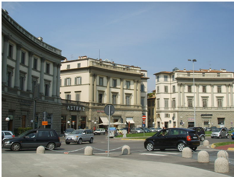
3. Barrio del siglo XIX. Piazza Beccaria .