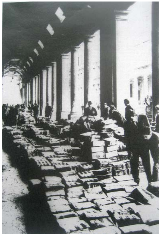
7. Los documentos dañados por la inundación de 1966 en los soportales de los Uffizi .

La Sala de Congresos tiene una capacidad de aproximadamente 150 personas y está completamente equipada con atrio-guardarropa, secretaría, instalación de traducción simultánea (vía radio). Arquitectónicamente se caracteriza por su forma de hemiciclo dividida en tres sectores con techo de casetones en el cual se ha instalado también un sistema de iluminación puntiforme. La actividad congresual, cultural y divulgativa es su principal objetivo.