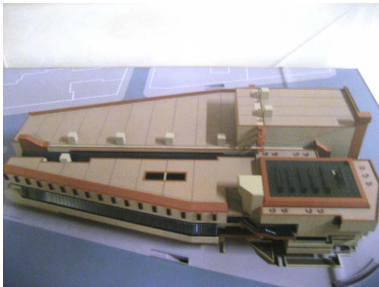
6. Maqueta del Archivo de Estado de Florencia. En primer término, los cuerpos C y D. (Zona norte).

• Cuerpos C y D. Ambientes de trabajo (zona norte): Los espacios reservados a las actividades de estudio y de trabajo se distribuyen en estos dos cuerpos, correspondientes a la Avenida Giovine Italia . Podemos distinguir dos áreas diferenciadas en este sector: por un lado el área de actividades públicas y por otro lado la de actividades “privadas”. Estas últimas tienen cabida en los siguientes centros: