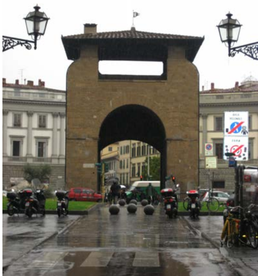
4. Porta alla Croce (Piazza Beccaria) .

Uno de los objetivos primordiales era hacer del Archivo de Estado un centro de propulsión de la vida cultural en sintonía con las disciplinas más relacionadas que una ciudad —en particular en su casco histórico— debe asumir para su recuperación en clave moderna. Responder a estos objetivos significaba concordar también con las disposiciones generales establecidas para la zona en la que se ubicaría la nueva sede: el barrio de Santa Croce 15 . El análisis de la situación del nuevo edificio del Archivo de Estado resulta interesante