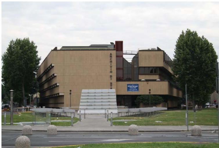
8. El Archivio di Stato de Florencia.

La Escuela de Archivística, Paleografía y Diplomática está dotada de un acceso independiente para el público y en relación directa con la sección de oficinas utilizadas por la Dirección del Archivo de Estado. Tiene dos aulas de notables dimensiones, que pueden ser usadas como sala de conferencias y seminarios, con una capacidad para 24-48 personas, respectivamente. Además, cuenta con una sala para profesores y una biblioteca específica.