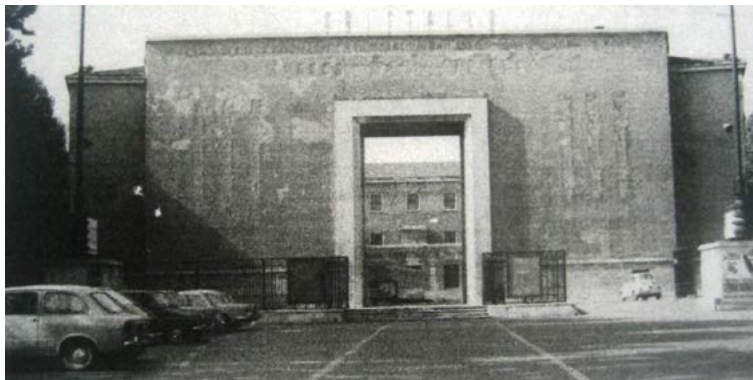
2. Casa de la G.I.L.

La disposición planimétrica y volumétrica del complejo ideado por Cetica proponía que el edificio tomase forma de herradura de caballo abierta sobre Piazza Beccaria y enlazase —sobre el lado opuesto a la plaza (actual via Duca degli Abruzzi )— con las