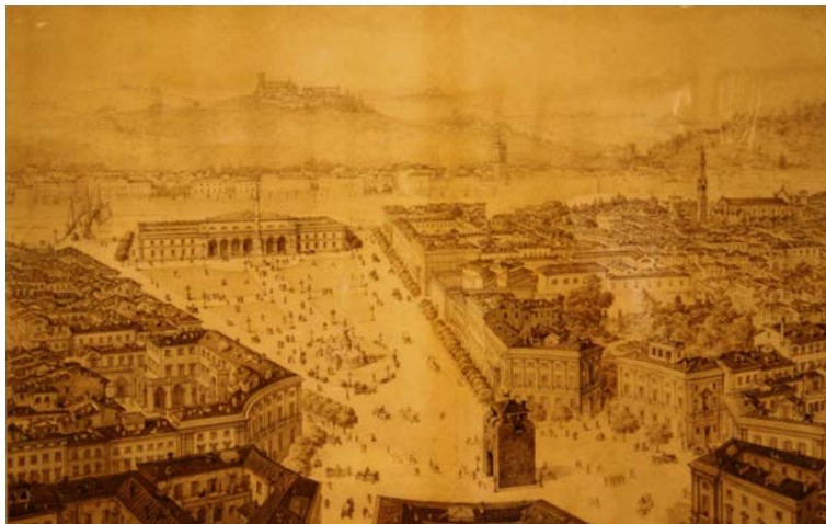
1. Vista de la Piazza Beccaria antes de la intervención de Giuseppe Poggi, grabado de Giuseppe Zocchi (1744).