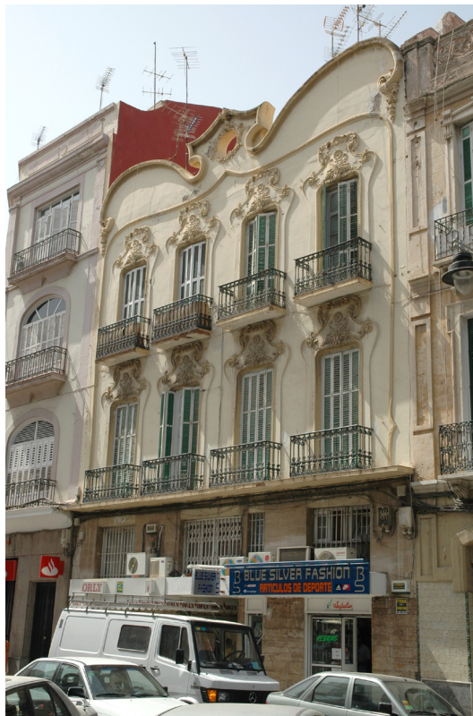
5. Solares del Barrio Reina Victoria nº. 177.