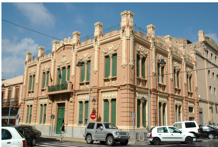
7. Solares del Barrio Reina Victoria nº. 188-189-190.