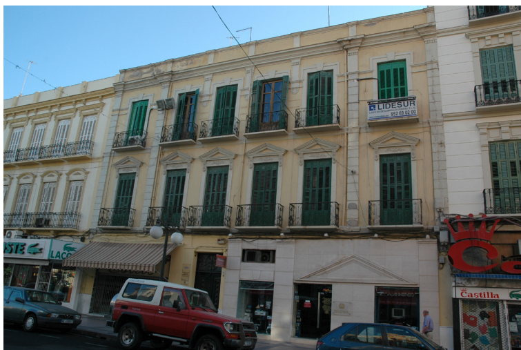
3. Solares del Barrio Reina Victoria n.º. 174-175-176.