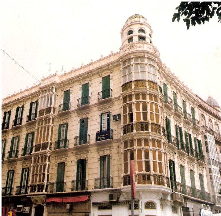
4. Solares del Barrio Reina Victoria nº. 176-177.