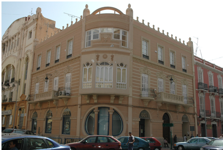
6. Solares del Barrio Reina Victoria nº. 192-185-186.