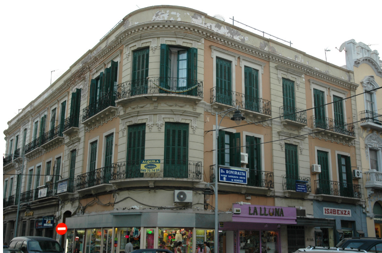
2. Solares del Barrio Reina Victoria n.º. 172-181-182.