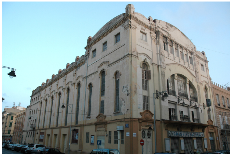
8. Solares del Barrio Reina Victoria n.º. 191-192-193.