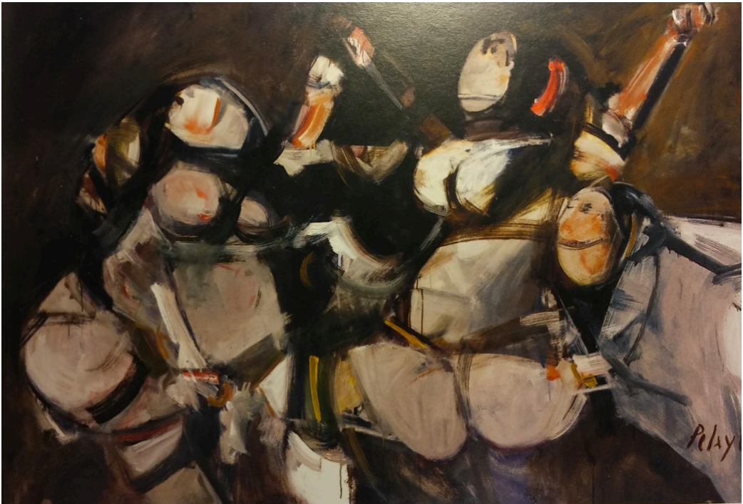
Fig. 5. Orlando Pelayo, Las del Sábanu/Horresco referens (1970). Óleo sobre lienzo. 130 x 195, 5 cm. [Fuente: Colección del Museo de Bellas Artes de Asturias (Oviedo)].

Vaamonde se le suman ejemplos como Las del Sábanu (ca. 1945) de Mariano Moré, donde se representa el mismo tipo de escena. Igualmente, conservamos otras imágenes que trascienden los momentos del baño, recogiendo el descanso sobre la arena o los paseos en los alrededores de la playa de estas mujeres ( Gente de Castilla (1927) de Nicanor Piñole, Castellanos en la playa (s.f.) de Mariano Moré y Familia del interior de excursión (1979) de Magín Berenguer). En otras ocasiones, estos personajes aparecen representados mediante un lenguaje figurativo poco convencional, como en Las del Sábanu / Horresco referens (1970) de Orlando Pelayo, una interpretación más dispar en la que la figura humana queda sometida a un proceso de síntesis que difumina las referencias antropomorfas y paisajísticas (Fig. 5). Otras veces, como en Bañistas en la playa (s.f.) de Evaristo Valle, estas mujeres aparecen en composiciones de mayor calado, acompañadas de otros arquetipos humanos, como el paseante, con traje, paraguas y bombín, y las mujeres burguesas que, únicamente mediante el esbozo de la línea, reconocemos en las faldas abombadas, los aparatosos tocados o los parasoles.