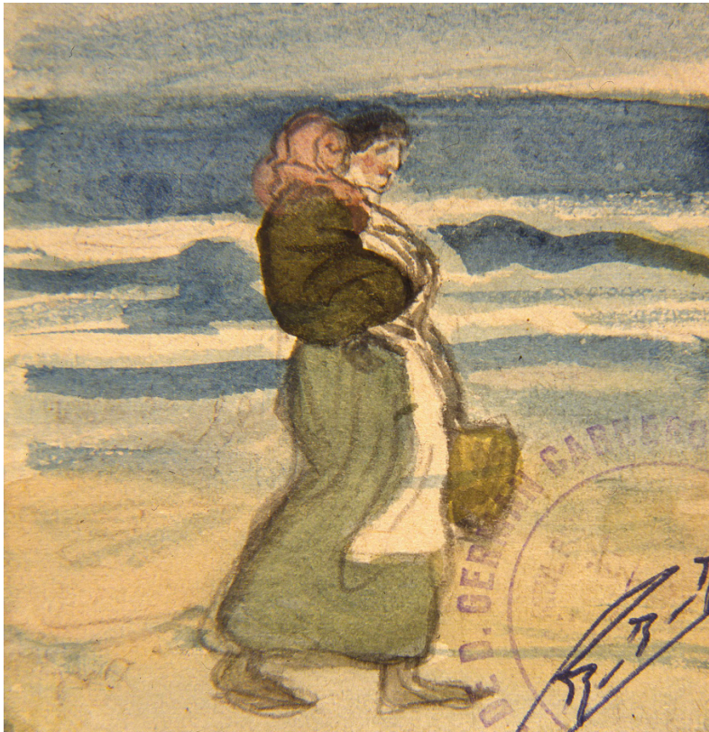
Fig. 8. Nicanor Piñole, Maternidad en la playa (ca. 1915). Dibujo a acuarela y lápiz sobre papel. 12x10 cm. Colección particular. En depósito en el Museo Nicanor Piñole (Gijón).