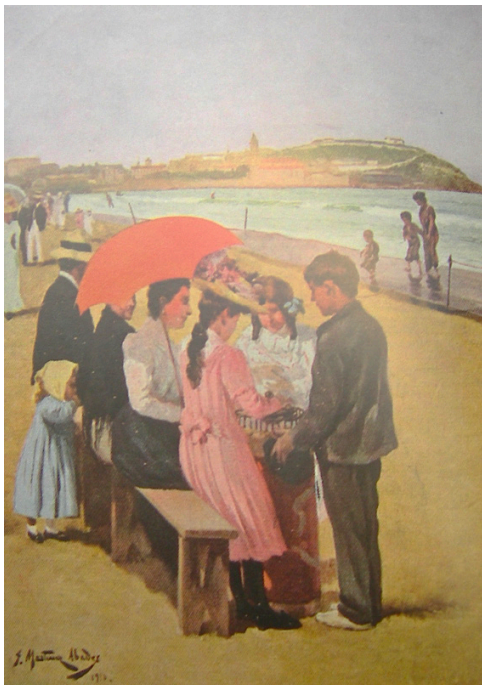
Fig. 7. Juan Martínez Abades, Alimento después del baño (1910). Óleo sobre lienzo. Pintura reproducida en la revista ilustrada Blanco y Negro (Madrid).

Finalmente, contamos con obras protagonizadas exclusivamente por niños. En este sentido, las distintas versiones de La resaca de Nicanor Piñole, fechadas entre 1927 y 1930, hacen gala de las experiencias a la orilla del mar, en este caso, escudriñando un animal muerto. Sabemos que la población infantil de las localidades costeras jugaba con asiduidad en torno a la playa, recorriendo los arenales en busca de cualquier objeto con el que interactuar, ya fuesen piedras, palos, conchas o, en general, cualquier cosa que el mar hubiera arrastrado hasta allí (Vigón, 1980). Precisamente, esta actividad es la que queda representada en estas obras, siendo conocida bajo la expresión ir a la rucha . También contamos con dos versiones de Niños en la playa (ca. 1970 y 1996) de Magín Berenguer, ambas centradas en la representación del juego infantil. Igualmente, este tipo de escenas aparecen ambientadas en las zonas de paseo y recreo cercanas a los arenales, como en Niños en el Muro (1964) de Marola o La Ola (ha. 1930) de Nicanor Piñole.