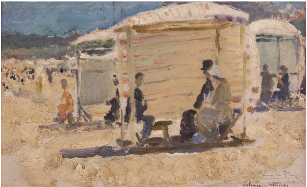
Fig. 1. Cecilio Plá, Playa de Salinas, Asturias (s.f.). Óleo sobre cartón. 14,5 x 23 cm.