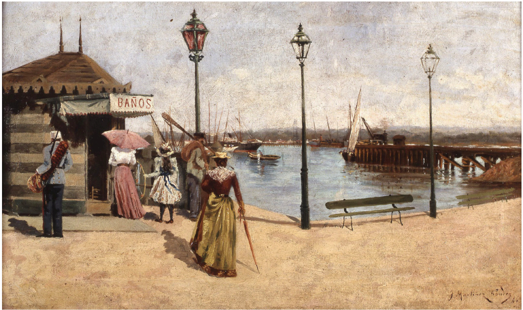
Fig. 2. Juan Martínez Abades, Muelle de Fomento (1886). Óleo sobre lienzo. 33 x 55,5 cm. [Fuente: Colección particular. En depósito en el Museo Casa Natal de Jovellanos (Gijón)].

Insistiendo en otras lecturas a las que la imagen se puede someter, al cruzar la representación artística con la mentalidad de la época y la importancia concedida a los atuendos salen a flote algunas cuestiones interesantes. Desde el siglo XIX la moda empieza a entenderse como algo prácticamente femenino, con un sentido peyorativo y de desprestigio, desvirtuándose y tiñéndose de frivolidad gracias al papel de los medios de comunicación y, especialmente, de aquellas publicaciones dirigidas al consumo de la mujer 8 . Un análisis de las noticias en prensa nos ofrece la siguiente información: por un lado, se percibe una proyección superficial de la moda y su asociación con el imaginario de la mujer; por otro, se encuentran diversas referencias, algunas acompañadas de aparato gráfico, que insisten en los atuendos socialmente deseados y permitidos. Al calor de esto último encontramos diversos equipamientos, algunos para ir a la playa y otros para bañarse , coincidiendo con la información visual que Martínez Abades nos brinda en su obra (Fig. 3) 9 .