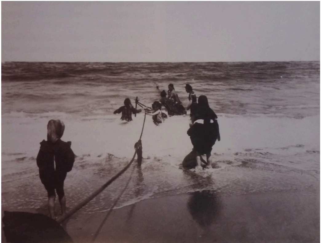
Fig. 4 Arturo Truan Vaamonde, Figuras en la playa de San Lorenzo (ha. 1892). Fotografía a la albúmina. 8 x 10,6 cm.

milia, otras como integrantes de un grupo de iguales, venían a tomar los baños de ola y disfrutar de sus beneficios terapéuticos. Así, sus baños quedaron registrados en la práctica artística mediante un esquema, por otro lado, basado en la realidad, que permite una fácil identificación. Vestidas en exceso, cubiertas con lo que se ha llamado sábanu (sábana o saco de lino) y con pañuelo sobre la cabeza, suelen entrar al agua asidas a las maromas o cuerdas dispuestas entre las estacas, acotando la zona de baño, como ayuda ante los fuertes embates de las olas 14 (Fig. 4).