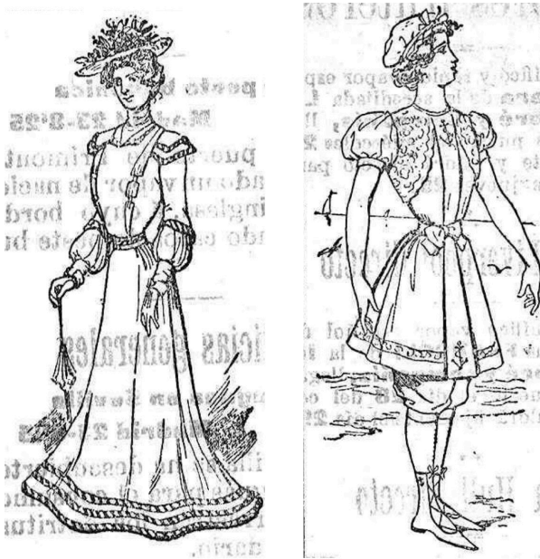
Fig. 3. Traje para ir a la playa y traje para el baño (s.f.). Dibujos reproducidos en El Regional. Diario independiente de la tarde (1899-1905).