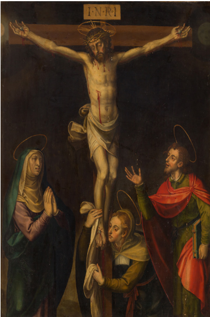
Fig. 8. Miguel Joan Porta, Cristo crucificado con la Virgen, San Juan y María Magdalena, en comercio .

Los modelos figurativos los podemos encontrar en las tablas que hemos ido mencionando anteriormente: las de la colección Peris Mencheta, la Circuncisión de colección particular, la tabla central del retablo del Monasterio de Gilet, e incluso en la Pentecostés del retablo de la parroquial de Onteniente (Fig.7). El rostro barbado de san José, con el mechón de cabello que sobresale de la sien izquierda de su cabeza, y la posición de su mano derecha, son perfectamente relacionables con el citado apóstol del Retablo de las Álmás de Torrente [5] e incluso con el apóstol situado en el extremo izquierdo de la escena de la Pentecostés del retablo de Onteniente o con el apóstol de la tabla de Gilet (Fig.1) que se encuentra junto al taburete de la parte izquierda. La gesticulación de la mano derecha de Santa Ana es igual que la que muestra el personaje que recibe las tórtolas en la tabla de la Presentación de Jesús al templo de la colección Mencheta (Fig.5).