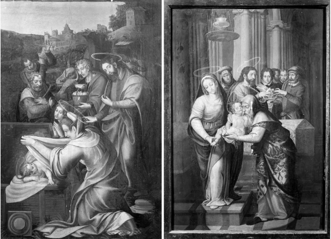
Fig. 5. Miguel Joan Porta, Adoración de los Reyes [izquierda] y Presentación de Jesús al Templo [derecha], colección Peris Mencheta.

formar parte de un mismo conjunto. El autor es el mismo, pues las características estilísticas, creemos, reafirman nuestra propuesta. Conocemos las medidas de la tabla de la Circuncisión , pero no las de las tablas de la colección Mencheta, aunque esperamos que algún día salgan a la luz y se puedan contrastar las dimensiones, lo que ayudaría bastante a refrendar esta hipótesis de la misma procedencia.