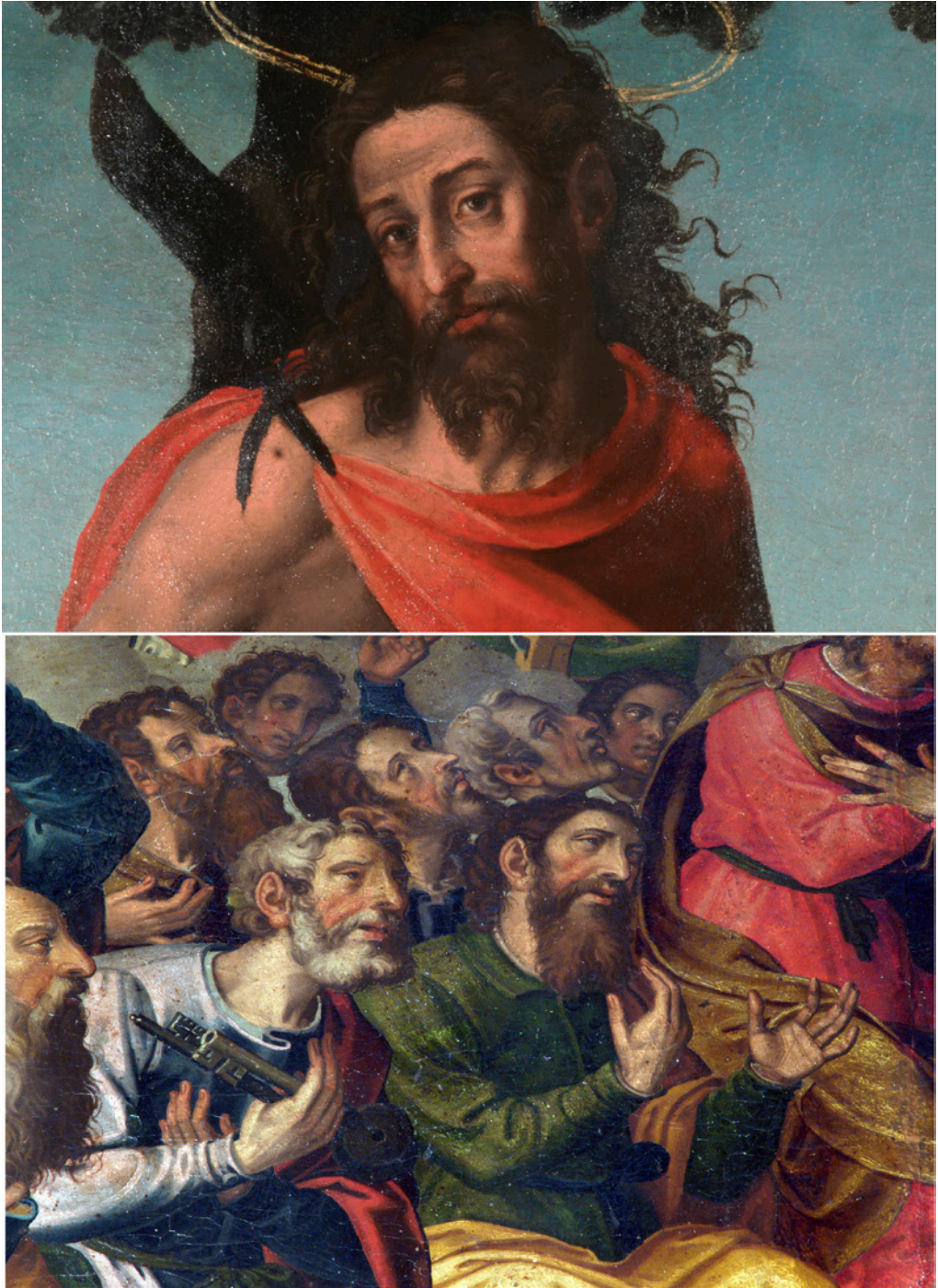
Fig. 4. [Arriba] Miguel Joan Porta, San Juan Bautista , colección particular, Detalle del rostro. Foto del autor. [Abajo] Miguel Joan Porta, Retablo de las Almas de la iglesia parroquial de la Asunción de Torrente (Valencia), detalle de los apóstoles. Foto del autor.