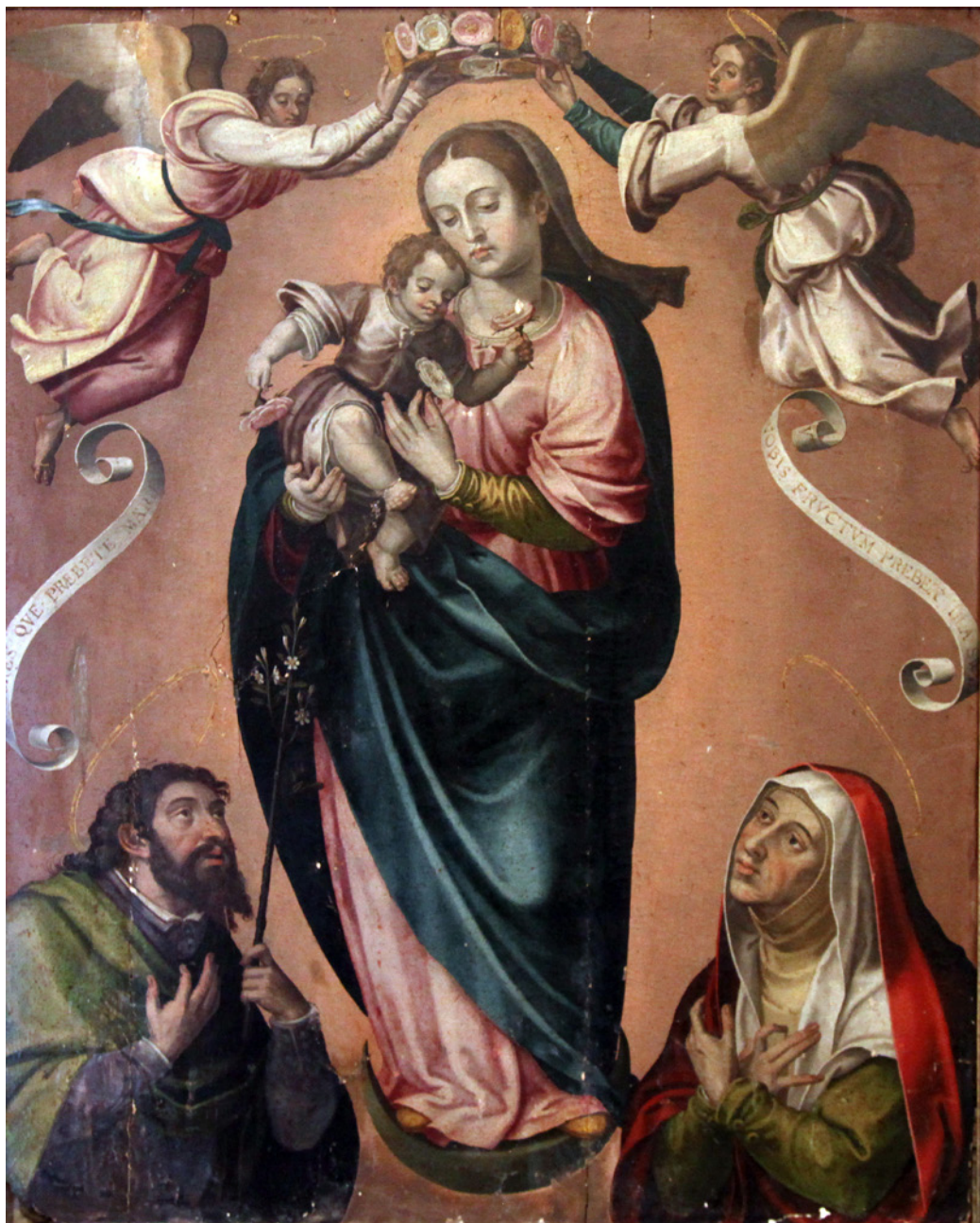
Fig. 6. Miguel Juan Porta, La Virgen con el Niño, San José y Santa Ana , Museo de Valladolid.

(inv. 11140), y actualmente se expone en una sala del mencionado museo, adscrita a la escuela de Juan de Joanes.