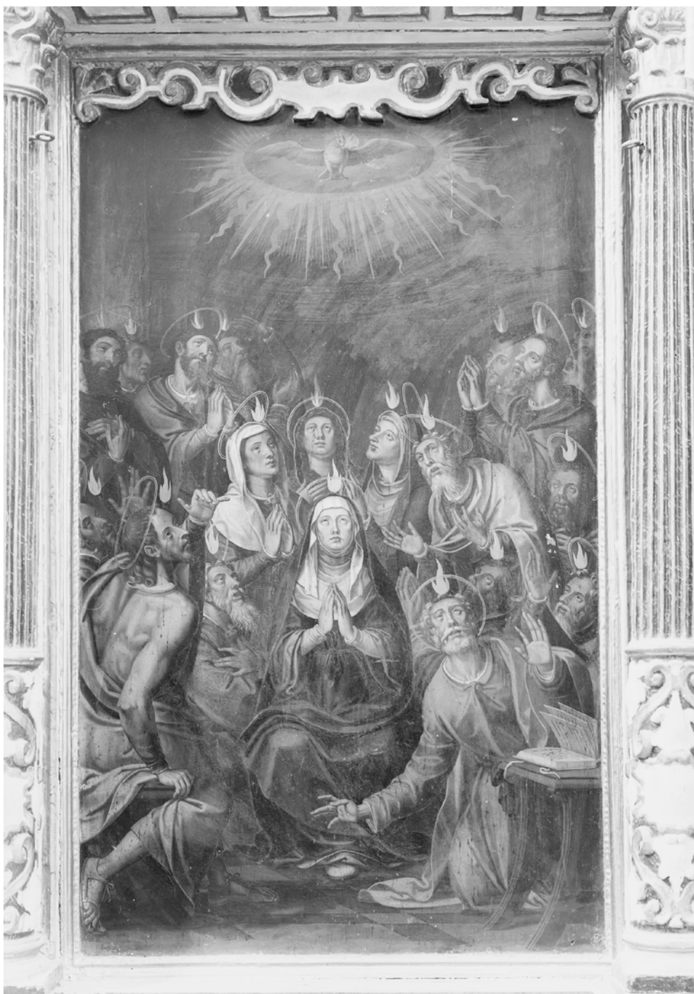
Fig. 7. Miguel Joan Porta, Pentecostés , Retablo mayor de la Parroquia de Santa María de Onteniente, en paramero desconocido. Foto: Arxiu General i Fotogràfic de la Diputació de València (AGFDV). Colección Enrique Cardona Alcaraz, ca. 1925, Núm. 715.