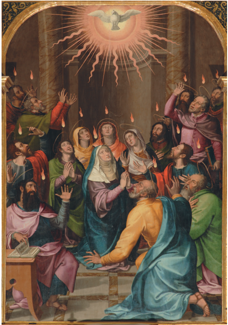
Fig. 2. Miguel Joan Porta, Pentecostés , 1587, Monasterio de Santo Espíritu de Gilet (Valencia).

En cuanto al posible autor de esta tabla, a tenor de las características estilísticas que presenta, creemos que podemos adscribir la obra al pintor Miguel J. Porta. Para poder refrendar o justificar nuestra atribución hemos realizado una serie de comparaciones con otras obras del mismo artista. La primera a la que hemos accedido es la conservada en el Monasterio de Santo Espíritu de Gilet (Valencia). Se trata de una Pentecostés (Fig.2), central de un retablo cuya actual configuración y restantes escenas no parecen ser de la mano de Miguel Joan Porta 23 . Una obra capital del artista, pues en ella se consigna su firma y año de ejecución. La inscripción se observa en la banqueta situada en el extremo inferior izquierdo, sobre la que se sitúa un libro abierto. Según leemos, el texto es: “Porta Me / Pinxit. / Anno 1587 / F.V.T” (Fig.3).