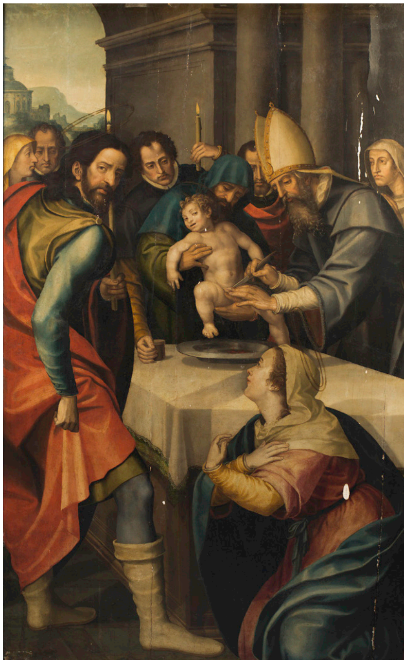
Fig. 1. Miguel Juan Porta, Circuncisión del Niño , colección particular.

posible que alguno de ellos fuera el promotor de la obra o que los tres fueran miembros de la misma familia que la sufragó. Volveremos más adelante sobre este asunto.