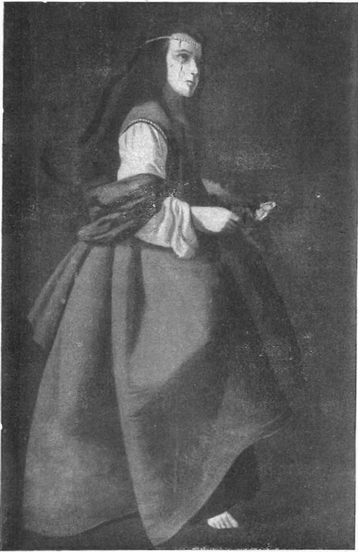
ZURBARÁN.—SANTA CASILDA. PALACIO ARZOBISPAL DE GRANADA.