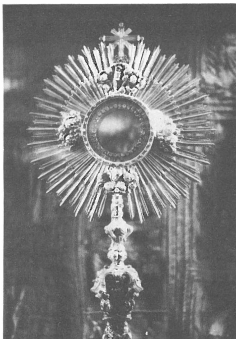
Custodia de 1778. Detalle de la parte superior. Museo de la Capilla Real. Granada.