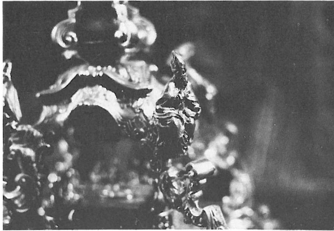
Custodia de 1778. Detalle. Doctor de la Iglesia Latina. Museo de la Capilla Real. Granada.