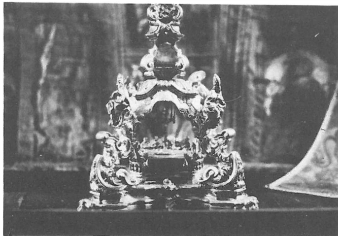
Custodia de 1778. Detalle de la Capilla que formaba la base. M. de la Capilla Real. Granada.