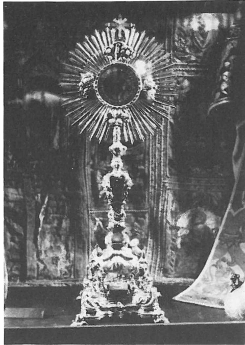
Custodia de 1778. Museo de la Capilla Real. Granada.