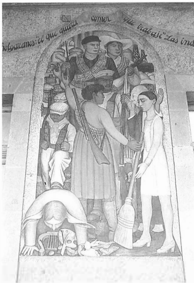
Fig. 1. Diego de Rivera. Corrido de la Revolución . Secretaría de Educación.

Los temas de que se ocupó Posada son múltiples; su contenido es la vida, la vida de la capital en primer término y, en segundo, la del país entero, por medio de la ilustración de los llamados «corridos», canciones, noticias —espeluznantes las más—, oraciones, sucesos y los muy famosos Ejemplos de Vanegas Arroyo, especie de reportaje gráfico con intención satírica-moral, que son por lo general atrocidades mayúsculas, tales como la «Hija que envenena a su madre», o los crímenes de los Bejarano, que de alguna manera tienen un precedente en aquellos grabados de Goya con los que el pintor hizo la descarnada crítica social de la España que le tocó vivir.