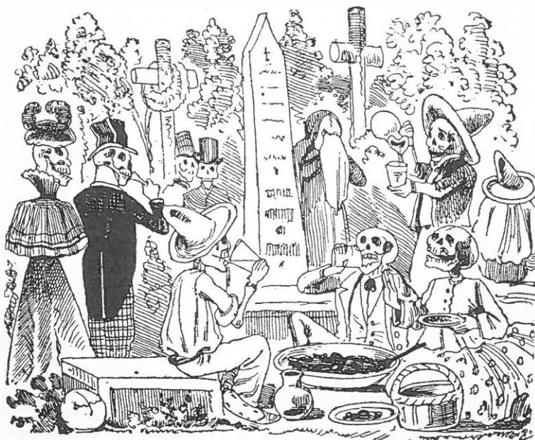
Fig. 4. José Guadalupe Posada. Gran comelikón de calaveras.