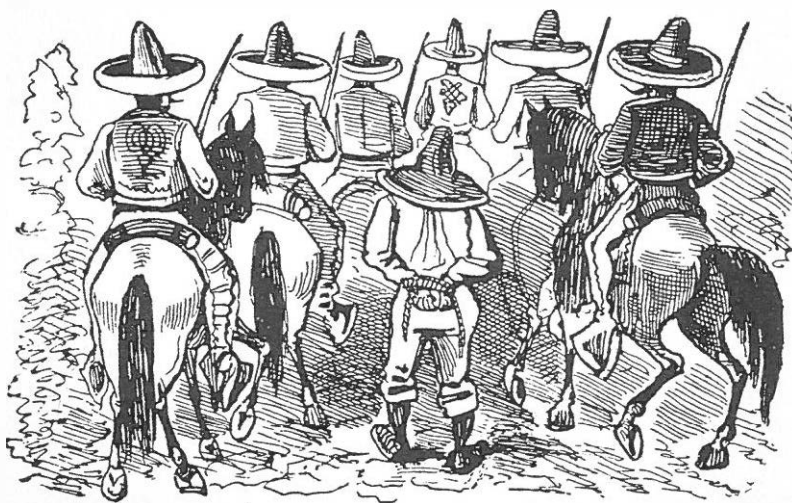
Fig. 5. José Guadalupe Posada. Campesino prisionero de los Rurales.