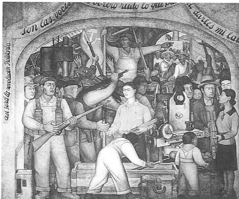
Fig. 3. Diego de Rivera. En el Arsenal .