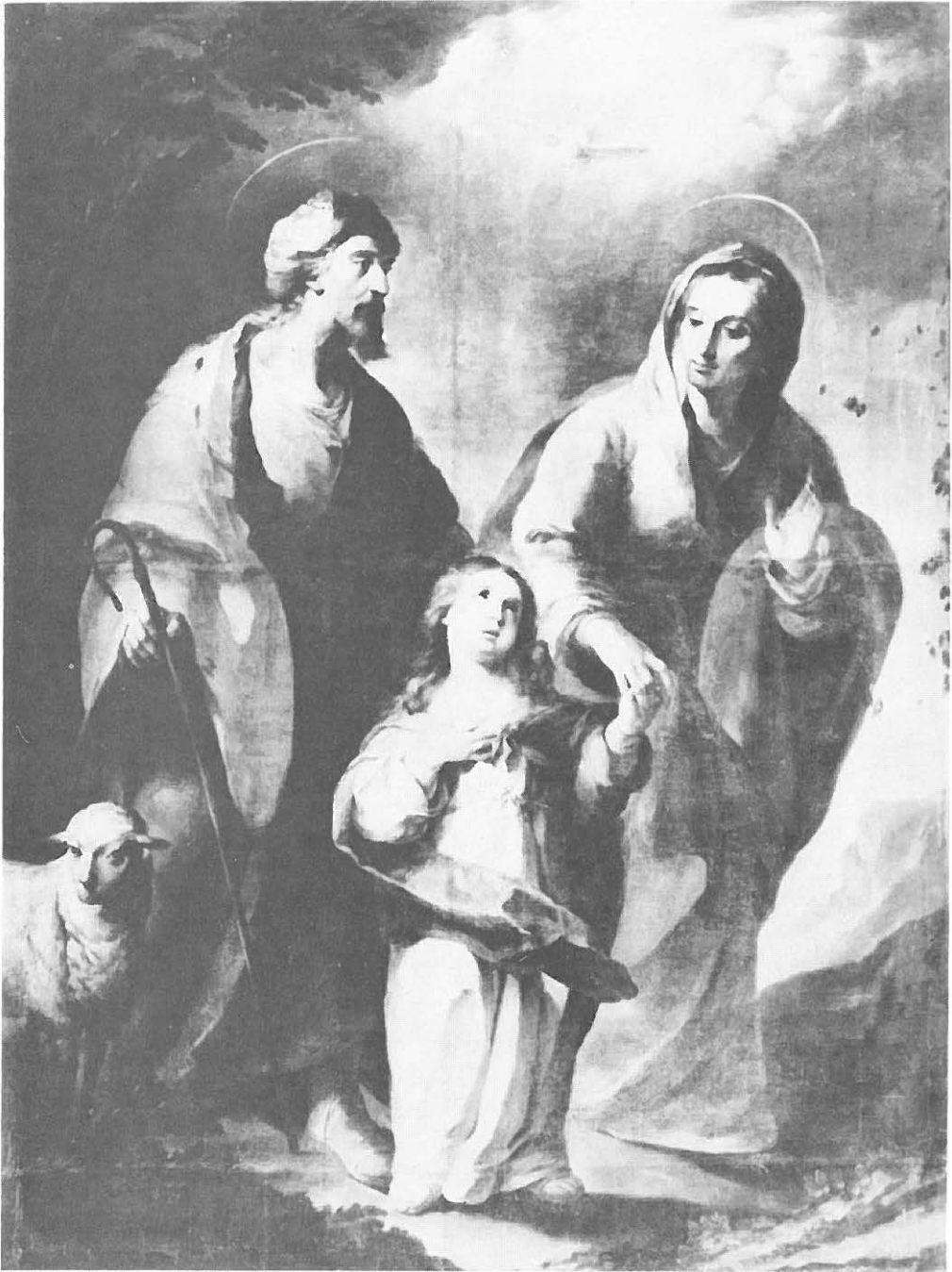
Fig. 2. San Joaquín, Santa Ana y la Virgen. Lienzo de Juan de Espinal.