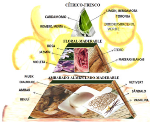
Figura 1. Pirámide olfativa de la fragancia unisex.

En la Tabla 2 se presentan las notas olfativas de ambas fragancias.