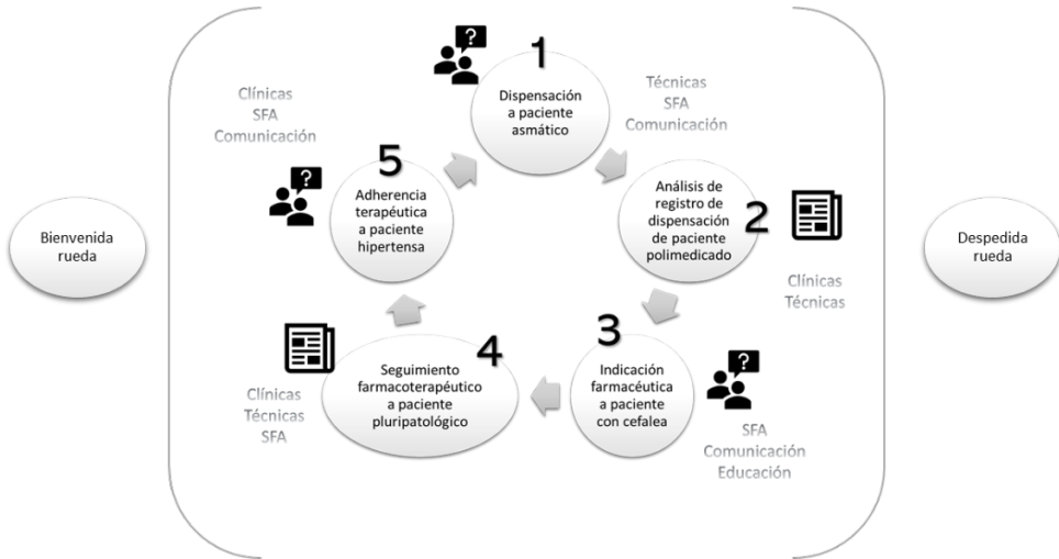
Figura 3. Representación esquemática de la Evaluación Clínica Objetiva Estructurada en Atención Farmacéutica diseñada y montada. SFA: Servicios Farmacéuticos Asistenciales

El piloto se llevó a cabo con 33 estudiantes de Grado y 14 estudiantes de Máster durante dos días consecutivos en junio de 2019. Cada grupo de 5 estudiantes fue recibido por el coordinador en un área de bienvenida en la cual se les recordó las condiciones y los tiempos establecidos. Por cada estación, los estudiantes contaron con 2 minutos para la lectura de la situación de partida y 8 minutos para el desarrollo dentro de la estación. Los avisos de cambio de estación y tiempos se realizaron mediante un sistema de megafonía y timbre. Cada rueda de la ECOE permitió evaluar a 5 estudiantes a la vez, por lo que la duración de la prueba para cada estudiante fue de 50 minutos, manteniendo un descanso de 10 minutos entre las ruedas. Se realizaron diez ruedas, distribuidas en horario de mañana y tarde, con una duración total de 10 horas para evaluar a 47 estudiantes. Al finalizar la prueba, los estudiantes pasaron a un área de despedida donde completaron de manera anónima el cuestionario de opinión.