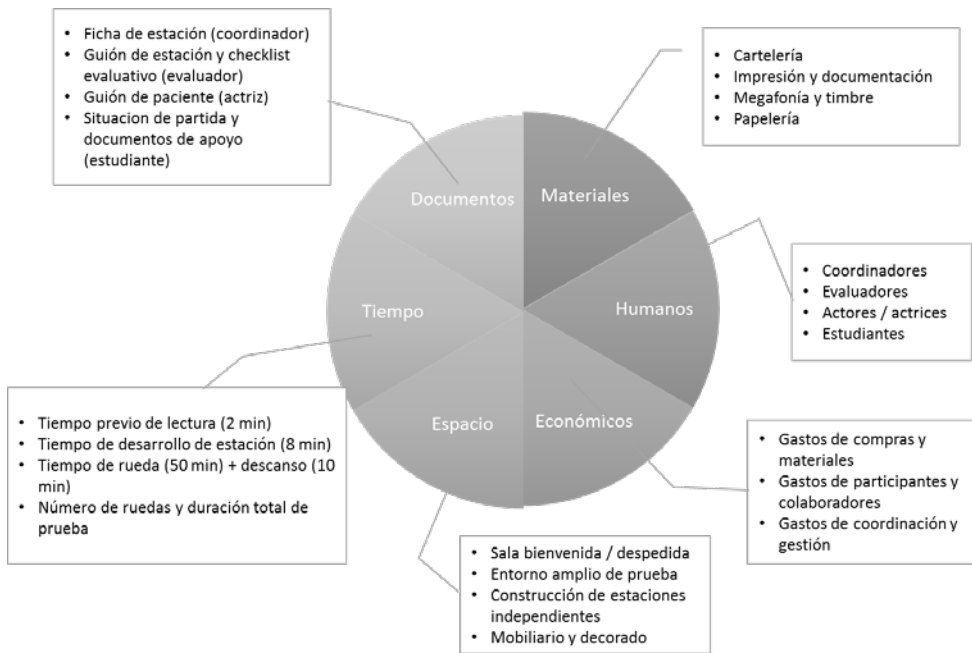
Figura 2. Planificación práctica de la prueba ECOE y recursos necesarios.

Respecto a recursos humanos, se contó con la participación de 3 actrices entrenadas, 5 evaluadores y 3 coordinadores generales. Las actrices interpretaron el papel de paciente en las estaciones dinámicas, a partir de los guiones previamente elaborados. Los evaluadores fueron instruidos en su papel como observadores, no pudiendo interactuar con el estudiante. Ambos, actrices y evaluadores, fueron entrenados por los responsables de cada estación en dos sesiones presenciales.