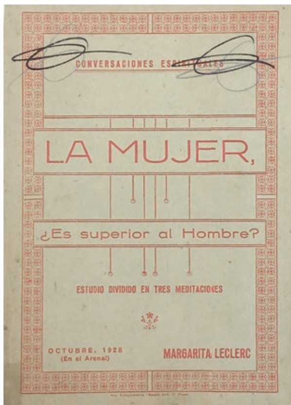
Fig. 2. Portada de La mujer, ¿es superior al hombre?

acababa de cumplir los 16 años, pero durante la República se convertiría en la más popular dirigente comunista de la isla. Sindicalista, articulista en la prensa obrera, compañera del polémico agente de la Komintern Heriberto Quiñones González y pionera en la conmemoración del Día de la Mujer Trabajadora, era además una elocuente oradora que llegó a ser conocida por la “Pasionaria mallorquina”. Detenida al comienzo de la Guerra Civil, sería asesinada por miembros de Falange en enero de 1937, convirtiéndose en el símbolo por excelencia del feminismo y la izquierda en Mallorca 31 . En cambio, de Cáceres y de Vilalta, no ha sido posible hallar información, aunque parece que esta última podría ser una sobrina de la escritora. En todo caso, las prologuistas se definían como “un grupo de entusiastas admiradoras de la eminente escritora Margarita Leclerc” que habían optado por