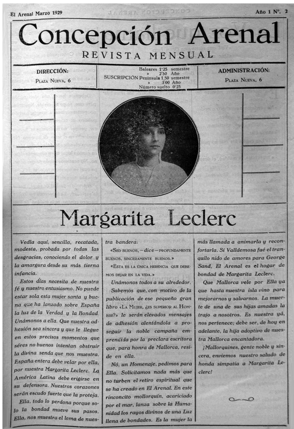
Fig. 3. Portada de Concepción Arenal , núm. 2.