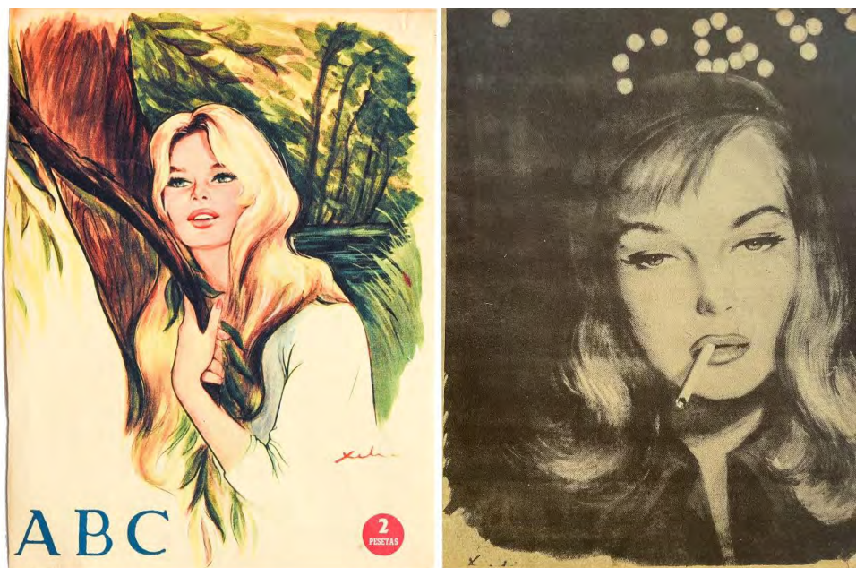
Figs. 18 y 19. Ilustraciones en las que se aprecia la influencia del cine en el trabajo de Xelia. Portada ABC , domingo 31 de agosto de 1958 y Chicas (173), 8 de noviembre de 1953. Colecciones Elia Martínez y Andrés Walliser y María Begoña Sánchez Galán.

de la existencia de una escuela artística definida por la “unidad de lenguaje, de procedimientos y de intenciones”, de una corriente “no de escasa importancia, a juzgar por el número y la difusión de sus productos” 40 . Sin duda, los ilustradores de las novelas y revistas de la posguerra compartían un estilo y un gusto similares que, a todas luces, era parte significativa de su éxito.