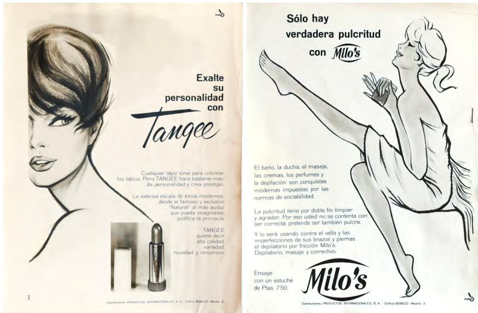
Figs. 12 y 13: Clichés de Tangee (c.1965) y Milo's (c.1963), ambos con el sello de la agencia Dardo.