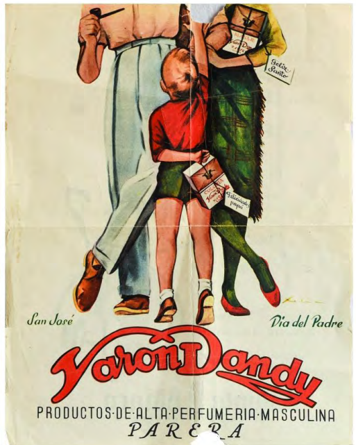
Figs. 10 y 11: Recorte de prensa de un anuncio de Gong (c.1955) y cartel de Varón Dandy (c.1962).