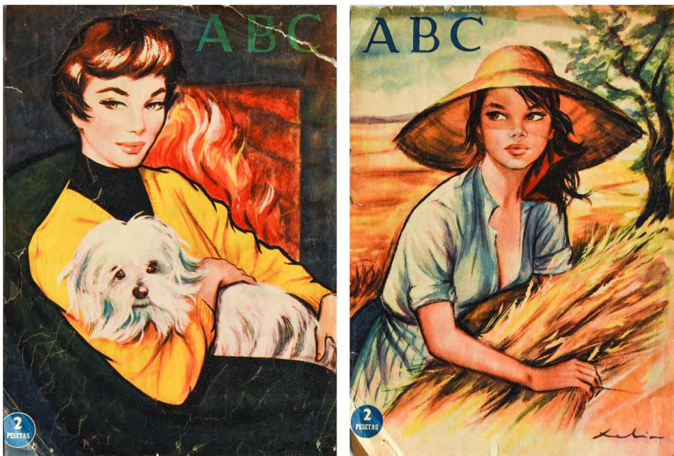
Figs. 5 y 6: Portadas de Xelia para el diario ABC . 2 de diciembre de 1956 y 11 de agosto de 1957. Colección Elia Martínez y Andrés Walliser.

La primera portada de Xelia que hemos conseguido identificar en ABC se publicó el 2 de diciembre de 1956 (Fig. 5), pero la que más aceptación recibió fue la del 11 de agosto de 1957 (Fig. 6). Xelia nos contaba que el periódico se vendió rápidamente y la edición se agotó. No es de extrañar, toda vez que la ilustración muestra a una joven, con los rasgos y la belleza características de Xelia, que viste un pronunciado escote muy poco habitual en las imágenes autorizadas en aquella época. Al observar la portada es inevitable preguntarse cómo pudo pasar la censura una imagen tan insinuante.