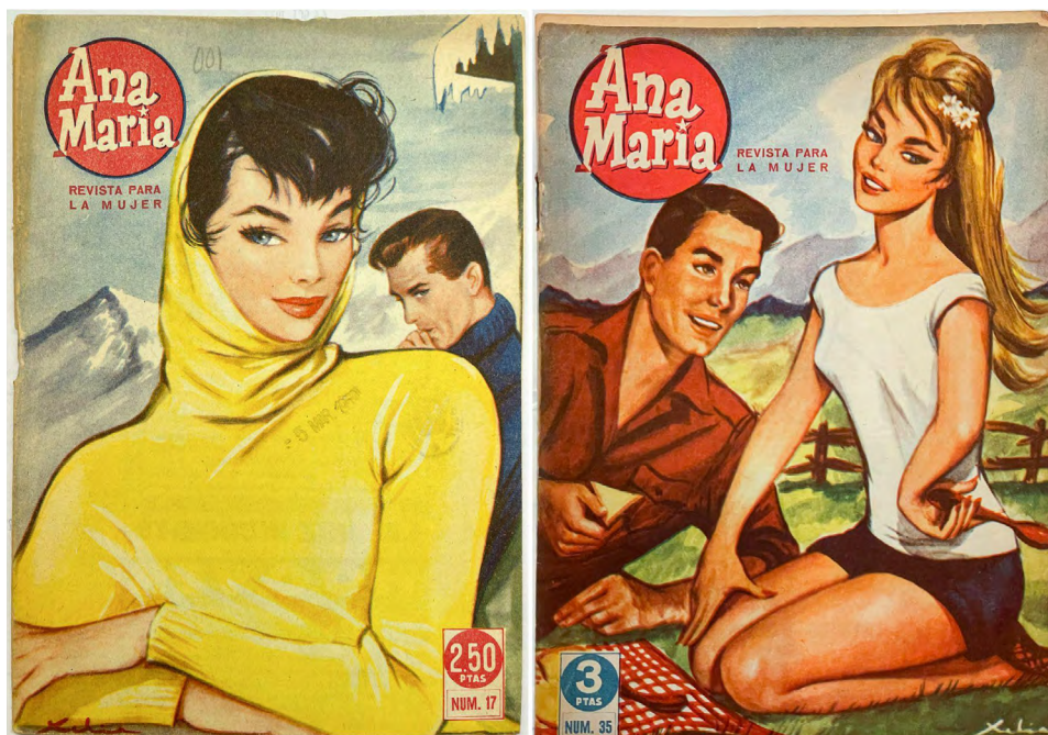
Figs. 16 y 17. Revista Ana María . Portadas de enero y mayo de 1959. Biblioteca Nacional de España y Colección María Begoña Sánchez Galán.

sus dibujos se inspiraban en fotografías de rostros conocidos que les permitían desarrollar con eficacia los múltiples encargos que recibían. No es extraño, por lo tanto, encontrar parecidos de los personajes de estos ilustradores con figuras relevantes del momento.