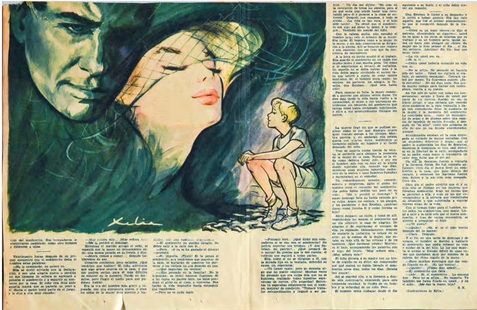
Fig. 7.—Ilustración de Xelia para el relato “El sombrero”, de Samuel Ros. ABC , 12 de octubre de 1958, 8-9.

Además de un par de portadas anuales, Xelia ilustró novelas y relatos para el periódico (Fig. 7). Su colaboración duró, al menos, hasta septiembre de 1963.