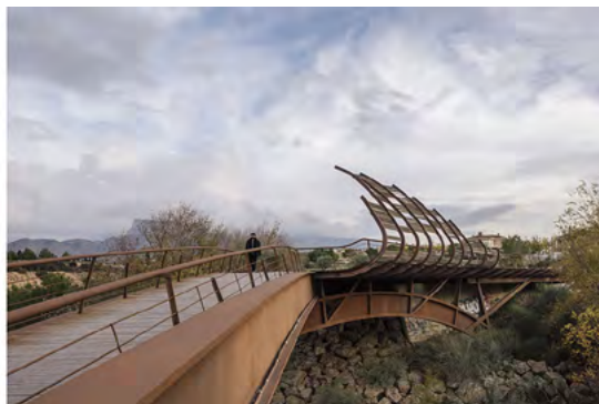
Imagen 2. [Izquierda] Blanca Sánchez Lara. Viviendas autoconstruidas en Lantejuela, 1996-9. Fotografía (estado actual) © María Milagros Sánchez Azcona. [Derecha] Carme Pinós i Desplat. Pasarela Peatonal en Petrer, 1991-9. Fotografía (estado actual) © Rocío Romero Rivas.