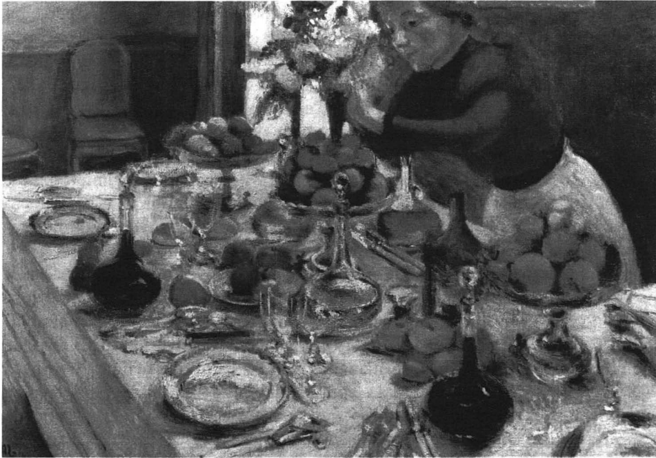
El postre (Matisse, 1897)

Toda esta situación se da, no lo olvidemos, en un contexto muy preocupado por la racionalización del tiempo de trabajo, de reparto del empleo en un contexto de crisis estructural y generalizada del mercado de trabajo donde las cifras de personas desempleadas, la ralentización en la edad de incorporación al mundo laboral, el futuro (presente) de las pensiones, el cuestionamiento sobre los límites del Estado del bienestar son elementos macro y microeconómicos que inciden sobre mujeres y varones, sobre trabajadores/as y empresarios/as 4 . Tampoco podemos olvidar la “otra” situación, la que se genera tras las puertas del domicilio familiar, donde se concentran los mayores escollos y limitaciones a la presencia masiva e igualitaria de las mujeres en el mundo laboral y es ese particular sistema de relaciones que configura el espacio privado y doméstico por el que se les adjudica, casi en exclusiva, la respon-