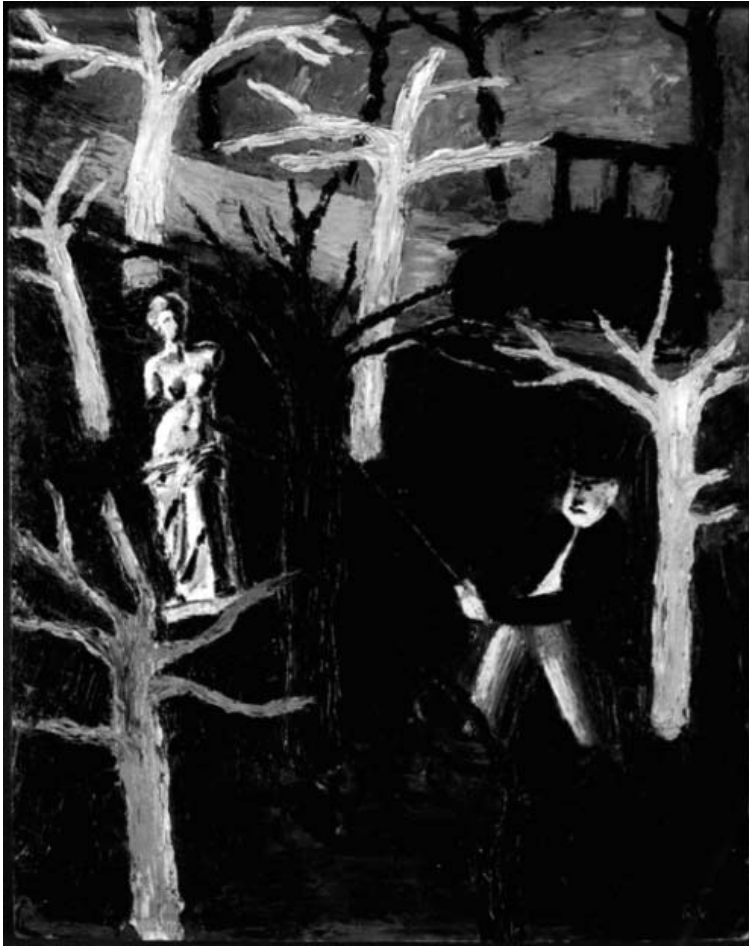
Hombre con chistera colgando a Venus de un árbol , Remedios Varó (1936).

El discurso patrístico condena la actividad sexual incluso aunque se desarrolle en el seno del matrimonio y tenga como fin último la perpetuación del linaje familiar. Pero el legado pecaminoso de Eva convierte la sexualidad de las mujeres en la diana de las críticas eclesiásticas contra el placer sexual. Los exempla y los romances son claros ejemplos de la demonización de la sexualidad femenina y de los efectos castrantes y devoradores de la libido de las mujeres que promulga el discurso patrístico (BETETA, 2010, 75-105). Un posicionamiento condenatorio que, a su vez y ya a finales del siglo XV, es recogido en el Malleus Maleficarum , uno de los mayores instrumentos de deslegitimación de las mujeres que sienta las bases de la ideología tridentina.