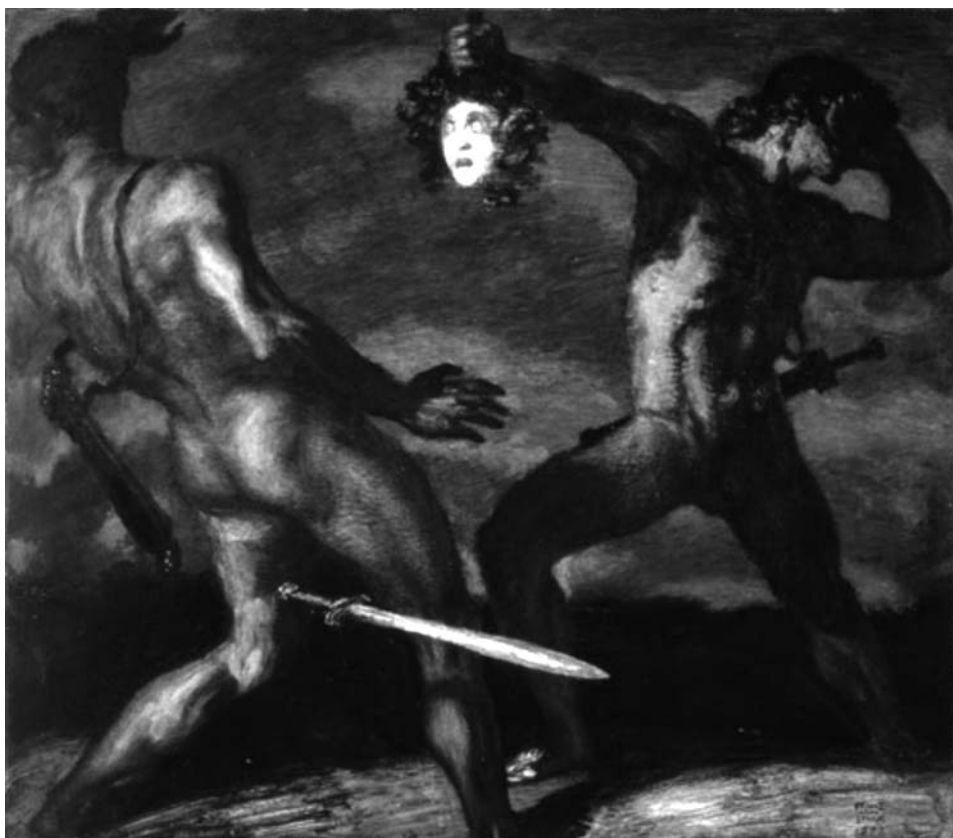
Medusa , Franz von Stuck (1892).

del mal de ojo; un maleficio atribuido a las brujas durante los procesos inquisitoriales de la Baja Edad Media. Ya Alberto el Grande había alertado de la posible acción maléfica de la mirada femenina en Quaestiones super de animalibus (IX, Q9) explicando que los vapores venenosos de las mujeres ascienden al cerebro desde donde impregnan los ojos. El maleficio se realiza a través del aire, siguiendo el proceso de la visión definido por Aristóteles y Galeno, siendo el aire el objeto intermedio necesario entre el ojo y el objeto. No es el ojo el que contamina, sino que el vapor que se expele a través de ellos es lo que impregna todo lo que está a su alcance. Aspectos que prácticamente permanecen inmutables hasta bien entrado el Renacimiento (BARONA, 1995, 15-27).