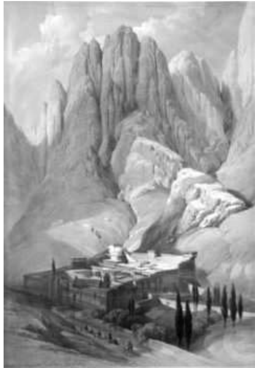
El Monte Sinaí y las huellas de Moisés. Litografía de Louis Haghe, 1839.

Pero el caso de Lot es excepcional, ya que en todos los restantes lugares que conoció, sí pudo comprobar la exactitud de los relatos de la Biblia. Sin