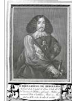
Fig. 8. Retratos de españoles Ilustres , dibujo de R. Ximeno, grabado de J. Ballester, 1791.