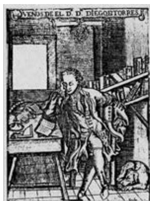
Fig. 21. Torres de Villarroel, 1736.