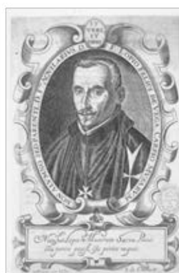
Fig. 10. Grabado por Juan de Courbes, 1630.