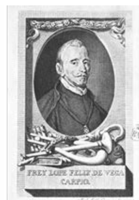
Fig. 11. Grabado por Manuel Salvador Carmona, 1770.