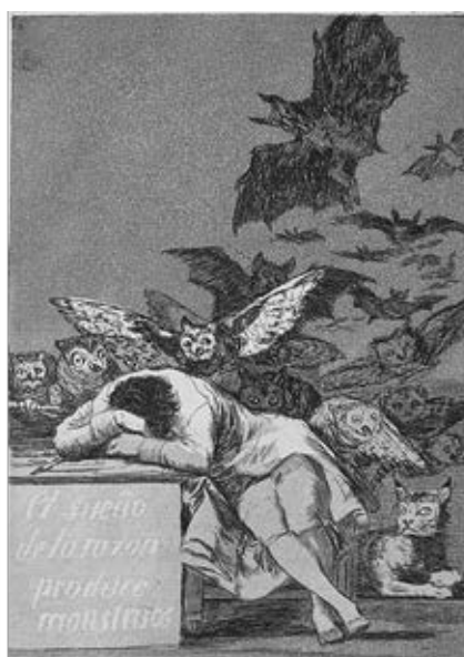
Fig. 19. El sueño de la Razón produce monstruos , Caprichos 43, Francisco de Goya, estampa, 1797-1799.