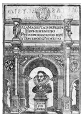
Fig. 9. Jerusalén conquistada, Epopeya trágica , 1609.