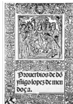
Fig. 2b. Marqués de Santillana, Proverbios , 1512.

El surgimiento del ego personal en la figura del creador resulta equivalente en el plano individual a la amplia conciencia humanista acerca del posicionamiento del hombre en el centro de la tierra 8 ; en tal escenario el paso de artesanos a artistas, pese a su inequívoca dimensión colectiva, rompe con la cerrada noción medieval de gremio y se determina con los nombres y apellidos de los protagonistas de esta empresa. De esta forma, encontramos un autor que intenta desvincularse de las limitaciones gremiales en una búsqueda continua de posicionamiento e individualidad, sin contradicción con que asuma y administre pro domo sua una estrategia compartida, que, como en los panegíricos por la poesía, aprovecha el argumento del número, la visibilidad de un conjunto. Las relaciones teorizadas por Bourdieu entre campo literario como espacio colectivo y habitus como agencia individual se corresponden con bastante exactitud a esta dinámica, en la que se inserta el desplazamiento desde un modelo de representación sometido y genérico, a una paulatina acentuación de los rasgos de individualidad que identificamos plenamente con el retrato moderno (Ponce Cárdenas 7-18).