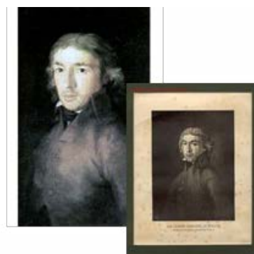
Fig. 16. Retrato de Leandro de Moratín, óleo sobre lienzo, Francisco de Goya, 73 x 56 cm, 1799, Real Academia de Bellas Artes de San Fernando, Madrid. Fig. 17. Retrato de Leandro de Moratín, grabado copia del retrato de Goya.

La apuesta por este uso del retrato en autores marcó un punto de inflexión en la concepción del género. Los poetas comenzaron a mostrar un creciente interés por tener una reproducción de su rostro en sus publicaciones, un retrato que mostrara su persona y, en distintos modos, su condición autorial.