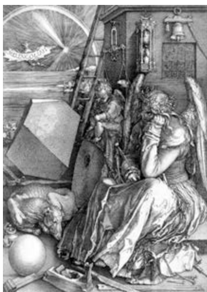
Fig. 18. Melancolía I , Alberto Durero, grabado, 1514.

jando atrás el concepto del retrato casi seriado del autor, se muestra un intento de teatralización del gesto al pasar del busto al cuadro y, con él, a la composición que otorga valor semántico al escenario, al attrezzo y a la propia cinética (o pasividad) del personaje. Ante esta situación, se retoma la incorporación de elementos que componen el entorno y las circunstancias del retratado, conceptos del “pre-retrato individual”, valorando la utilización de la escenografía como la representación del gabinete del autor, libros o mesa de trabajo, además de la acción del personaje o su pausa creativa. Durero lleva este concepto a su máximo exponente, cambiando la mirada del creador para dirigirla hacia la ensoñación, convirtiendo su estado de aparente inactividad en el acto de búsqueda de la inspiración. En su retrato de la Melancolía la figura del creador es representada por el ángel con la mano cerrada sosteniendo su cabeza, pensativo, lejano y distante. El gesto del puño cerrado simbolizando la concentración de una mente activa en busca de posibles soluciones. La mirada hacia la lejanía es la espera de la llegada de la Musa inspiradora, en busca de algo más allá de lo terrenal.