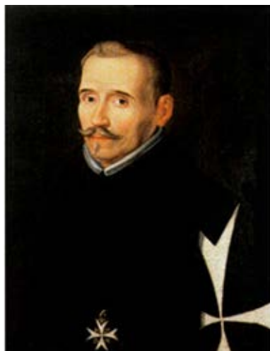
Fig. 3. Retrato de Lope de Vega , Atribuido a Eugenio Caxes, óleo sobre lienzo, 63 x 51 cm., 1634.

el adjetivo de Castillo Solórzano bien pueden ser el conde de Rebolledo o Lope de Vega, autores que ofrecen repetidamente un rasgo identitario y de distinción en sus volúmenes, utilizando de manera sistemática la representación de sus rostros, en una forma de autoridad reclamada para su condición autorial.