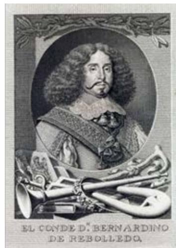
Fig. 4. Retrato del Conde de Rebolledo , Parnaso español, colección de poesías escogidas de los más célebres poetas castellanos , T.V, 1772.

En un contexto marcado por los orígenes de la baja aristocracia, Rebolledo representa al hombre de armas y diplomático que destaca más en su papel de político o como embajador que en su perfil de poeta, mientras pone sus versos al servicio de sus metas, aunque sin dejar de autorreivindicarse. En las diferentes ediciones de los versos de Rebolledo se recurre de forma sistemática al uso del retrato, ofreciendo un rasgo de distinción, además de aportar credibilidad a la obra a modo de firma o marca autorial (Ruiz Pérez 2009). Estos retratos del autor preceden siempre a los paratextos de las obras y, en ocasiones, también se encuentran acompañados de retratos correspondientes a los dedicatarios de sus líneas (Martín Puya) o a sus dedicatarias (Ruiz Pérez y Cárdenas Luna). Centrándonos en los retratos del autor, cabe decir que estos se caracterizan por ser siempre representaciones de grabado. Además, Rebolledo aparece siempre representado de busto y en la habitual posición de tres cuartos, en edad adulta y con la mirada fija en el espectador. El autor se encuentra centrado y dominando la composición, mostrando su imagen como figura relevante y reconocida; se mantiene la misma iconografía en todas sus representaciones. Podemos observar que el autor se representa en postura típica, con pose de cierta con-