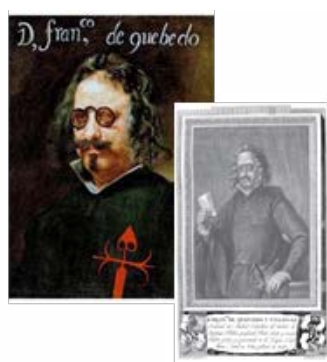
Fig. 14. Retrato de Quevedo, Juan Van der Hamen, óleo sobre lienzo, 48x60, 5, 1650. Fig. 15. Retrato de Quevedo, grabado, Imprenta Real, Madrid, 1791.