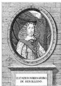
Fig. 6. Ocios , grabado, 1660.