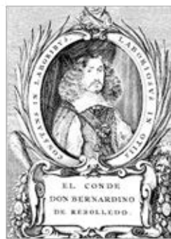
Fig. 7. Selva militar , 1661, grabado de J. Ballester, 1791.