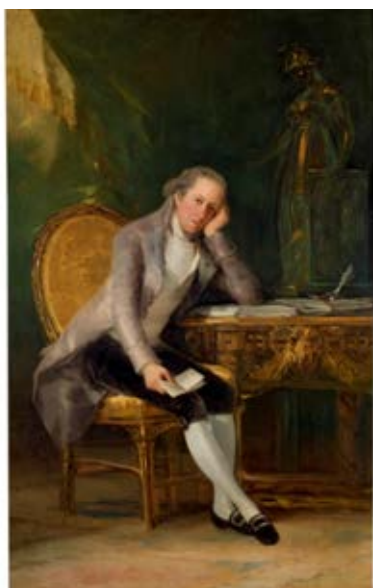
Fig. 23. Gaspar Melchor de Jovellanos, Francisco de Goya, óleo sobre lienzo, 205x 133 cm. Museo del Prado, Madrid, 1798.