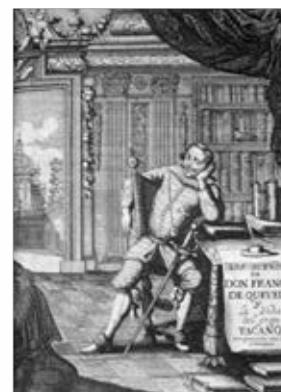
Fig. 22. Obras de Francisco de Quevedo , Amberes, 1699, I, p. 229.

La consolidación del vínculo de la representación arquetípica del autor se trasluce en las representaciones de Quevedo 22 y Torres Villarroel (fig. 22 y 21), obras en las que la eficacia pragmática de la representación se configura en la misma dirección que las comentadas obras de Goya o Durero. En ambas imágenes encontramos al autor sentado ante su escritorio con sus instrumentos de trabajo sobre la mesa. Aunque la actitud de estos personajes dista mucho de la imagen prototípica del autor en su gabinete, tal y como podemos observar