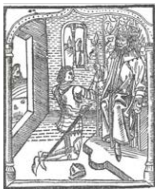
Fig. 1. Afonso de Cartagena, Doctrinal de Caballeros , 1487.

tacionales aparecían con frecuencia en códices que pasaban a ser propiedad del dedicatario, es más, a llevar la firma de este como único elemento de identidad, eclipsando la autoría bajo la categoría de la posesión. En la lectura de estas imágenes de relación entre escritor y soberano es clave atender a su relación con una iconología menos específica y previamente codificada; así, el autor ocupa el lugar del fundador, y el rey (o el poderoso que recoge la obra), el de Dios (Buiguès).