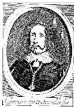
Fig. 5. Ocios , 1650.

Entre los siglos XVI y XVII el desarrollo de la conciencia profesional de los creadores y del espacio social del autor impulsa la forja de un incipiente campo literario (Bourdieu).