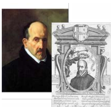
Fig. 12. Retrato de Luis de Góngora y Argote, Diego de Velázquez, óleo sobre lienzo, 51 x 41 cm, 1622, Museo de Bellas Artes de Boston, EEUU. Fig. 13. Retrato de Luis de Góngora y Argote Juan de Courbes, 1530.

Aun yendo a contracorriente de la cronología de las obras, presentamos inicialmente los retratos de Rebolledo como representante singular de la canonización genérica de autor, en contraposición con la singularidad y distinción del creador único e irrepetible que configuran los retratos de Lope de Vega. Tanto los retratos de Rebolledo como los de Lope carecen de gestos o escenografía (salvo en algún caso particular). Estos suelen mostrarnos a un autor que posa en calma con la única función de ser retratado, creando en su continuidad la idea de serie y, en consecuencia, el reconocimiento de una figura arquetípica. Rebolledo mantiene una imagen fija con la reiteración de los mismos atributos, mientras que en Lope es tangible una preocupación de individualización, exhibiendo una imagen cambiante y en continua personalización que refleja a través de la edad el discurso de su trayectoria.