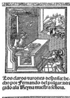
Fig. 20. Fernando del Pulgar, Los claros varones de España , hecho por Fernando del pulgar: otorgado a la Reyna nuestra Señora. 1500.

incidencia en las letras hispanas desde finales del siglo XVI. De nuevo en el grabado de Durero, Saturno, representando la contemplación del universo, parece vigilar la escena, en tanto que los elementos geométricos que aparecen tirados en el suelo componen una imagen del hastío, pero también de la distancia entre el acto de la concepción creativa y el de la realización material. El reloj de arena y los elementos de construcción muestran la limitación del creador por el espacio y el tiempo. Por su parte, la obra de Goya se centra en el momento del sueño más que en el de ensoñación que produce la melancolía del creador, provocando numerosos monstruos en su estado de letargo. No obstante, en un primer momento, ni juicio ni acción dominan este estado de ensoñación, y el autor en trance simboliza la conciencia artística en su acto mismo de creación, con lo que se produce una continua dialéctica entre lo racional y lo fantasioso y entre el mundo real y el onírico. Podemos ver que, frente al autor oferente de las imágenes medievales, prima la autonomía del escritor y su posibilidad de elevarse a partir de su estudio y erudición. El precio de esto es una conciencia que se traduce en melancolía, uno de los conceptos clásicos componentes de la creatividad.