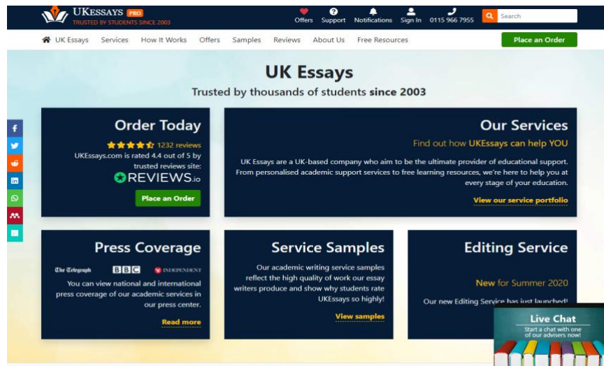
Figura 1. Captura de pantalla de un ejemplo de fábrica de ensayos: www.ukessays.com

La segunda tipología, a la que aquí nos referimos como probables fábricas de ensayos, cubre aquellos sitios que operan en los límites de la aceptabilidad pero que pueden vincularse o promover el fraude académico a través de contratos comerciales, por ejemplo alojando