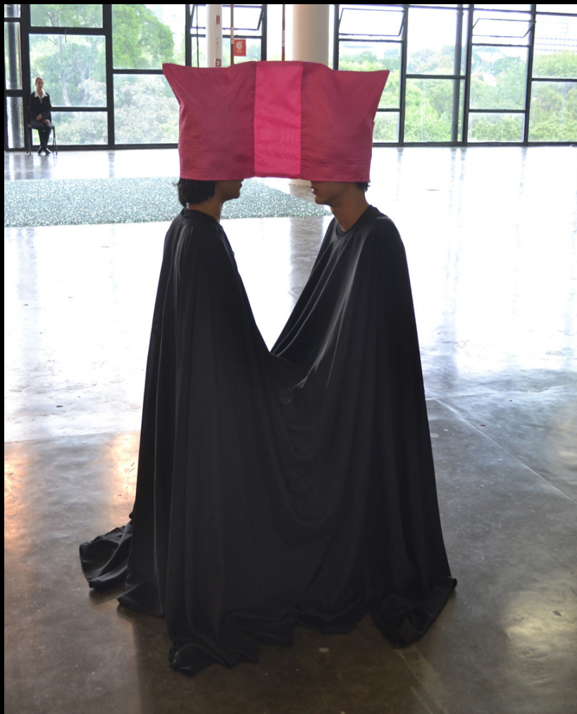
James Lee Byars