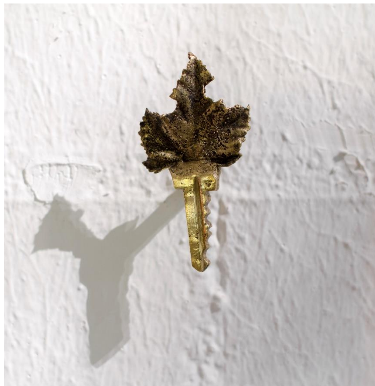
Fig. 5: “ Siete llaves maestras ” (detalle)