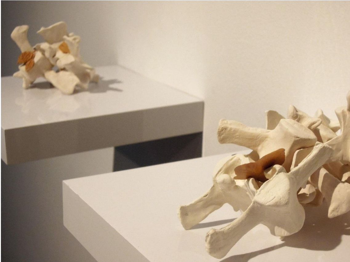
Fig. 15: Vertebrando . Cerámica / PLA medidas variables, 2018