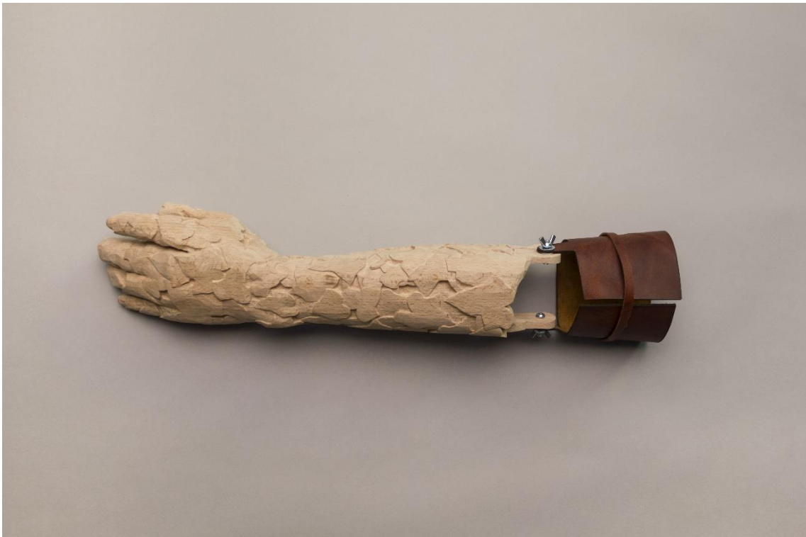
Fig. 8: La mano izquierda de la naturaleza . Haya (tallada a mano) y cuero 25 x 11 cm. 2015