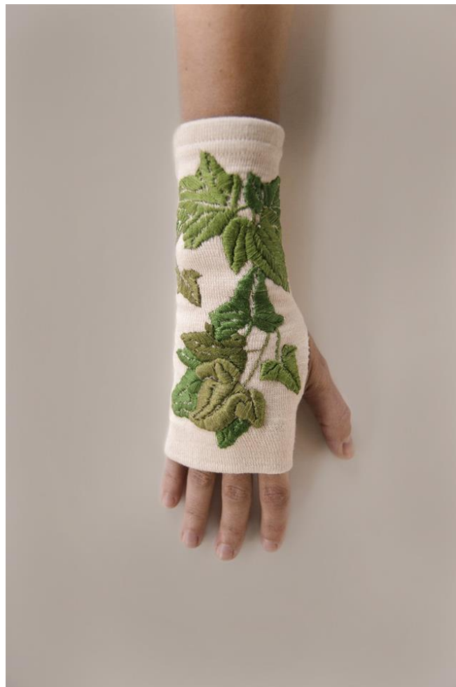
Fig. 11: Bordando la incapacidad . Fotografía / Muñequera bordada Tubos de ensayo / agujas / base de haya, 2015