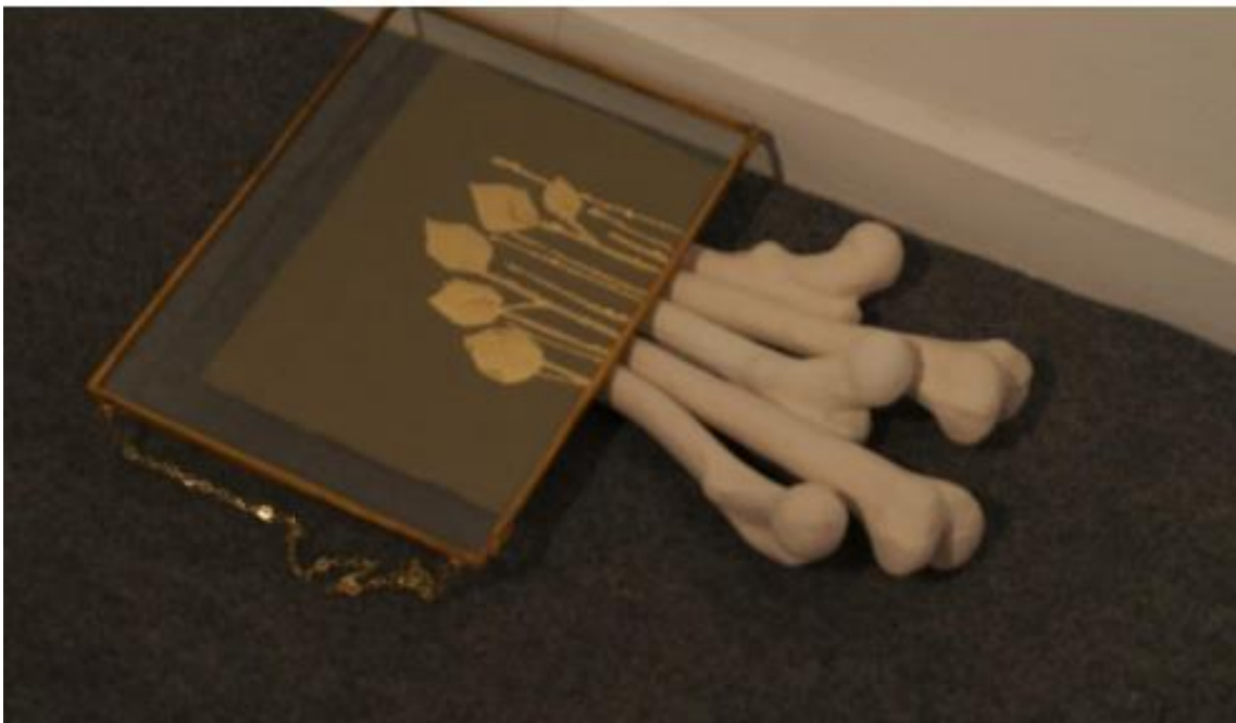
Fig. 16: Crecimiento Óseo . Cerámica / pan de oro / marco de cobre. Medidas variables, 2017