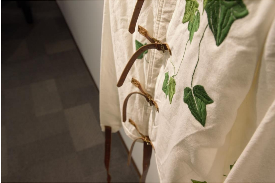
Fig. 10: Locura natural (detalle), 2015