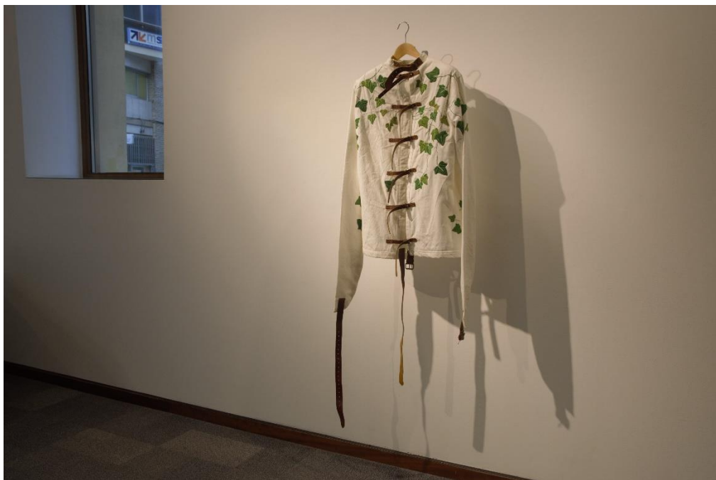
Fig. 9: Locura Natural . Camisa de fuerza /patronada/cosida/bordada Talla 48. 2015