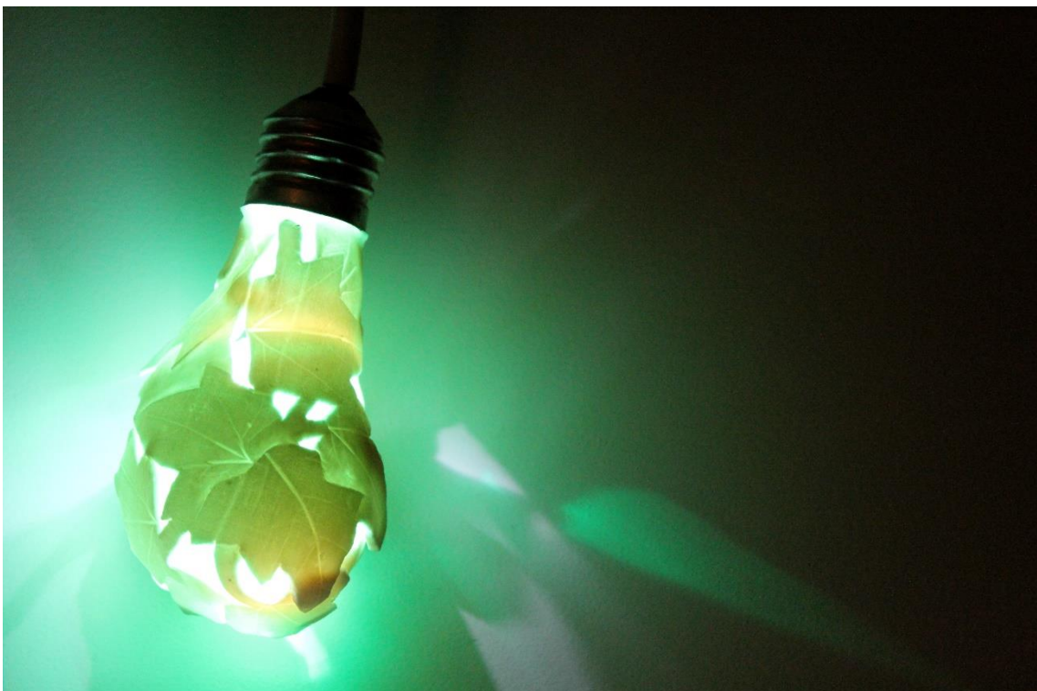
Fig. 3: Enredadera eléctrica (detalle). 2012