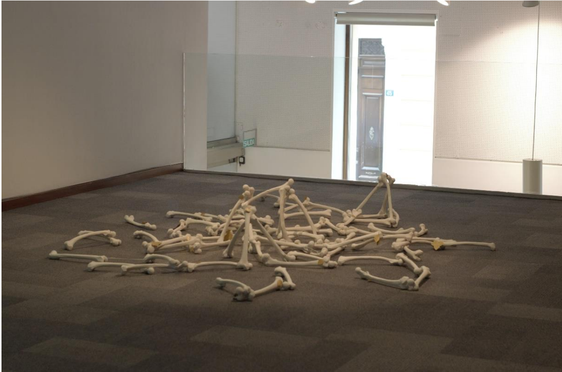
Fig. 13: Vegetación Ósea . Cerámica / PLA Medidas variables, 2018.