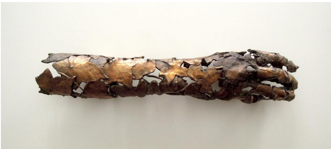
Fig. 7: Reliquia de la mano derecha de la naturaleza . Bronce 40 x 8 cm. 2014