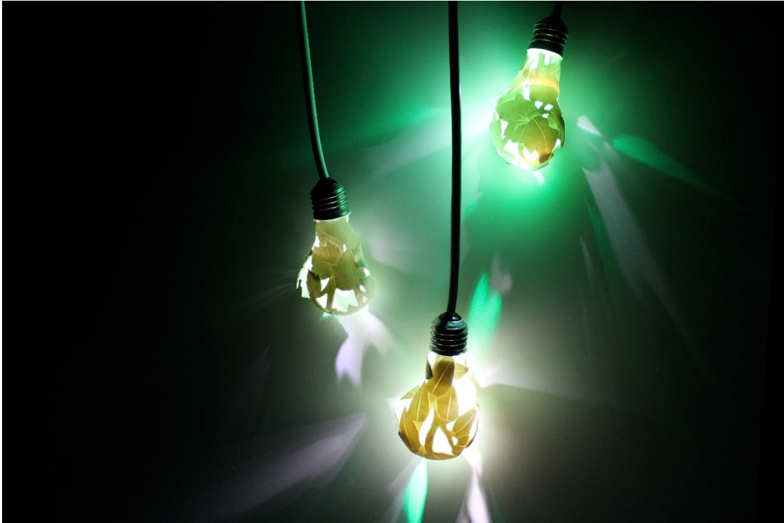
Fig. 2: Enredadera eléctrica . Porcelana, 15 x 6 cm. aprox. unid. (14 piezas). 2012