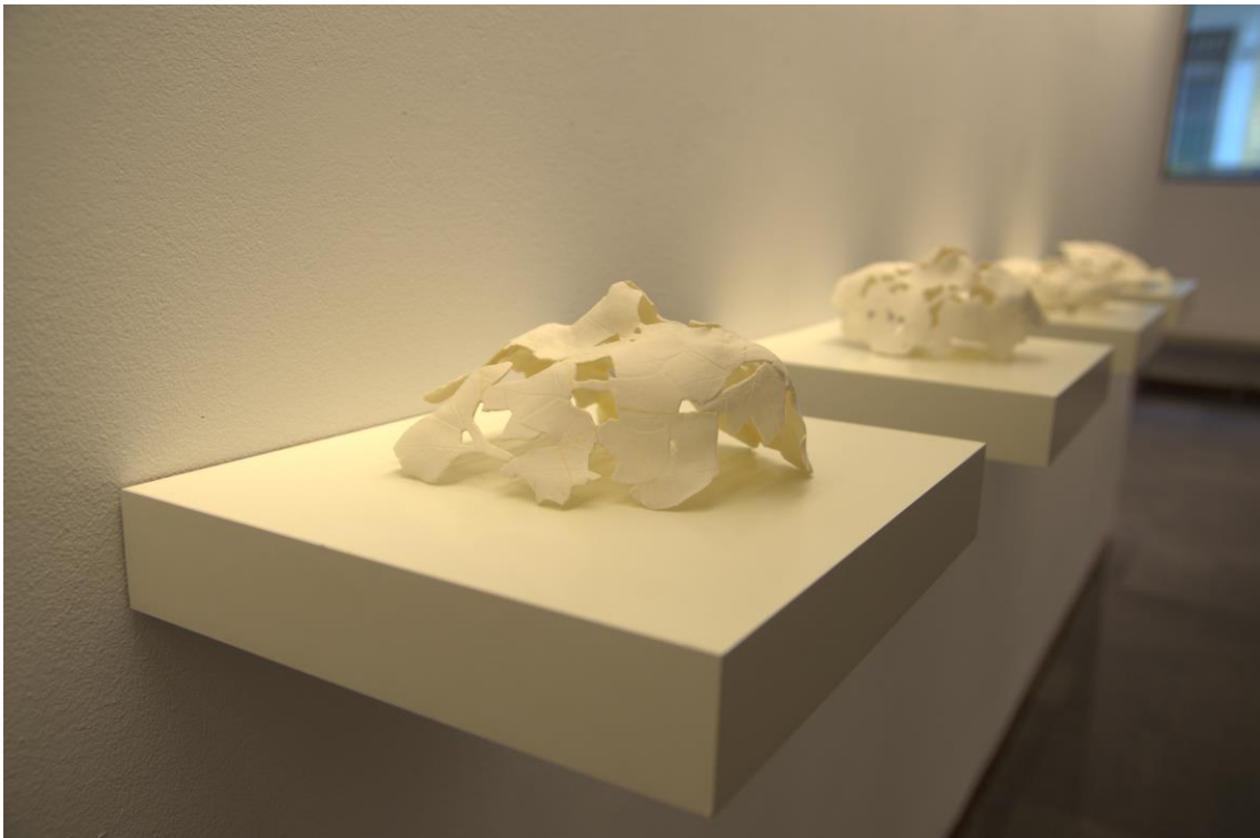
Fig. 6: Epifanía advenida . Porcelana 18 x 15 cm. aprox. unid. 2012