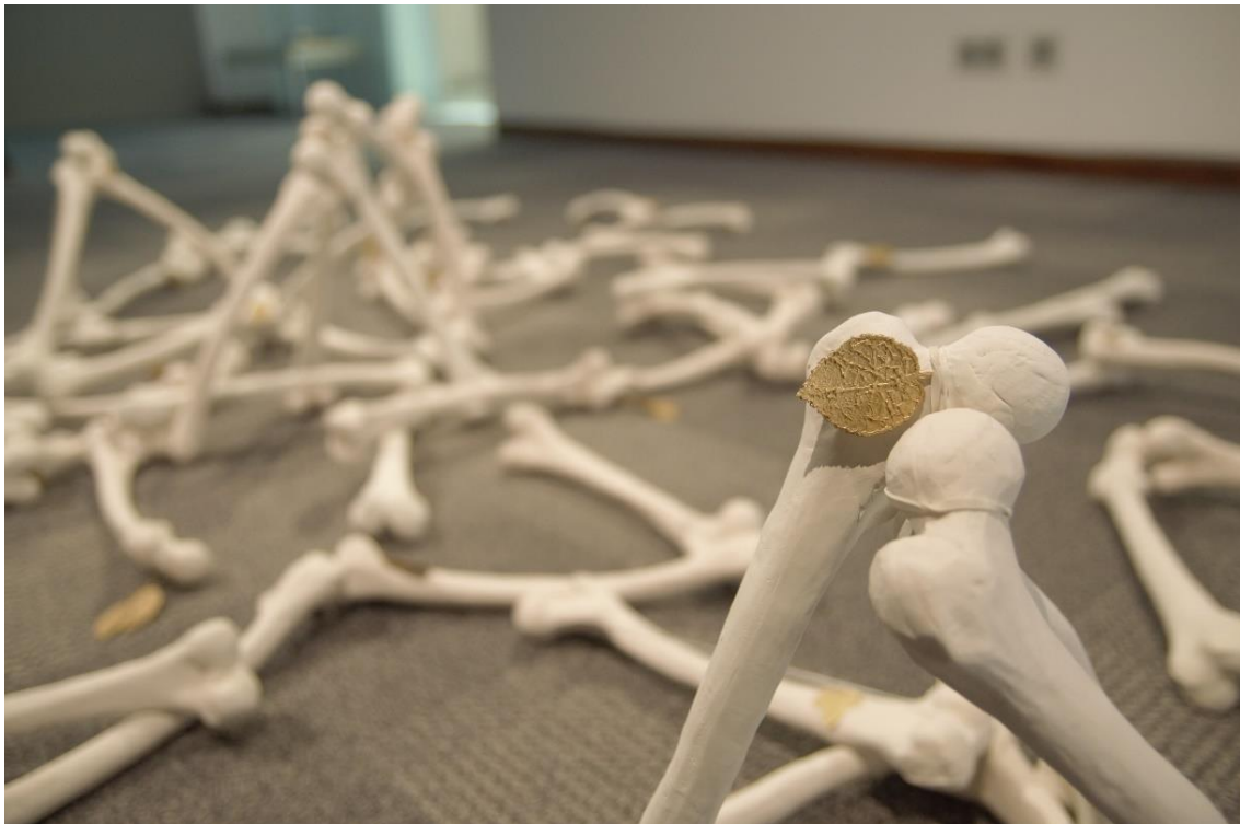
Fig. 14: Vegetación Ósea (detalle)