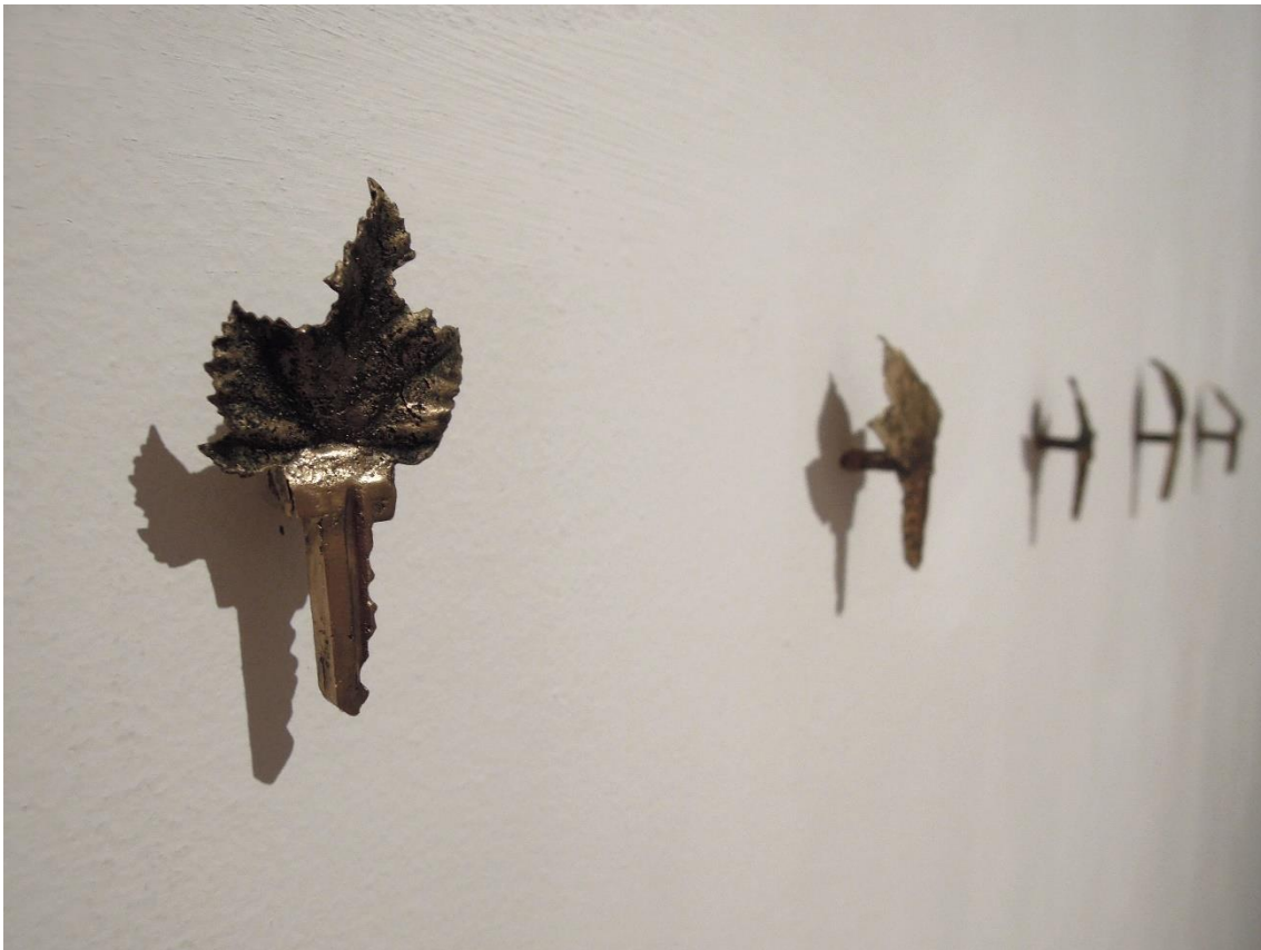
Fig. 4: Siete llaves maestras . Latón 8 x 4 cm. aprox. unid. (7 piezas) 2012