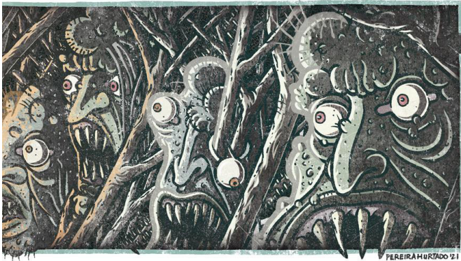
Detalles de: El Entramado V: A través del Pantano