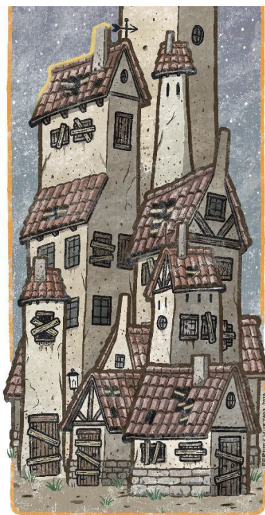
Detallesde: El Entramado IV: Refugio habitado