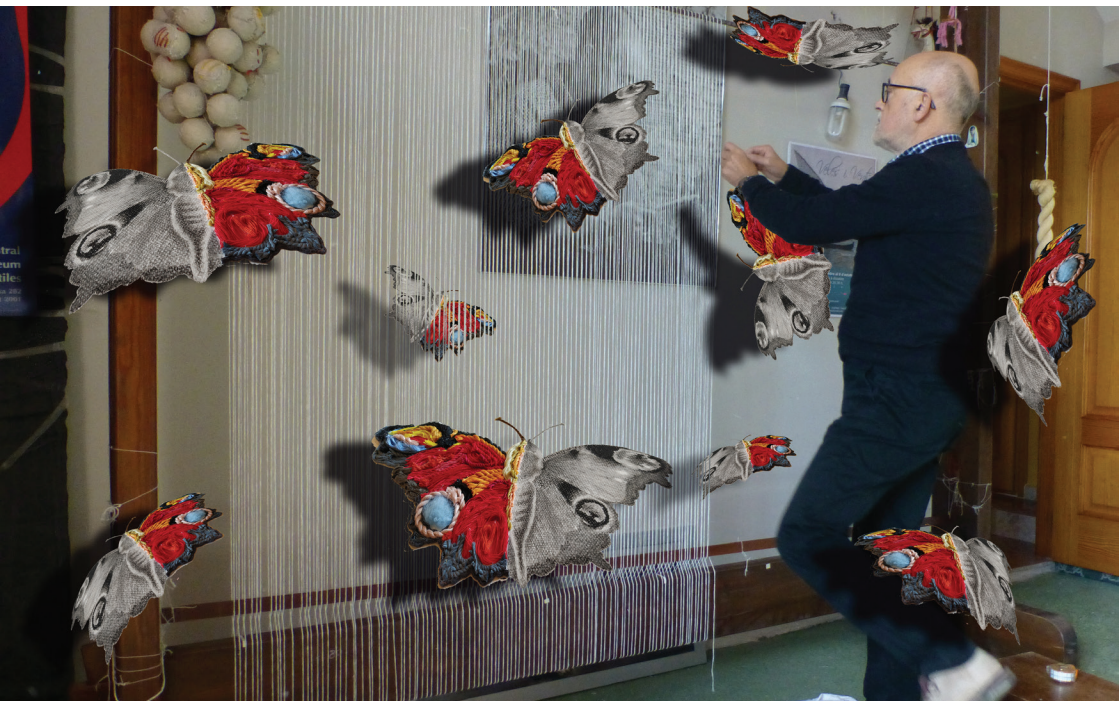
“Le rêve du papillo” Foto montaje con un telar de “alto lizo”

La tejeduría manual, en el apartado del “Tapiz de alto lizo”, por su fácil movilidad el tapiz era considerado un objeto de lujo de los más antiguos para decorar paredes y salones incluso -en algunas ocasiones- decoración de vías públicas. Y que ocurre cuando aprendes esta noble y ancestral técnica de tejer, que te comprometes con tendencias innovadoras, que aplicas indistintamente toda tu experiencia, todos tus conocimientos a esta histórica disciplina, incluso te invita y permite convertirlo en obras de arte contemporáneo, te conviertes en un investigador con infinitud de aplicaciones sobre todo tipo de materia textil -o no- pero si, sobre todo aquello que se deje “entre hilar”.