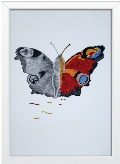
Somni Técnica mixta 35 x 47 cm.

En el mundo del Arte, -como casi siempre- viene de la infancia; al empezar nos inclinamos por “la disciplina” que más afinidad tenemos y con la que solemos empatizar con mayor facilidad. Se adquiere una formación continua que abarca una gran cantidad de contenidos como, estudios, viajes, visitas a museos, más estudios, deliberaciones, comparaciones, ilusión, práctica, diseño, creatividad, evolución, experiencia; todo esto, no solo te da muchos conocimientos, -que te los da- sino que además, se crea un binomio entre tu formación y tu personalidad con lo que se ejercen cambios continuos, y ocurre algo más, conoces otras disciplinas, te inicias en ellas, te sientes atraído e investigas más en aquella menos conocida por su poca difusión, en este caso el “Arte Textil”.