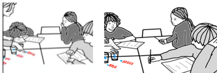
Figura 4. Profesora y Albert trabajando juntos (Radford, 2017)

En el análisis que realiza el profesor Radford sobre la interacción entre la profesora y Albert permite establecer elementos característicos del desarrollo de un proceso de subjetivación.