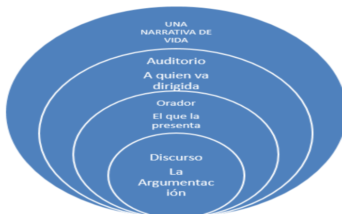
Figura 3. El discurso argumentativo, en la narrativa de vida

La producción de una narrativa de vida se realiza desde los discursos argumentativos el sí mismo como otro , es una necesidad en los intercambios de roles entre orador y auditorio.