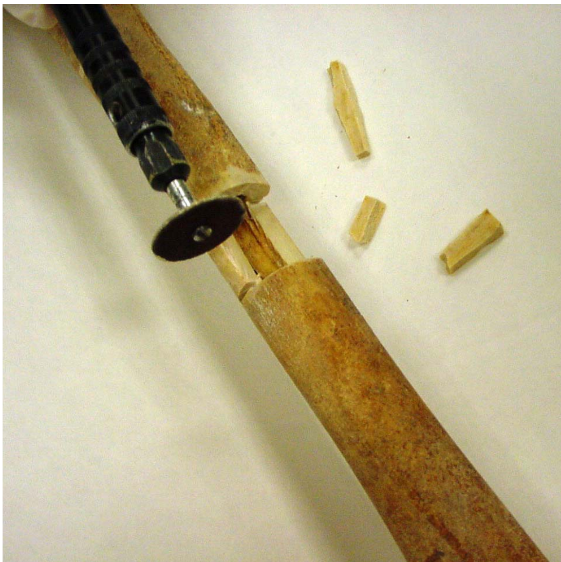
Lám. I.—Limpieza y tratamiento de las muestras en el laboratorio.