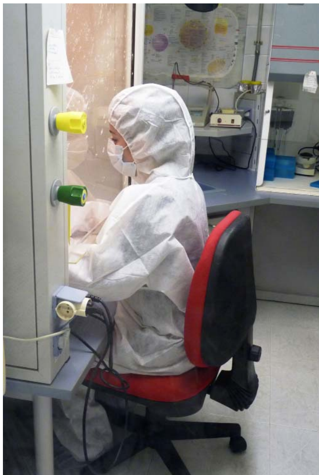
Lám. II.—Condiciones de trabajo con muestras de aDNA.