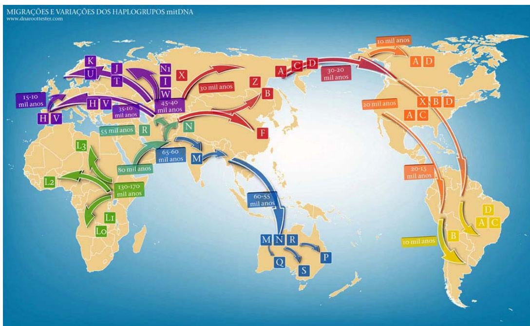
Fig. 1.—Mapa de la evolución y migración de los principales haplogrupos mitocondriales.

Estos estudios han determinado una misma unidad monofilética, llamada haplogrupo, que resultan ser específicos de variantes geográficas diferentes de la especie humana (fig.1). En la actualidad los estudios se realizan mediante análisis completos del ADN mitocondrial, secuenciando todo su genoma, gracias al abaratamiento de las técnicas así como a la aparición de las técnicas de secuenciación de nueva generación (NGS) (Li et al. , 2010:237-249).