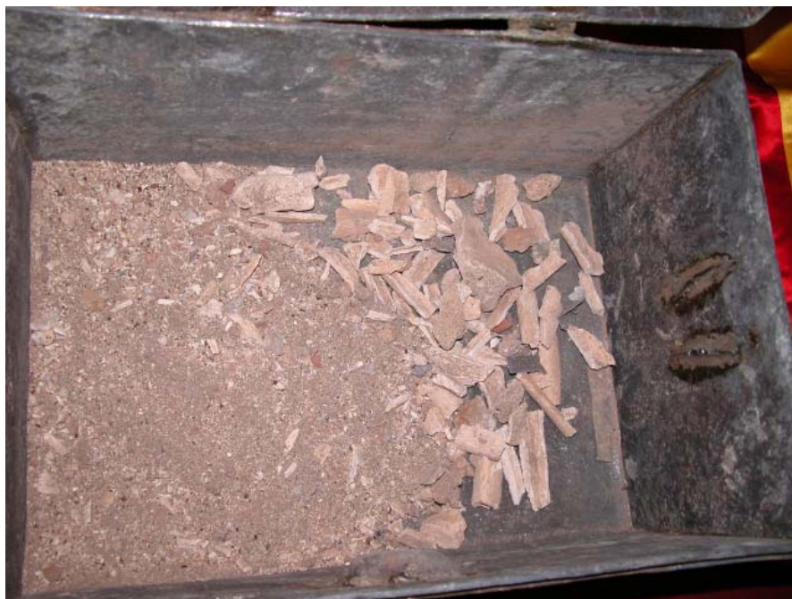
Lám. IV.—Restos óseos pertenecientes a Cristóbal Colón encontrados en la catedral de Sevilla.