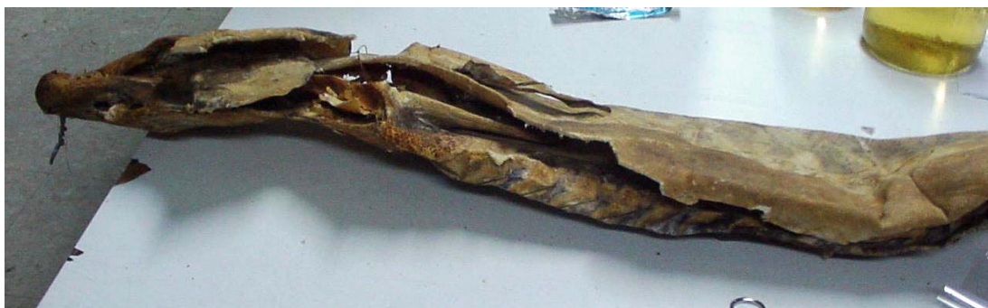
Lám. III.—Esturión capturado en el río Guadalquivir.