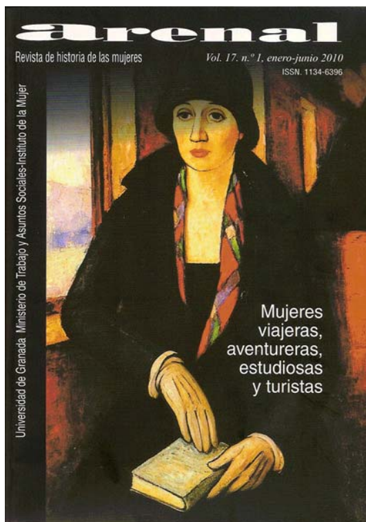
Portada del vol. 17.1 dedicado a Mujeres viajeras.

“Mujeres viajeras, aventureras, estudiosas y turistas”, C. Segura: “En la Edad Media las mujeres también hicieron el Camino de Santiago”. Arenal , 17, 1 (2010) 33-53.