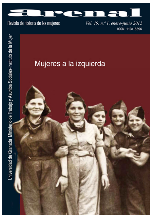
Portada del vol. 19.1 dedicado a Mujeres a la izquierda.

La cuestión de la diferencia sexual y de las relaciones de poder entre los sexos ha abierto nuevos debates en el seno del feminismo. A ellos se refiere el reciente libro de Nancy Huston que critica los presupuestos considerados por la autora como maximalistas en aquellos estudios de género que defienden la absoluta inestabilidad y movilidad de las identidades, que pueden construirse o reconstruirse hasta hacer desaparecer las diferencias sexuales. Para Huston se trata de un planteamiento que elude la realidad, que obvia la existencia de una base corporal, biológica, que sostiene las diferencias que se observan en las conductas de los hombres en los actos de codicia y de violencia con las mujeres, etc. En este sentido defiende una aproximación intelectual que analice de manera real la diferencia de los